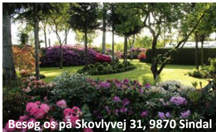
Besøg os på Skovlyvej 31, 9870 Sindal

Mange planter er hjemmeavlede og der er plantesalg.