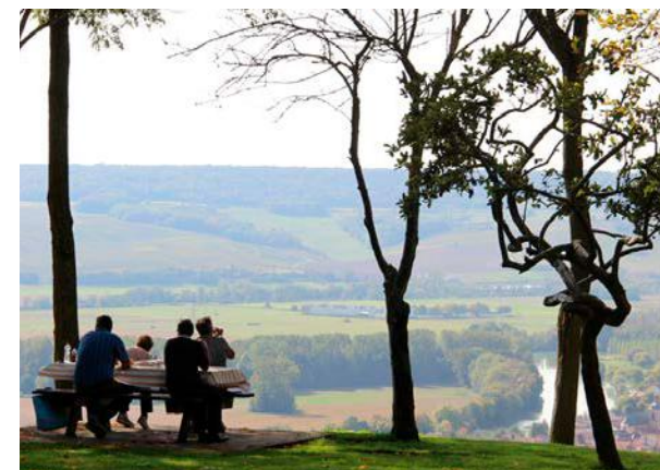
Des expériences immersives à vivre depuis trois des plus beaux points de vue sur le vignoble.

✓ Jusqu'au samedi 21 septembre, à la médiathèque Simone-Veil, Épernay. Entrée libre.