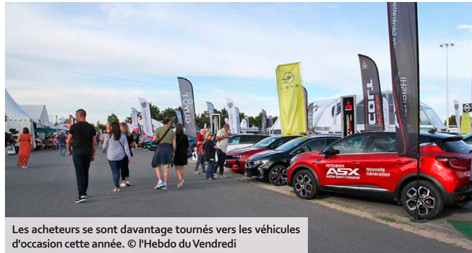
Les acheteurs se sont davantage tournés vers les véhicules d'occasion cette année.

F rançois Hollande, Xavier Bertrand, Jordan Bardella, Marc Fesneau et même Gabriel Attal : la 78e Foire de Châlons a confirmé, s'il en était besoin, son pouvoir d'attraction sur les personnalités politiques, tous partis confondus. Et ce, malgré un contexte national tumultueux. Contexte qui, de l'avis de plusieurs exposants, a pesé négativement dans la balance commerciale locale. En particulier pour les achats « plaisir » nécessitant un budget conséquent. « On est un peu déçu de la fréquentation sur la semaine, concède un représentant de l'enseigne marnaise Tout feu tout flamme, spécialiste des barbecues et braséros. Traditionnellement, les allées sont bondées. Cette année, c'est loin d'être le cas dans notre hall. On a tout de même vendu une trentaine d'appareils. Reste à voir si les prises de contacts sont concluantes par la suite. » Plus loin, une société auboise revendeuse de la marque Singer enregistre 70 ventes de machines à coudre en onze jours. Des bénéfices en ligne de mire ? « On