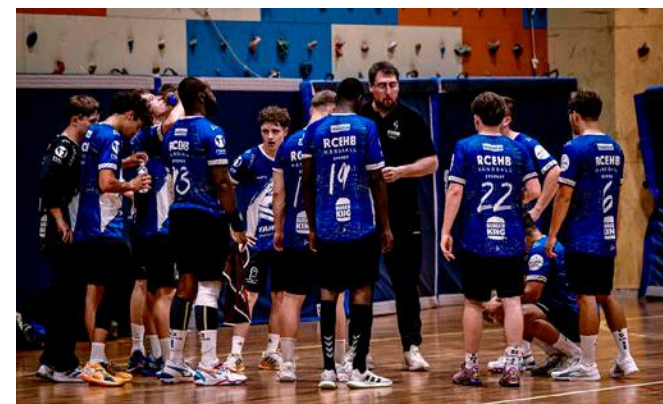
Le club d'Épernay se jette dans le grand bain de la N3, ce samedi, au palais des sports Pierre-Gaspard.