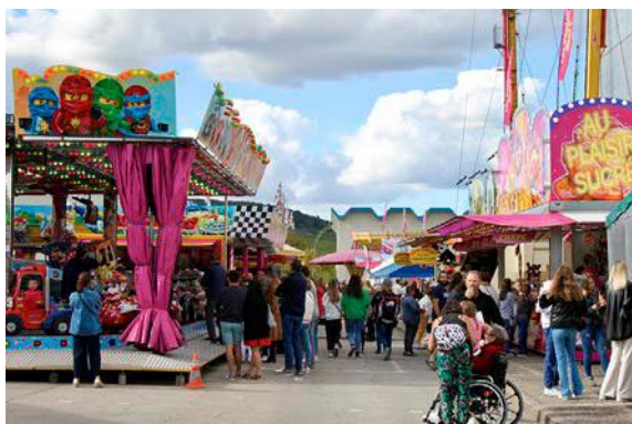
Des dizaines d'attractions accueillent les visiteurs, tous les jours, jusqu'au dimanche 29 septembre.

S'il est aisé de se garer sur le site du Millesium, les visiteurs qui privilégient les transports en commun ou qui ne disposent pas de moyen de locomotion peuvent profiter des navettes gratuites. Reliant la fête au centre-ville, elles fonctionnent tous les jours, aux heures d'ouverture des manèges, à raison d'un départ toutes les 30 minutes, depuis l'arrêt situé près de l'esplanade Charles-de-Gaulle, au niveau du restaurant La Pomme d'or.