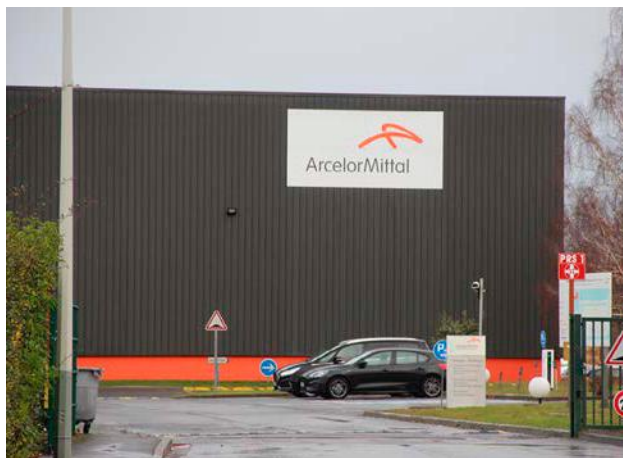
ArcelorMittal centres de services compte environ 220 travailleurs.

La CGT entend porter « des revendications fortes sur les besoins d'investissements industriels, sur l'emploi, sur les salaires, sur la reconnaissance de la pénibilité, sur la nécessaire intervention de l'État et des régions dans les stratégies menées, notamment au regard de fonds publics particulièrement importants captés par le patronat du secteur ». L'an dernier, la Commission européenne a en effet donné son feu vert à un montant d'aides publiques de 850 M€, visant à aider ArcelorMittal à décarboner partiellement sa production d'acier.