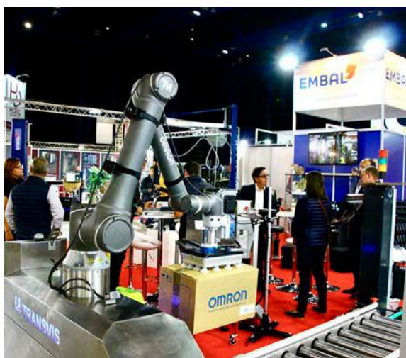
Lors de la dernière édition en 2022, 17 500 visiteurs ont arpenté les allées du salon Viti Vini.

Côté conférence, le Crédit Agricole invitera à échanger sur « l'avenir de la prestation en champagne, pour capter les nouveaux métiers, de la plantation à la commercialisation ». Quant à la passerelle des métiers, jugée « indispensable », elle sera reconduite « avec l'ambition de faire découvrir la palette des métiers à ceux qui recherchent des formations dans le vignoble et auprès des entreprises connexes ».