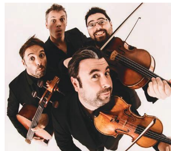
Le quatuor Leonis.

Six autres rendez-vous suivront jusqu'à la fin du mois de septembre, à Châlons, Montmirail ou encore Mourmelon. Et pour la toute dernière date, le 6 octobre, le festival Les Itinéraires s'arrêtera à Chouilly et au champagne Nicolas Feuillatte, où les plus grandes musiques de films seront interprétées par l'Orchestre symphonique départemental des jeunes marnais.