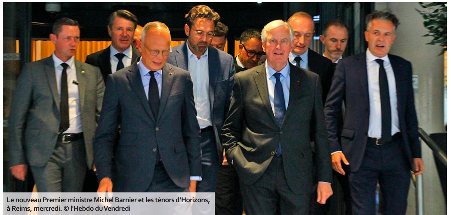
Le nouveau Premier ministre Michel Barnier et les ténors d'Horizons, à Reims, mercredi.

Deux heures plus tard, c'est à nouveau entouré