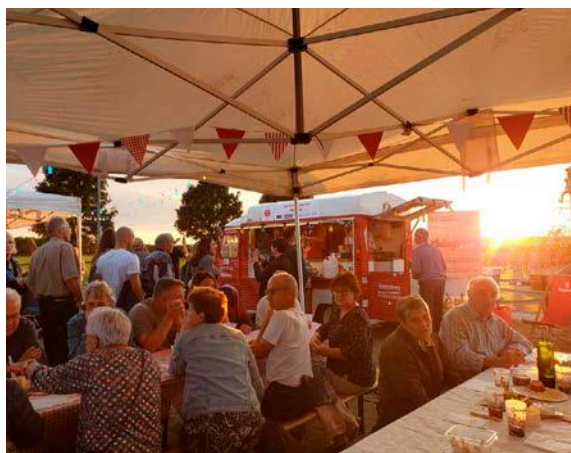
La guinguette mobile animera le village de Villiers-aux-Bois, le jeudi 19 septembre.

Alors que plus de 60 % des communes françaises ne disposent plus de commerces de proximité, Épernay Agglo Champagne a décidé de s'appuyer sur le savoir-faire de l'association Action territoriale et sur l'initiative « 1000 cafés » portée par le groupe SOS, afin de proposer un projet événementiel dans quatre de ses villages. Comme son appellation le laisse deviner, le dispositif « 1000 cafés » vise à accompagner la création et le développement de cafés à la campagne. Ce projet permet ainsi de concevoir des espaces de convivialité, le plus souvent multiservices, avec pour objectif principal de maintenir le lien social et la convivialité dans les territoires ruraux ayant perdu ou en passe de perdre leur dernier commerce. Il se décline également sous la forme d'une guinguette mobile, modèle de café itinérant entre plusieurs communes d'un même territoire. C'est cette formule que l'agglo d'Épernay va tester dans quatre de ses communes, « toutes volontaires ». La première à être visitée sera Villiers-aux-Bois, 330 habitants, le jeudi 19 septembre. Ce jour-là, la guinguette mobile ouvrira ses portes à partir de 18 h, proposant un concert gratuit, assuré par le groupe local « Les coqs en pâtes », et une offre de restauration, via un foodtruck. Vinay, Pierre-Morains et Chaltrait suivront dans la foulée, respectivement les 20, 21 et 22 septembre.