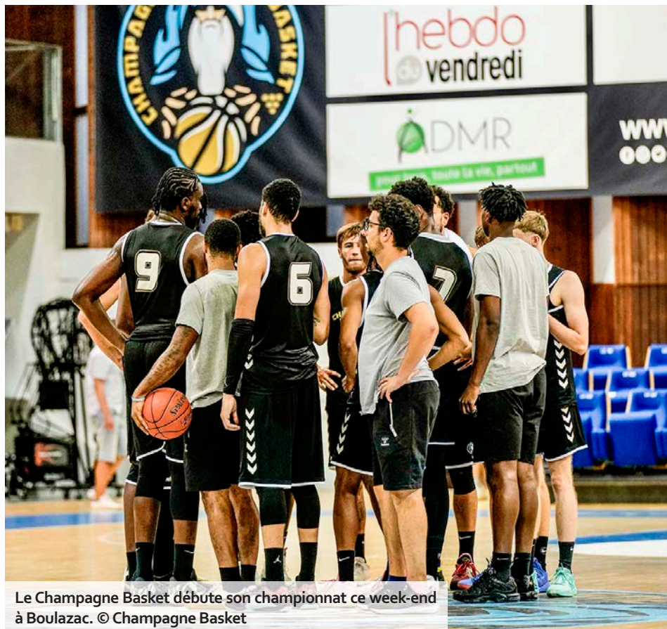
Le Champagne Basket débute son championnat ce week-end à Boulazac.