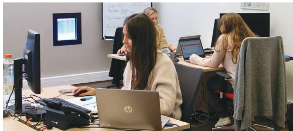
Huit employés ont été appelés en renfort au sein de la cellule vendange pour faire le lien entre les vignerons et les candidats aux postes de cueilleurs.

Le souci, et il n'est pas nouveau, c'est qu'il n'est pas aisé de trouver un candidat pour chaque emploi proposé. « Nous avons encore environ 600 postes à pourvoir, admet la responsable. Le principal problème, c'est la mobilité et elle concerne la moitié des candidats, qui n'ont soit pas le permis, soit pas les moyens de posséder une voiture ». Pour