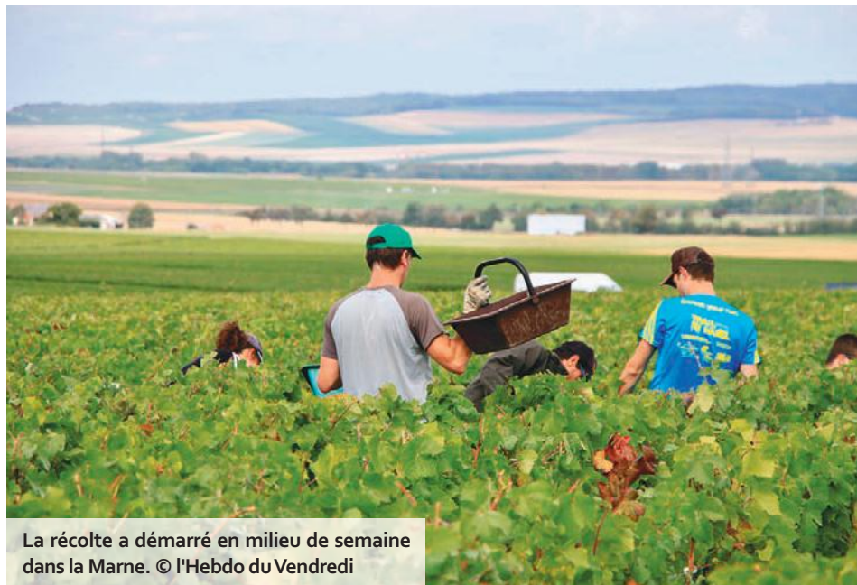
La récolte a démarré en milieu de semaine dans la Marne.

Deux mois après cette annonce, place au terrain et à la récolte, laquelle a débuté dès samedi dernier dans les secteurs les plus précoces de l'Aube. Dans la Marne, le coup d'envoi a été donné jeudi, mais les chardonnays, dont la maturation est plus lente, seront récoltés en dernier, soit le 24 septembre pour les villages les plus tardifs. Selon les premières observations de l'interprofession, le rendement agronomique de l'appellation se situera entre 9 000 et 10 000 kg/ha. « On est