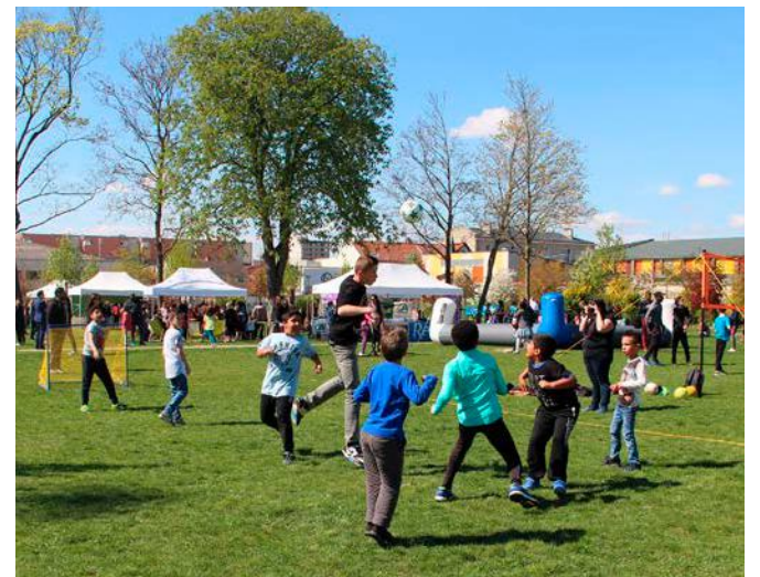
Ce dispositif se décline en 10 matinées, toutes le samedi, réparties sur l'ensemble de l'année scolaire.

P orté par la ville d'Épernay, le dispositif les 10 rendez-vous du samedi sont reconduits pour une nouvelle année. Gratuit sur inscription, il propose aux jeunes Sparnaciens en classe de CM1 et CM2 de découvrir différentes disciplines sportives, lors de dix matinées réparties tout au long de l'année et encadrées par des clubs et des éducateurs de la collectivité. Pour s'inscrire, il suffit de retourner la fiche distribuée dans les écoles élémentaires au service des sports de la ville (par courrier ou par mail), avant le vendredi 20 septembre. La première séance est en effet programmée le samedi 28 septembre. Pour l'occasion, les enfants pourront tester le rugby, le canoë et le VTT.