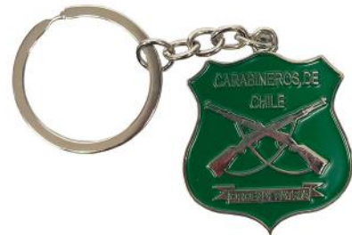
LLAVERO ESCUDO CARABINEROS