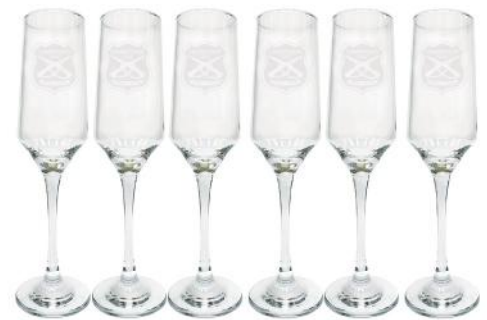
COPAS SET DE 6 COPAS