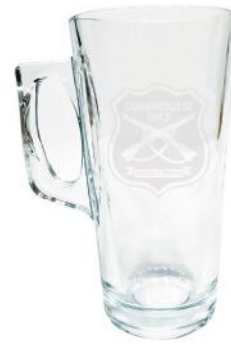
VASO GRANDE / CAJA