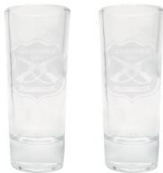
VASOS SET DE 2 VASITOS TEQUILÑA