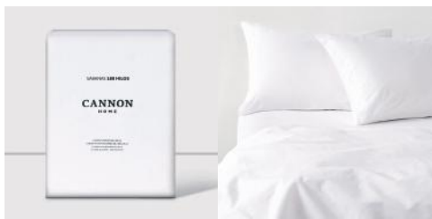
CANNON SABANA 180H JSCNBC001 P20Z BLANCO 2P