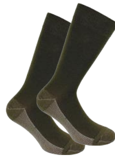
MONARCH CALCETÍN VESTIR BAMBÚ/ALGODÓN +CO 8020