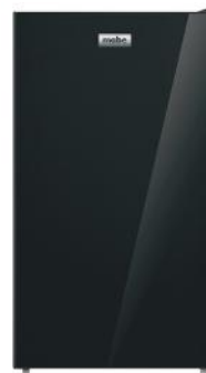
MABE FRIGOBAR RMF04LRX0