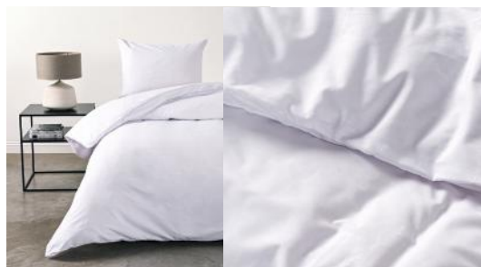
CANNON FUNDA PLUMON 200H FDCNBEA01P20X BL 2P