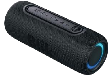
BLIK PARLANTE LIVE