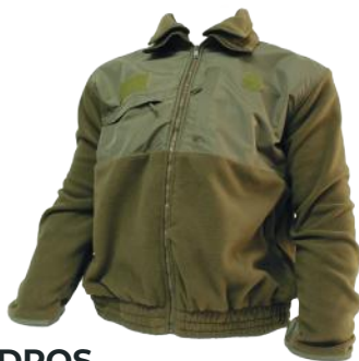
DROS CASACA POLAR INSTITUCIONAL