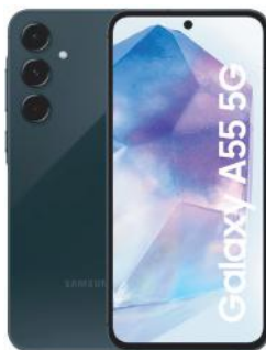
SAMSUNG CELULAR GALAXY A55 256GB