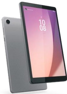
LENOVO TABLET M8 4TA GEN8 4G+64GB WIFI