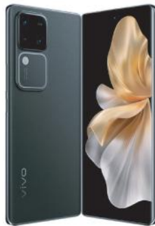
VIVO CELULAR VIVO V30