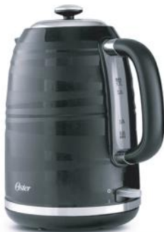
OSTER HERVIDOR 4177BK