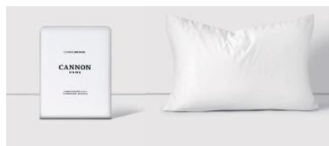
CANNON FUNDA ALMOHA 180H SFCNBC001 57Z BLA