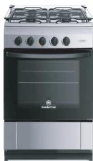
MADEMSA COCINA MV220T