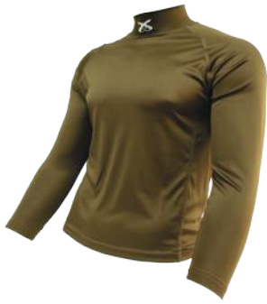
DROS BEATLE OPERATIVO UNISEX