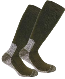
MONARCH CALCETA TERMICA ALG+COB 8031