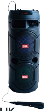
BLIK PARLANTE KARAOKE SCREAMER3