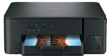
BROTHER IMPRESORA MULTIFUNCIONAL DCPT230