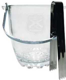
HIELERA CON PINSAS