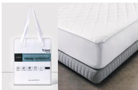
CANNON PROTECTOR WP CCCNBWA01O20Z 2PL