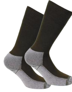
MONARCH CALCETA BOTA ALG+COB 8012