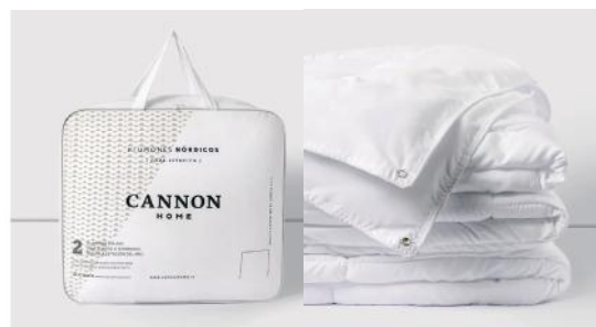
CANNON PLUMON PLCNCFA01P20Z BLANCO 2P