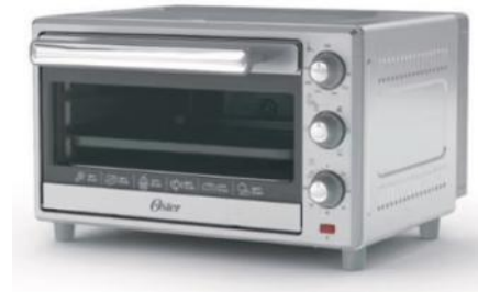
OSTER HORNO CON FREIDOR Y AIRE LS25-25LTS