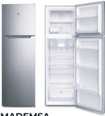
MADEMSA REFRIGERADOR ALTUS 1250