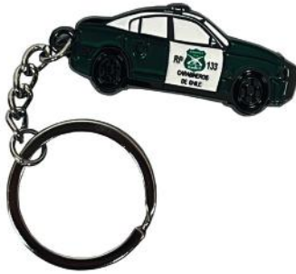
LLAVERO PATRULLA CARAB.