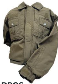
DROS CASACA OPERATIVA

N° ORDEN: 14292/14293/14294/14494/14295/14296/14396