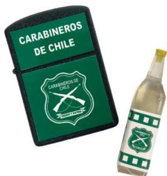
ENCENDEDOR Y LLAVERO