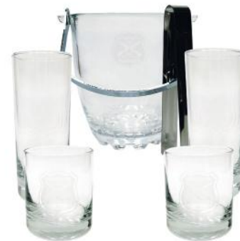
JUEGO DE HIELERA 4 VASOS/CAJA