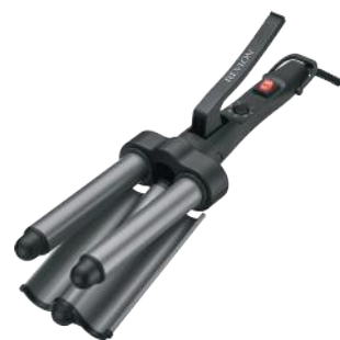
REVLON ONDULADOR WAYER JUMBO 3 BARRILES