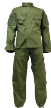
DROS TENIDA INSTRUCCIÓN UNISEX

STOCK: N° ORDEN: 14128/14129/14130/14131/14132/14133/14134/14490/14491