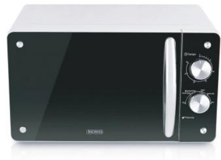
THOMAS MICROONDAS TH-20S01