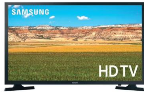
SAMSUNG LED UN32T4202AGXZS