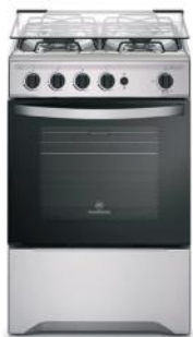
MADEMSA COCINA 520T