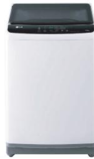
LG LAVADORA WT9WL.ABWPECL