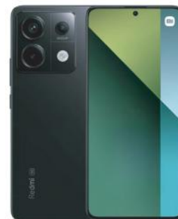
XIAOMI CELULAR REDMI NOTE 13 PRO 5G 8GB