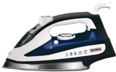
THOMAS PLANCHA TH-7170