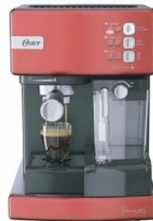
OSTER CAFETERA BVSTEM6603R