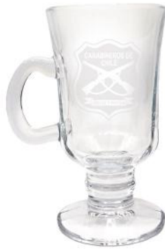
TAZA CAPUCCINO GRANDE /CAJA