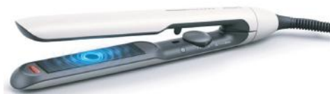
PHILIPS ALISADOR MOD BHS515/00