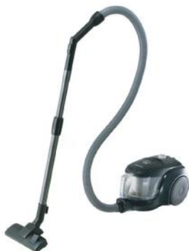
SAMSUNG ASPIRADORA VCC4580V3K/XZS