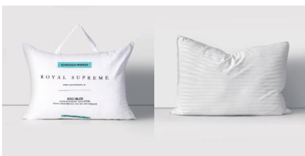
ROYAL SUPREME ALMOHADA RSUPREME ALRSGDA01A57Z 70X50