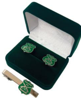
COLLERAS Y PASADOR DE CORBATA