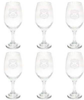
COPAS JUEGO DE 6 COPAS