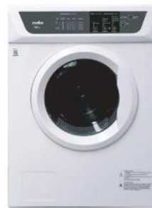
MABE SECADORA MABE SEM101BDBY