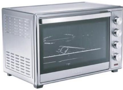
THOMAS HORNO ELECTRICO TH-62i