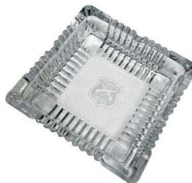
CENICERO GRANDE CUADRADO