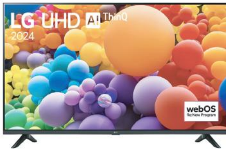
LG LED 43UT7300PSA.AWHQ