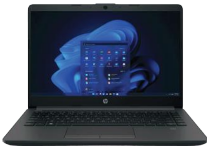
HP NOTEBOOK 245 G9 RYZEN 3 3250UW11H8GB 256GB