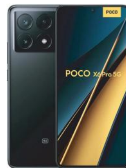
XIAOMI CELULAR POCO X6 PRO 5G 512GB