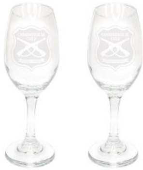
COPAS SET DE 2 COPAS INSTITUCIONALES