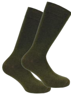
MONARCH CALCETÍN VESTIR BAMBÚ/ALGODÓN UNISEX 8013 T.U