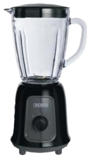
THOMAS LICUADORA TH-330V