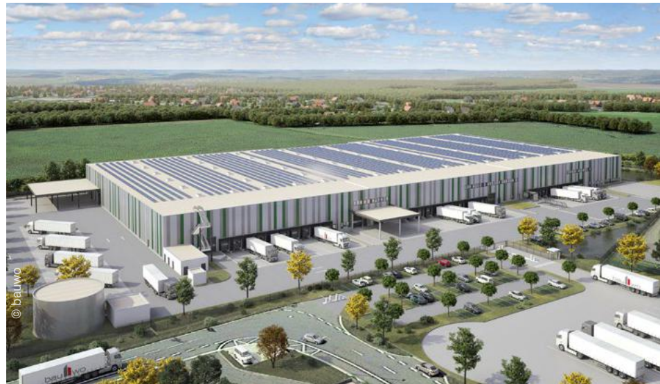
Magazyn logistyczny typu multi-user, którego powierzchnia wraz z półpiętrzem wyniesie około 26 000 m 2 , powstaje obecnie w Hodenhagen koło Hanoweru (wizualizacja).

Od 2023 roku będziemy zarządzali regionalnym centrum dystrybucji firmy Buderus, marki należącej do grupy Bosch Thermoteknik. Specjalny magazyn typu multi-user powstaje obecnie w Hodenhagen koło Hanoweru.