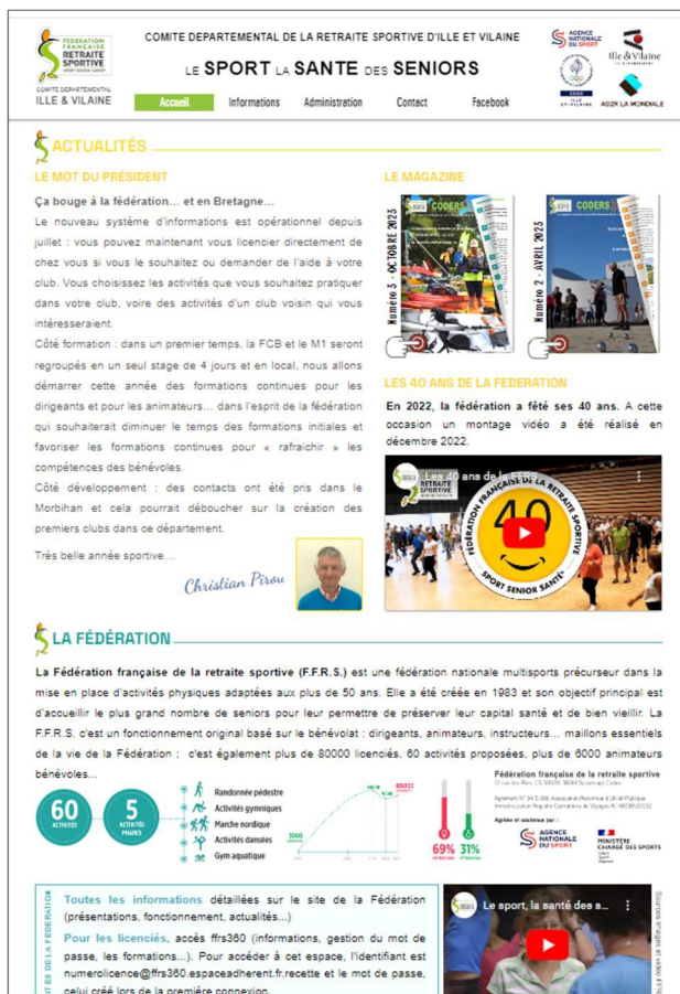
SITE DU CODERS 35