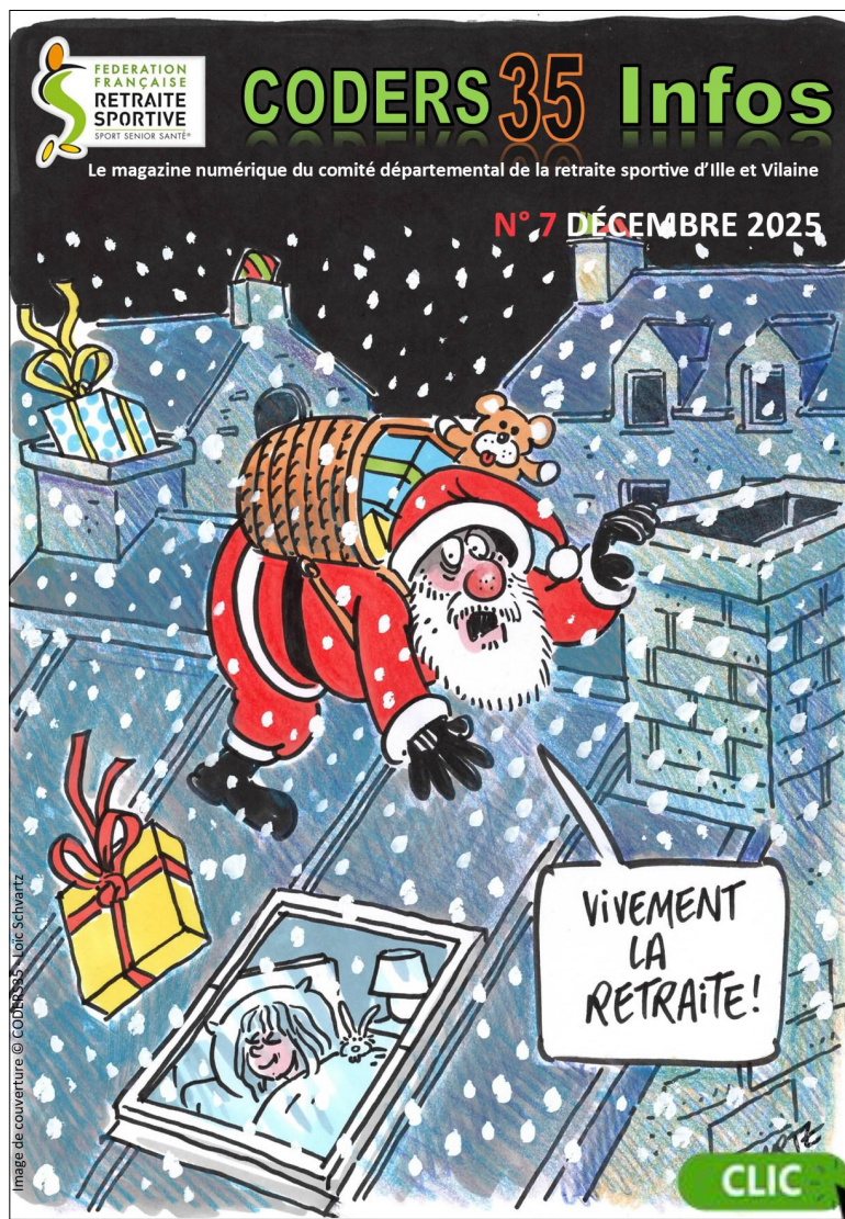
CODERS 35 Infos N°7 - DÉCEMBRE 2025