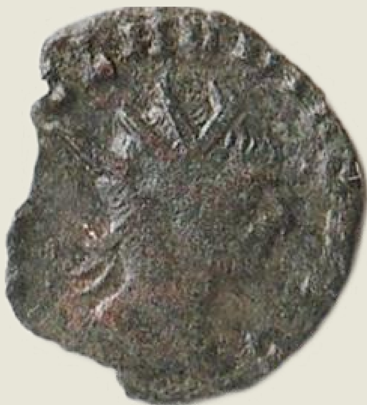
MGO-3288 bakreni novac cara Galijena prednja strana težina = 1,8 g promjer = 14 mm