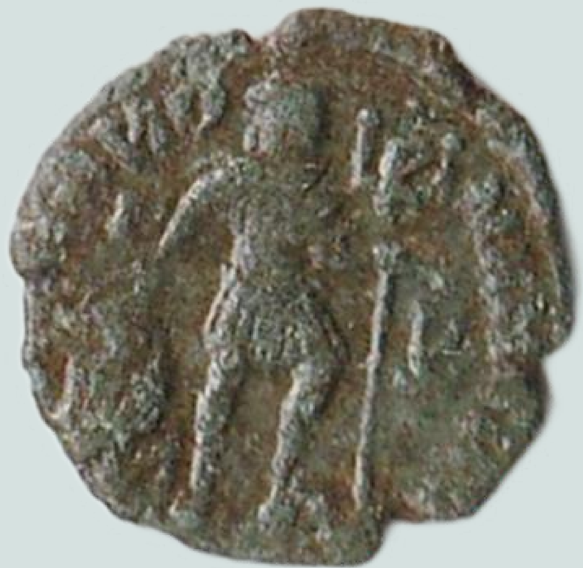
MGO-3236 brončani novac cara Valentinijana I. prednja i stražnja strana težina = 2,5 g promjer = 13 mm