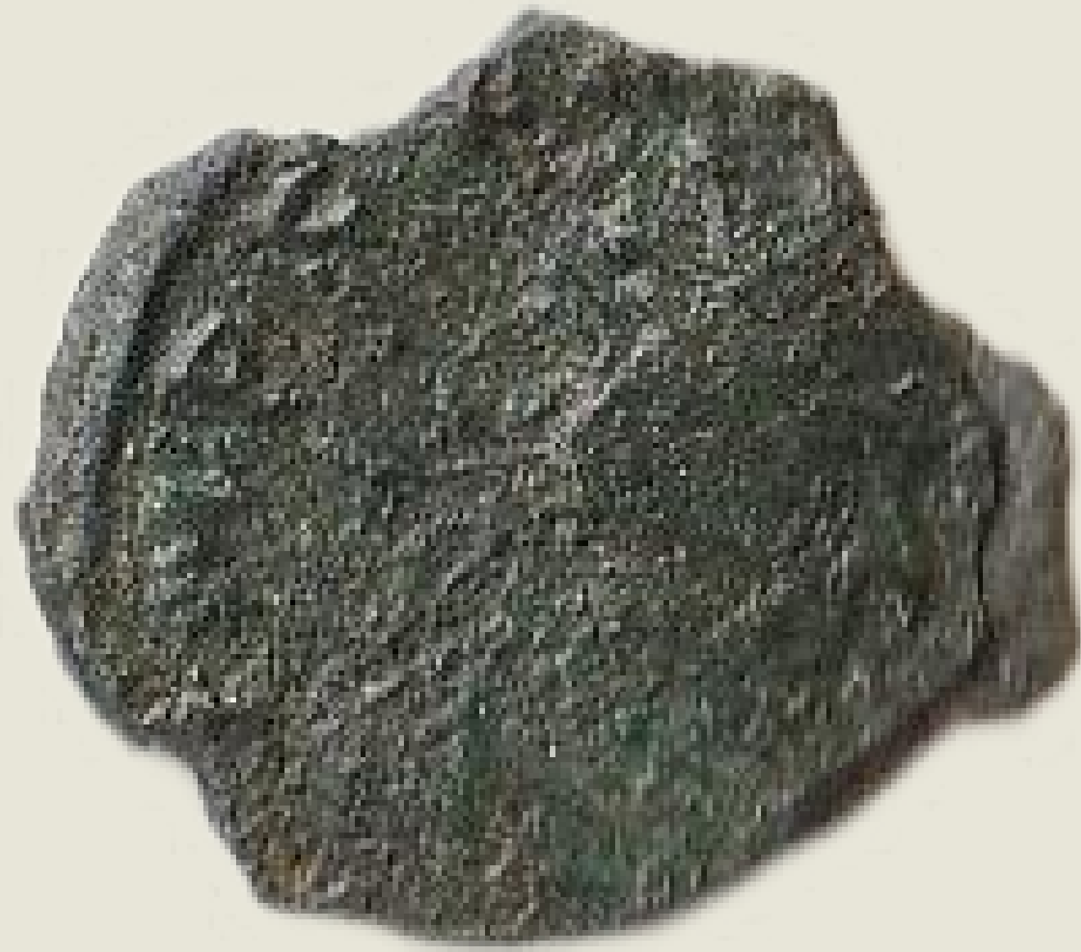
MGO-3208 bakreni novac cara Galijena prednja i stražnja strana težina = 1,1 g promjer = 13 mm