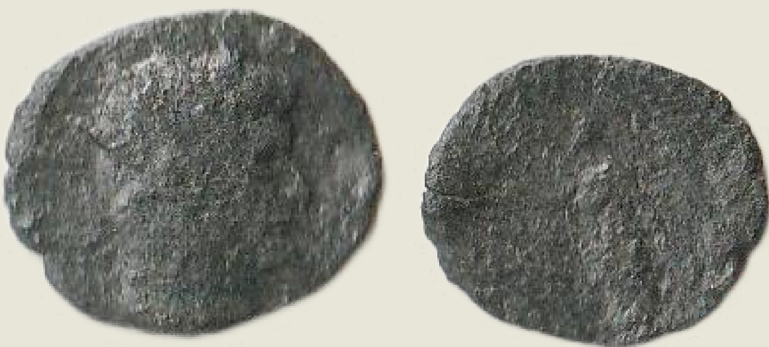
MGO-3125 bakreni novac cara Galijena prednja i stražnja strana težina = 1,3 g promjer = 12 mm