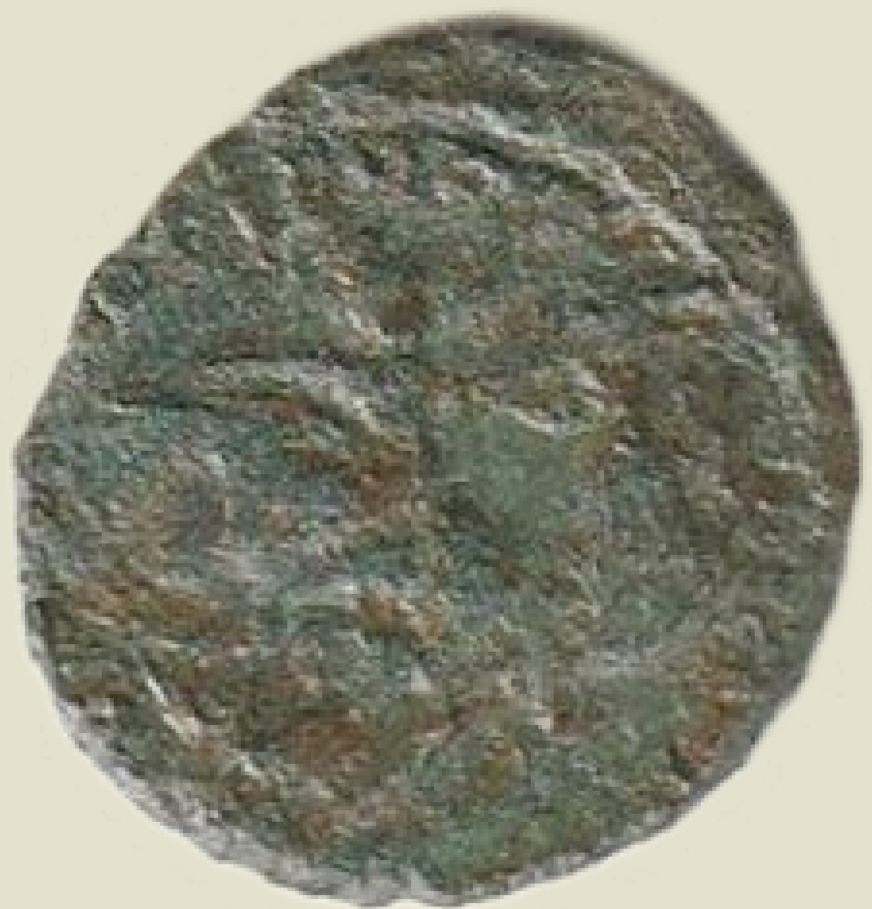
MGO-3206 brončani novac cara Konstancija II. prednja i stražnja strana težina = 1,8 g promjer = 15 mm