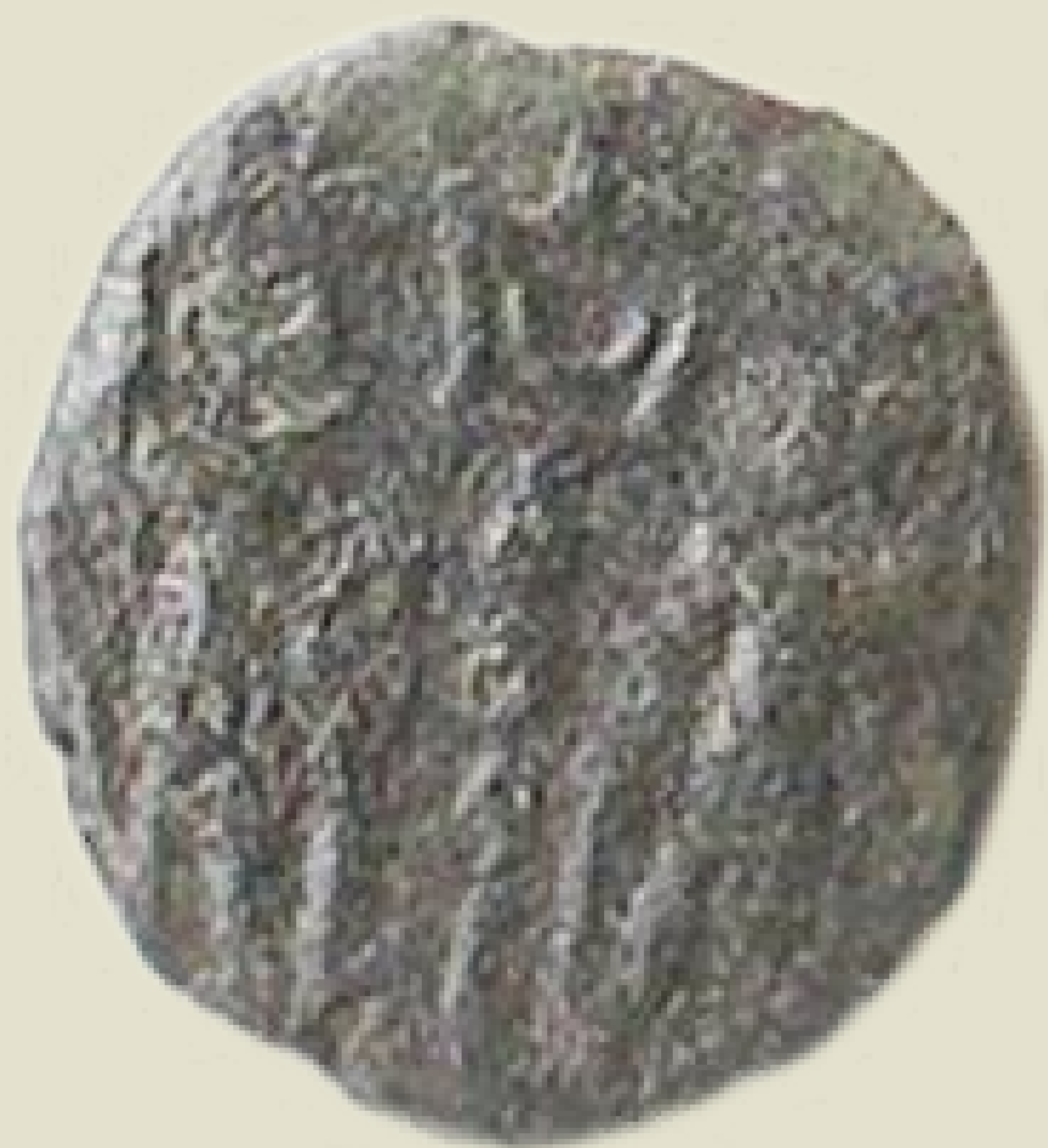
MGO-3253 brončani novac cara Konstancija II. prednja i stražnja strana težina = 2,1 g promjer = 15 mm