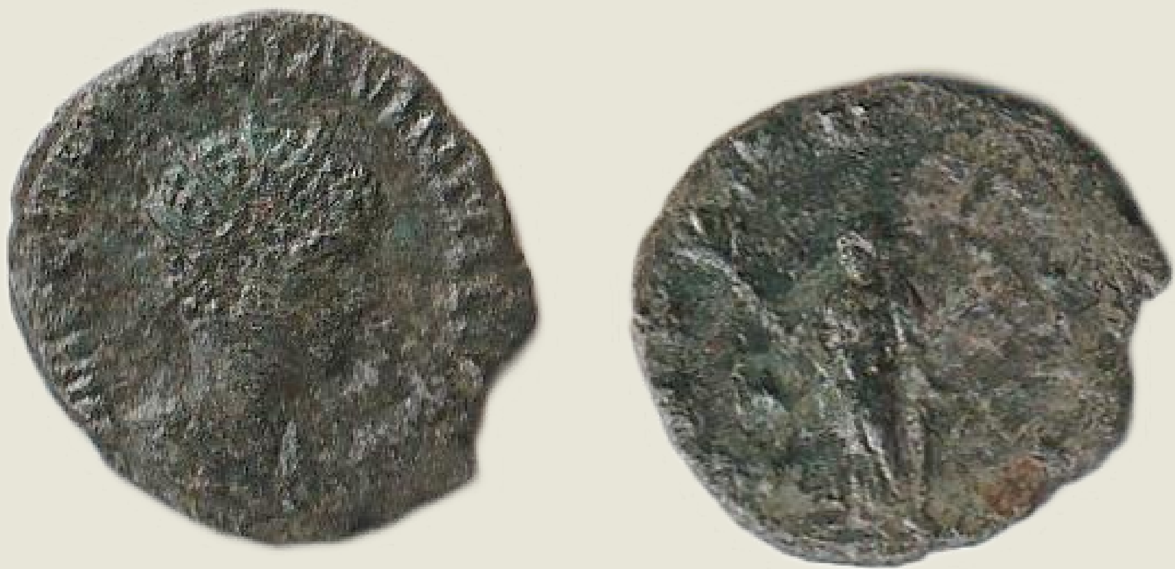
MGO-3119 bakreni novac cara Galijena prednja i stražnja strana težina = 2,1 g promjer = 18 mm

Bakreni novac cara Galijena prema analogijama kovan je u Sisku ( Siscia ) i Rimu ( Roma ). Na prednjoj strani novca vidljivo je poprsje cara sa zrakastom krunom okrenuto u desno. Na stražnjoj strani se pojavljuju rimska božanstva poput božice Paks (božica mira) i Salus (božica zdravlja). Natpisi na novcu su gotovo nesačuvani ali prema analogiji iz Siska i Rima na prednjoj strani novca pojavljuje se natpis GALLIENVS AVG (car Galijen) a na stražnjoj ovisno o božanstvu PAX AVG (mir caru) ili SALVS AVG (zdravlje caru).