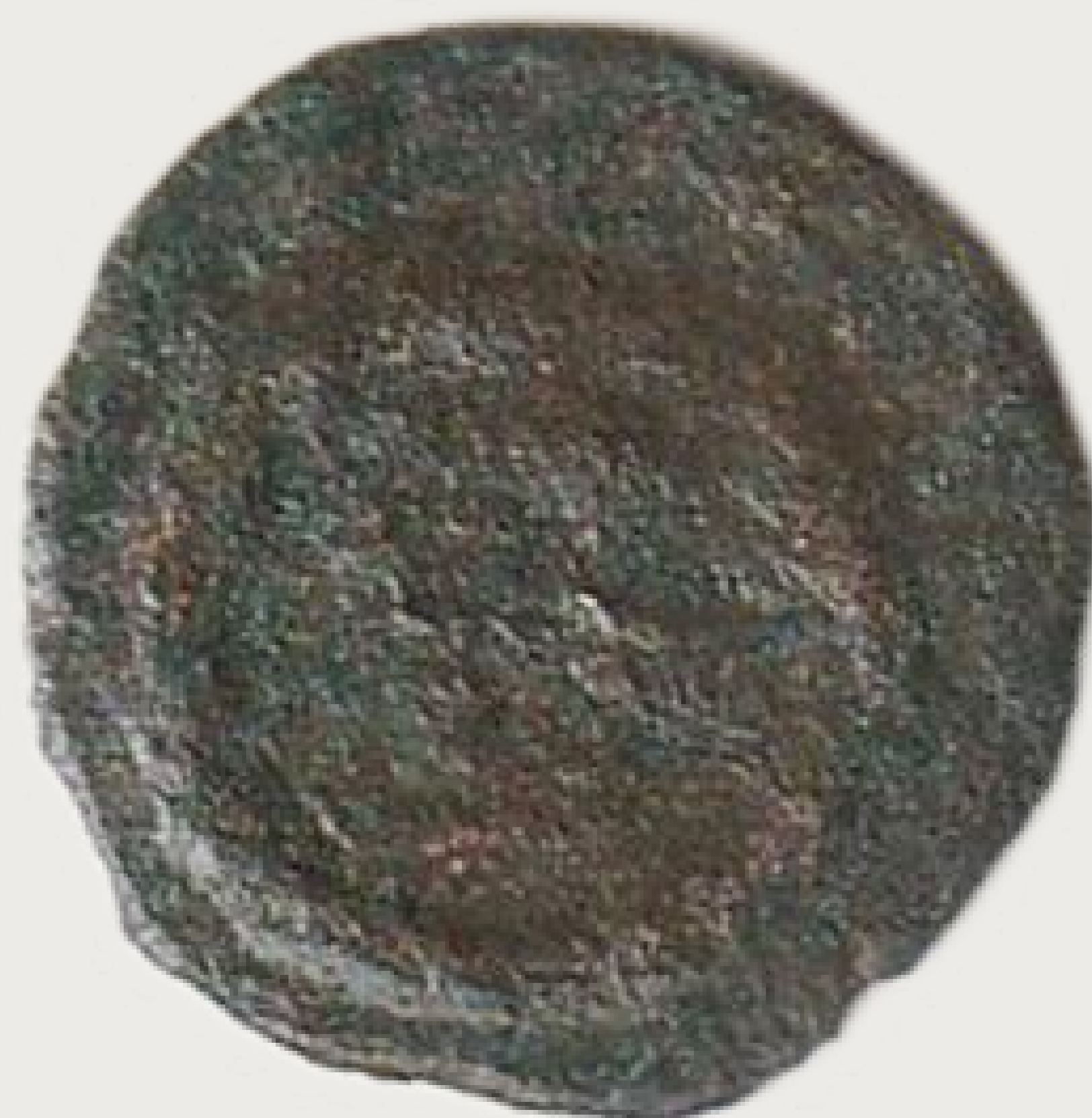
MGO-3193 brončani novac cara Konstantina I. Velikog prednja i stražnja strana težina = 1,3 g promjer = 14 mm