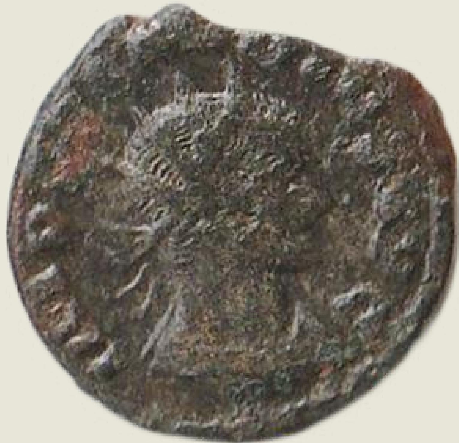
MGO-3261 bakreni novac cara Galijena prednja strana težina = 3,6 g promjer = 20 mm