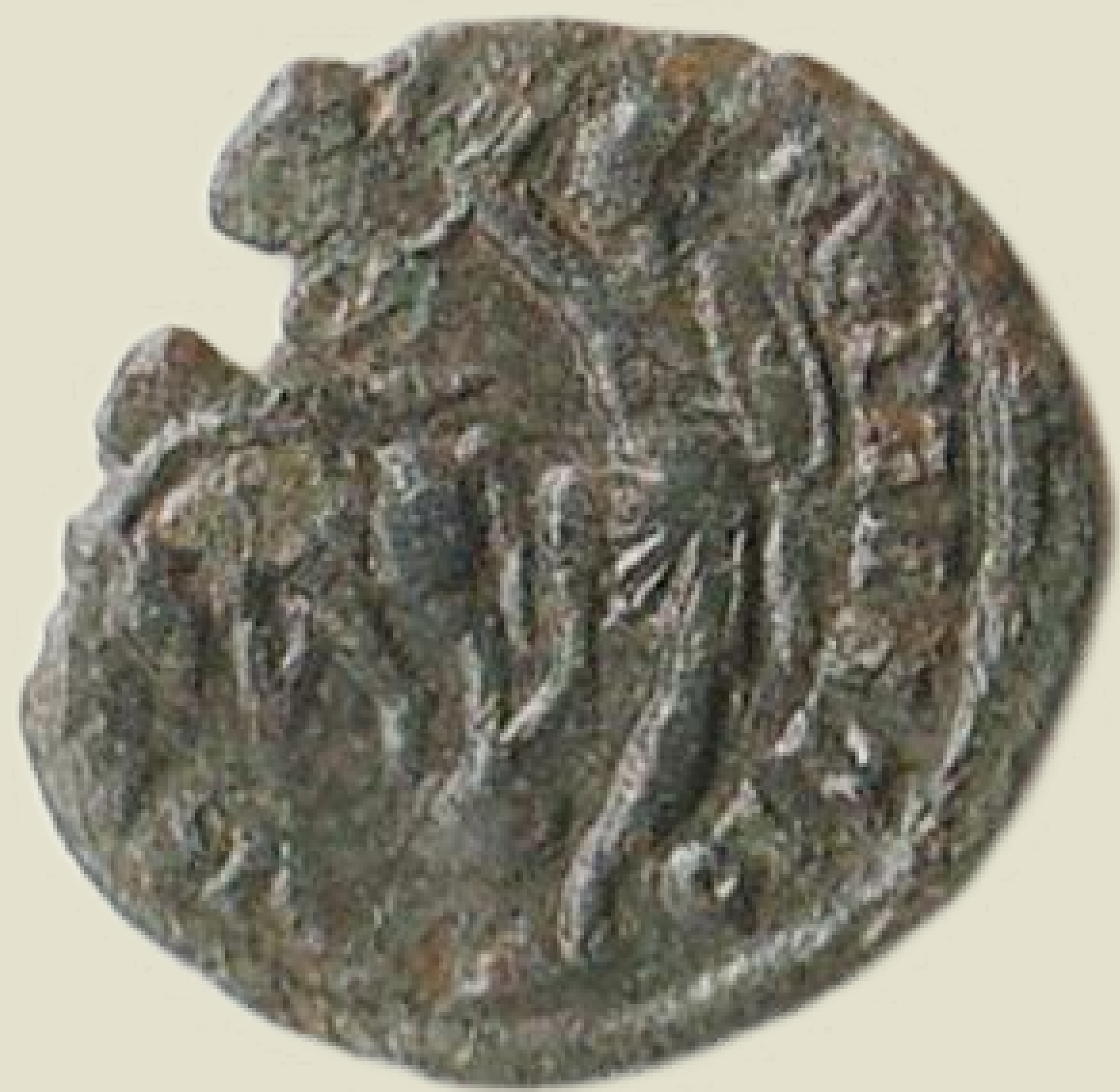
MGO-3202 brončani novac cara Konstancija II. prednja i stražnja strana težina = 1,2 g promjer = 11 mm