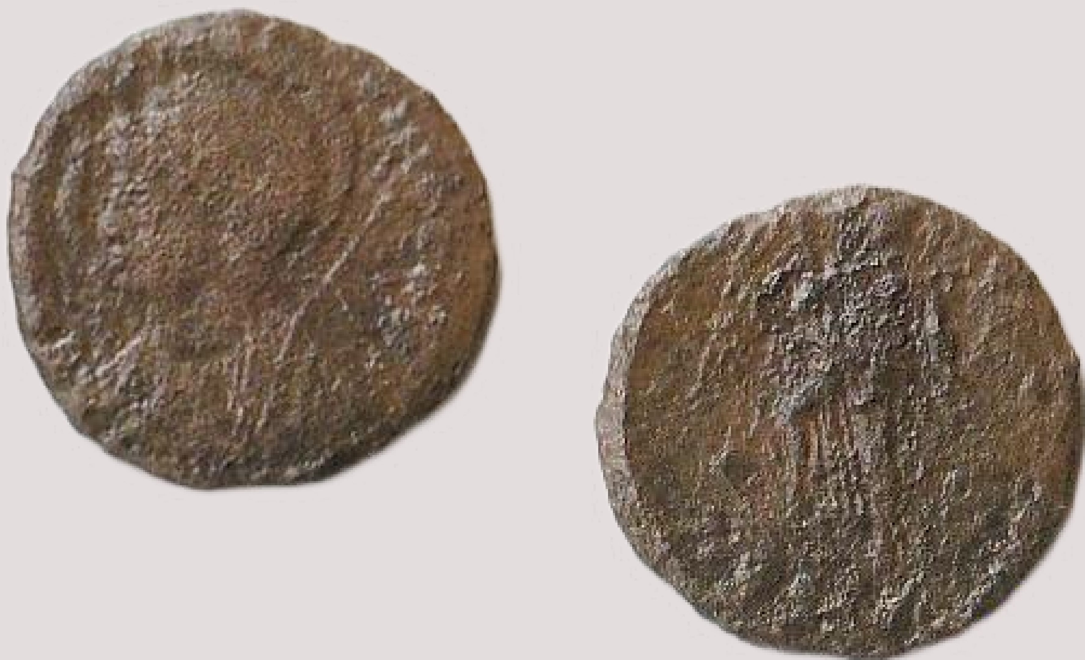
MGO-3254 brončani komemorativni novac Konstantinopol prednja i stražnja strana težina = 1,7 g promjer = 15 mm

Konstantinopol, kovani brončani komemorativni novac, kovan za vrijeme vladavine Konstantina I. Velikog ili njegovih nasljednika. Na prednjoj strani novca prikazano je poprsje personifikacije Konstantinopola okrenuto s kacigom i u oklopu u lijevo. Prema analogiji na prednjoj strani natpis glasi: [CONSTANTI-NOPOLI]. (Konstantinopol). Na stražnjoj strani novca prikazana je božica Viktorija okrenuta u lijevo, desnom nogom stoji na pramcu broda. Na stražnjoj strani novca nema natpisa.