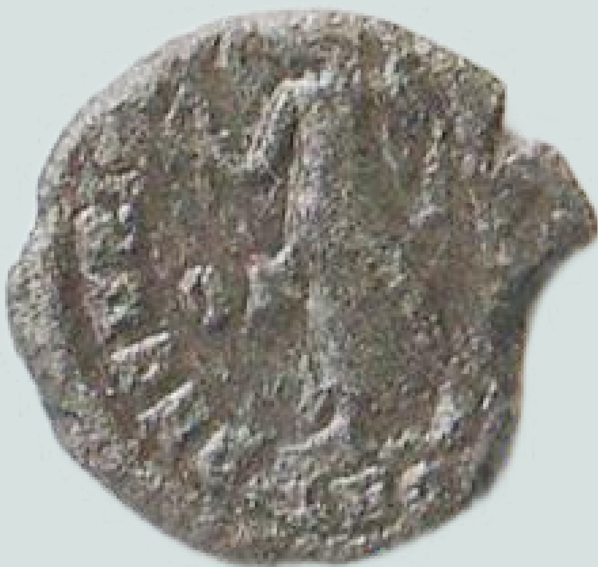
MGO-3268 brončani novac cara Valentinijana I. stražnja strana težina = 2,5 g promjer = 13 mm