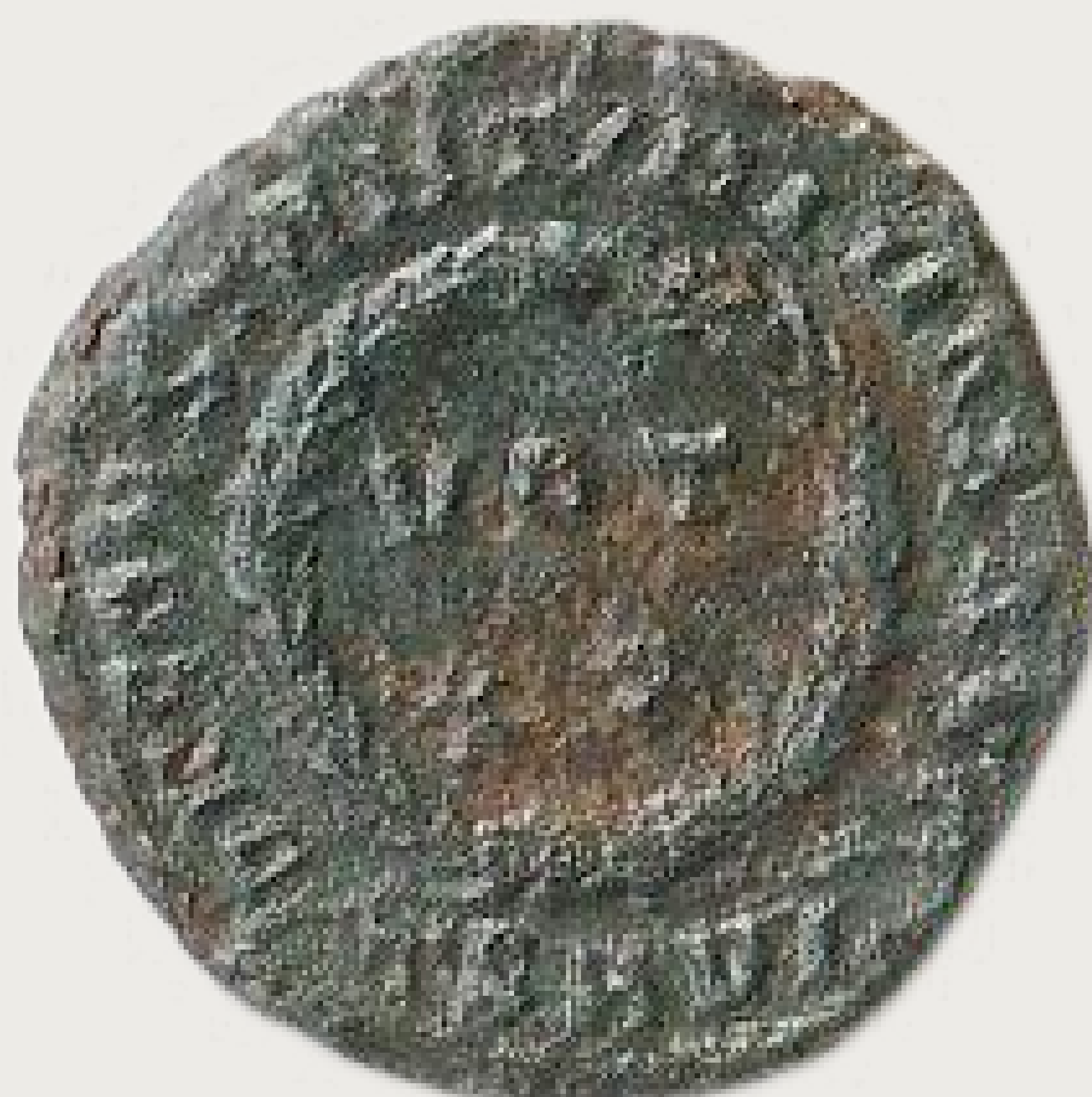
MGO-3240 brončani novac cara Konstantina I. Velikog prednja i stražnja strana težina = 1,8 g promjer = 16 mm