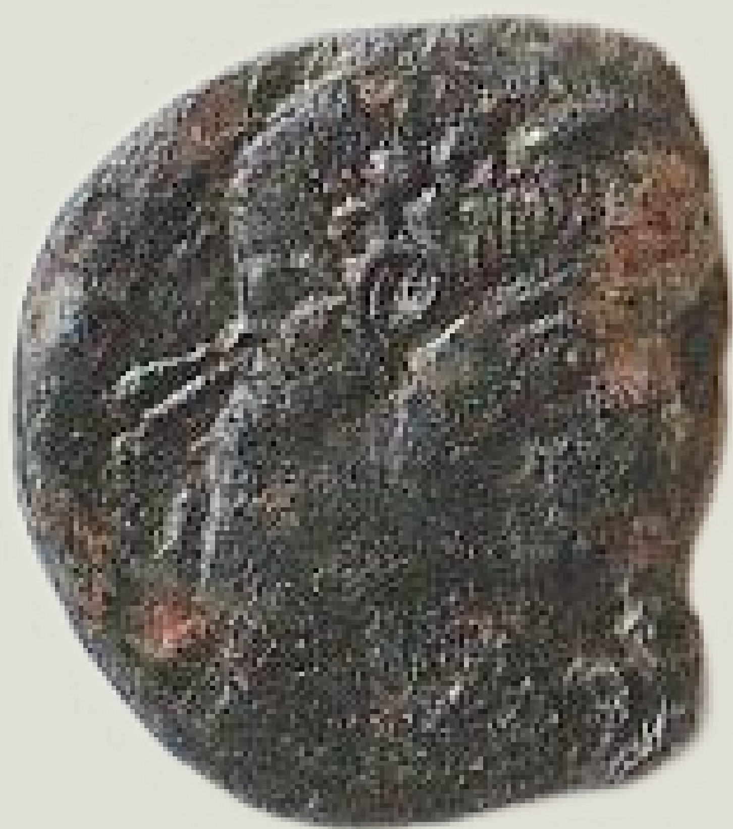
MGO-3167 brončani novac cara Konstansa prednja i stražnja strana težina = 2,8 g promjer = 20 mm