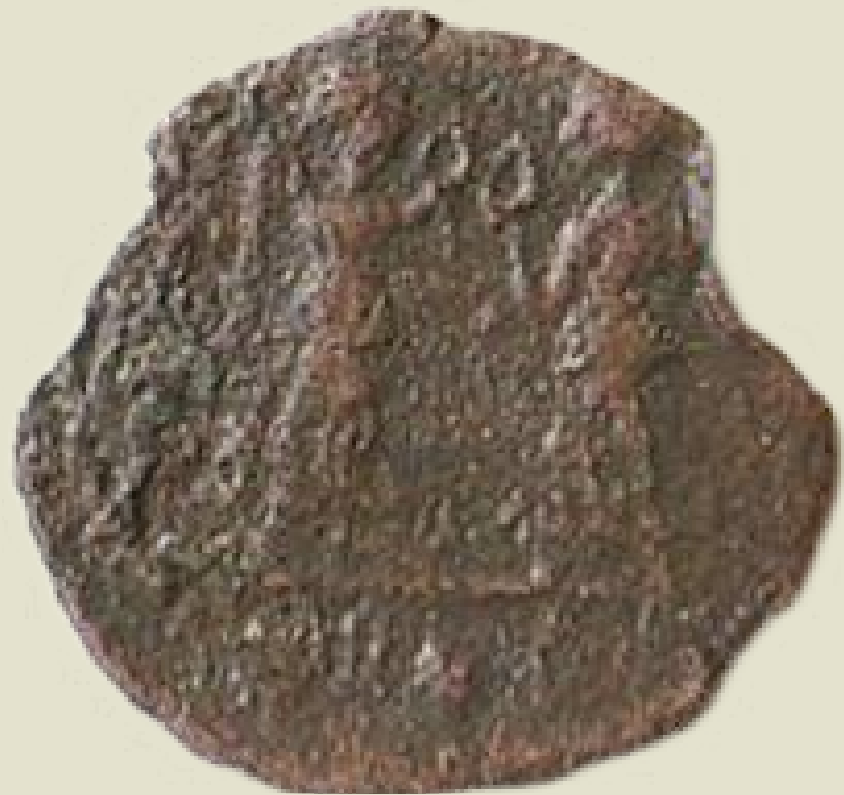
MGO-3156 brončani novac cara Konstancija II. prednja i stražnja strana težina = 1,1 g promjer = 10 mm