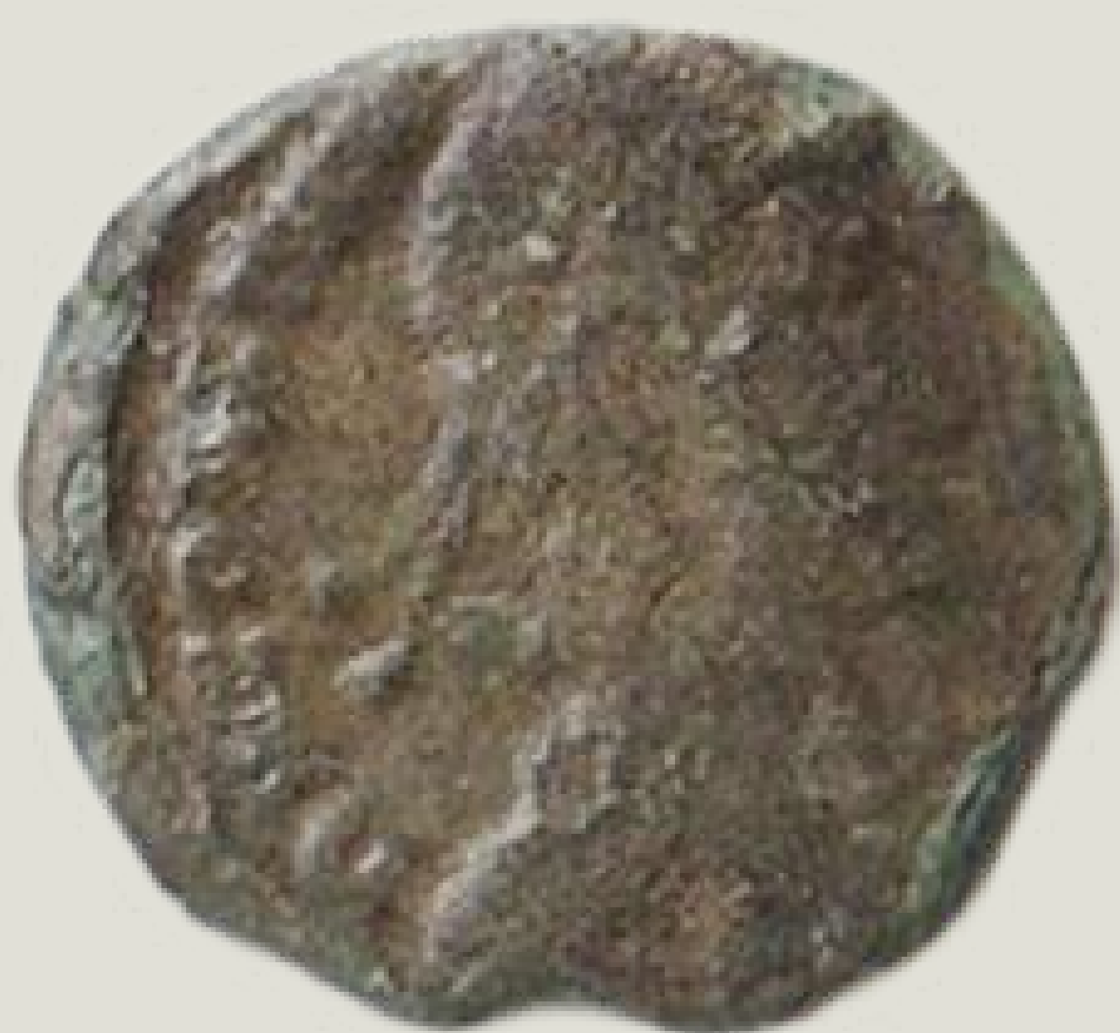
MGO-3173 brončani novac cara Konstansa prednja strana težina = 2 g promjer = 13 mm