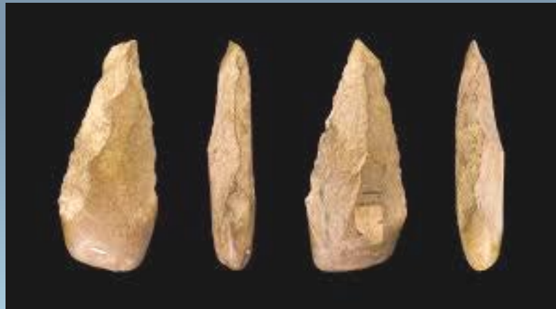
Kapak Genggam Zaman Paleolithikum