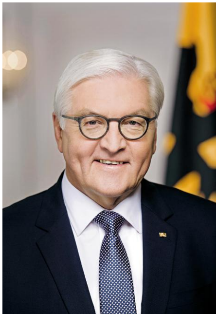
Bundespräsident Frank-Walter Steinmeier