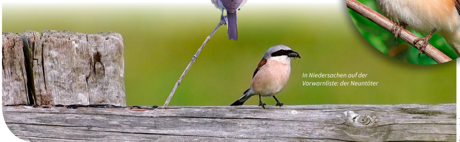
In Niedersachsen auf der Vorwarnliste: der Neuntöter

men erhalten haben. Um ausreichend Nahrung zu finden, brauchen Neuntöter größere kurzrasige Flächen mit vielen Kräutern und Gebüsche als Brutplatz und Ansitzwarte.