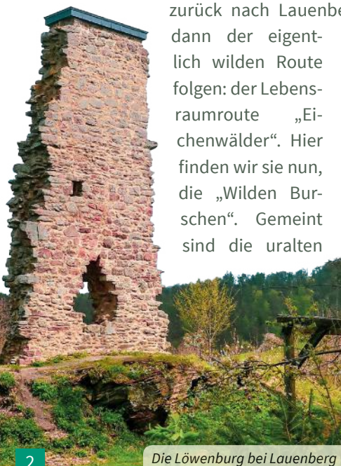
Die Löwenburg bei Lauenberg