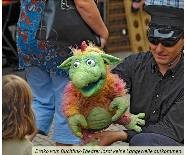
Drako vom Buchfink-Theater lässt keine Langeweile aufkommen

In dem malerischen Innenhof informieren wir und unsere Kooperationspartner über Themen rund um den Natur- und Umweltschutz. Natürlich sollen Sie an dem Tag nicht hungrig oder durstig bleiben!