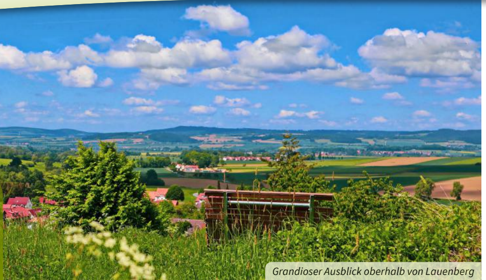
Grandioser Ausblick oberhalb von Lauenberg