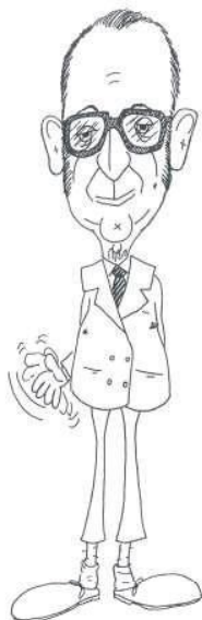
Caricatura publicada en la revista Vida Rover , 1981, cuando se desempeñaba como Comisionado nacional de Adiestramiento.