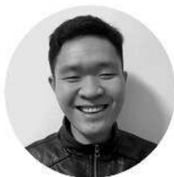
Wang Yangming TEACHER