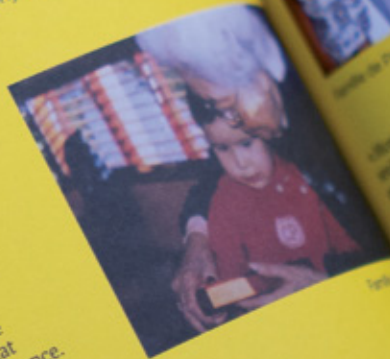
Enfants de Paris

« Le vietnam a été colonisé par la France, mais même les anciennes générations parlent français. Les nouvelles générations après l'indépendance se sont réappropriées le vietnamien. Cependant, même si la langue vietnamienne, il y a encore des enfants qui parlent français. »