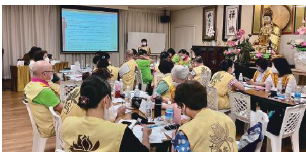
▲東京督導委員會7月28日於東京佛光山寺觀音殿舉行「星雲大師全集研讀會」，由監寺妙崇法師為主講人，將三十餘位會員分為四組，閱讀《迷悟之間》中的「處理問題」一文，學員們展開組內討論，並派出代表發表。