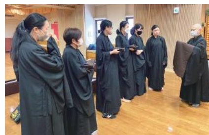
▲新宿分會7月17日假東京佛光山寺如來殿舉行「學佛行儀」課程，恭請如恭法師教授，會員及會友18人參加。內容有四大威儀、佛教用語、持經問訊、持經拜佛、上香、海青／縵衣之穿法、過堂吃飯等。