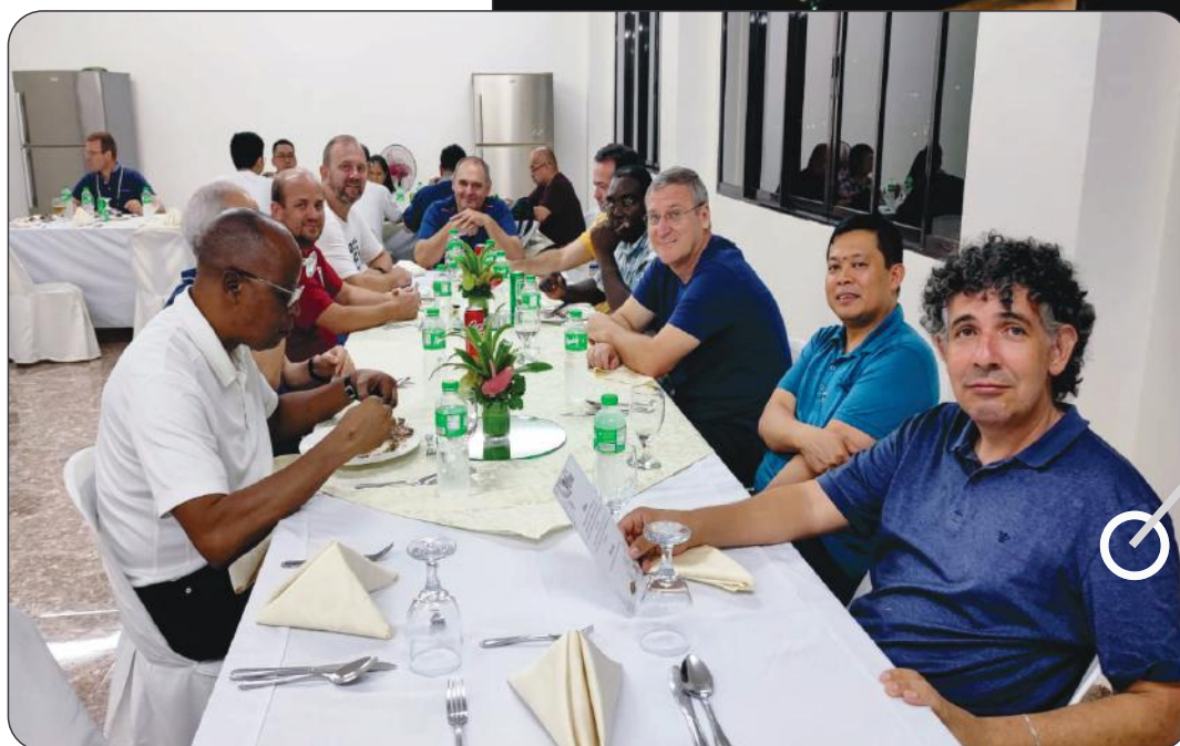
Refeições e encontros com benfeitores locais