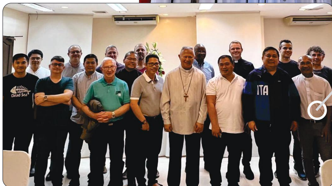
Encontro com o Arcebispo de Cebu