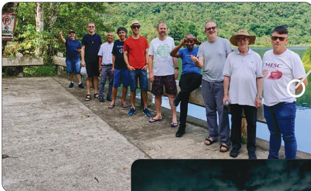
Visita à Comunidade do Noviciado - Merida