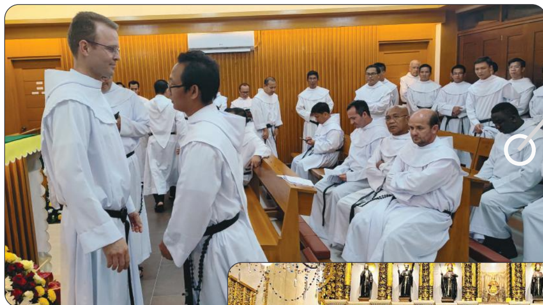
Saudação ao novo Prior geral