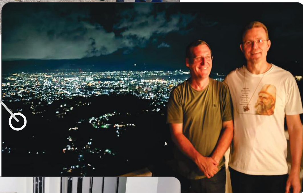
Conhecendo um pouco de Cebu City