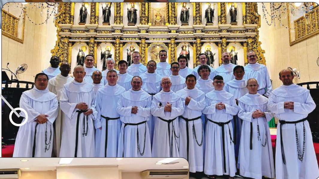
Missa na Basílica do Santo Niño