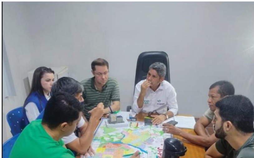
As modificações no sistema viário da avenida Maringá foram apresentadas à diretoria da Autarquia Municipal de Trânsito

(Da Redação) Com base em critérios técnicos e levantamento de campo para ampliar a segurança viária, o Departamento Estadual de Trânsito (Detran) elaborou Estudo Técnico de Engenharia de Tráfego (ETET) para melhorar a mobilidade urbana, em Ji-Paraná, que subsidiará o planejamento viário do município em 2026.