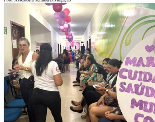
Os atendimentos são de testes rápidos para Hepatites, sífilis e HIV, consultas

O mês é de conscientização e combate ao Câncer do colo de útero. A unidade realizará exames e testes rápidos para hepatites, sífilis e HIV, consultas gi-