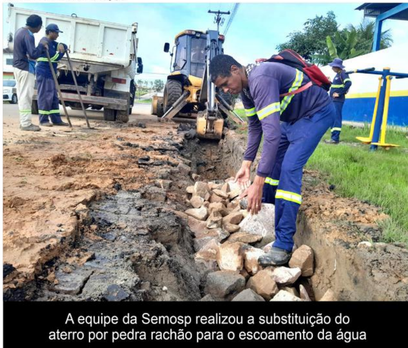
A equipe da Semosp realizou a substituição do aterro por pedra rachão para o escoamento da água

das águas pluviais e reduzir os transtornos causados durante o período de chuva.