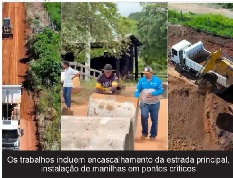
Os trabalhos incluem encascalhamento da estrada principal, instalação de manilhas em pontos críticos

Os trabalhos incluem encascalhamento da estrada principal, instalação de manilhas em pontos críticos e abertura de carregadores para facilitar o acesso às propriedades rurais. A ação beneficia agricultores da região, com a melhoria das condições de tráfego para o escoamento da produção agrícola e para garantir mais