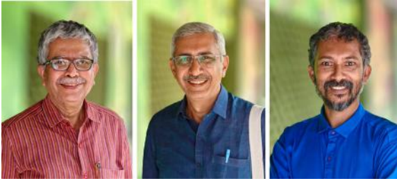
പ്രസിഡന്റ് ജനറൽ സെക്രട്ടറി ട്രഷറർ

ക്കുള്ള ഭാവിപ്രവർത്തന പരിപാടികൾ ചർച്ചചെയ്ത്, പ്രവർത്തന കലണ്ടർ തയ്യാറാക്കി റിപ്പോർട്ടുകൾ സമർപ്പിച്ചു.