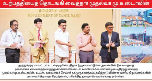
உற்பத்தியைத் தொடங்கி வைத்தார் முதல்வர் மு.க.ஸ்டாலின்

சென்னை, மார்ச் 13: துடிக்குடி மாவட்டம் உடன்குடியில் ரூ.13,077 கோடியில் அமைக்கப்பட்டுள்ள புதிய அனல் மின் நிலையத்தின் உற்பத்தியை முதல்வர் மு.க.ஸ்டாலின் வெளிச்சிழிப்பு செய்து கொண்டுவந்தார். சென்னை தலைமைச் செயலகத்தில் காசியாசி முன்றலில் நடைபெறும் இடம். இடம் 660 ஏக்கர். உற்பத்தித் திறன் 660 மெகாவாட். தலைமைத் துறைமுகம் மூலம் இயங்கும். உற்பத்தியில் மின் உற்பத்தித் திறன் அதிகரிக்கும் தொட்டி நடவடிக்கையை அந்த மேற்கொண்டு வருகிறது. அந்த தொட்டியின் உட்கட்டிடம் ரூ.13,077 கோடியில் கட்டப்படும். இடம் 660 ஏக்கர்.