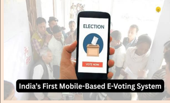
India's First Mobile-Based E-Voting System