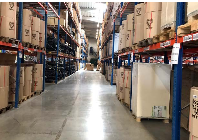
Magazyny Geis dla WTB Europe