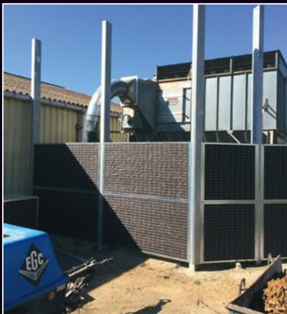
Mur anti-bruits Mont Valérien.