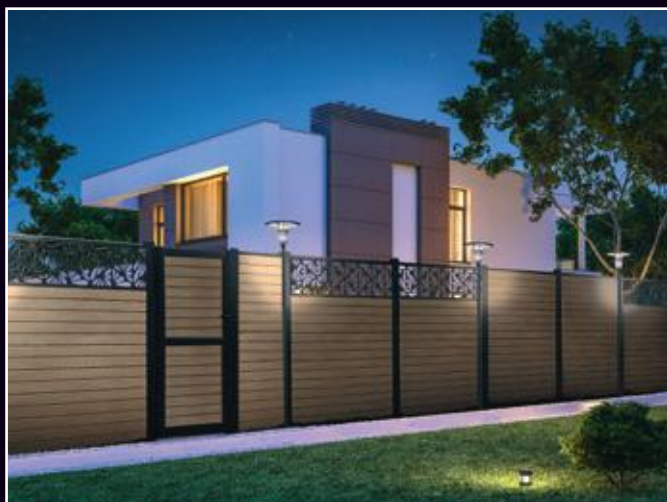
D'une conception moderne et respectueuse de l'environnement ces clôtures composites disposent d'une très large gamme de choix