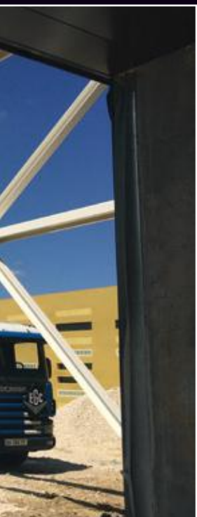
Portail entrée du parc de Saint- Thibault des Vignes