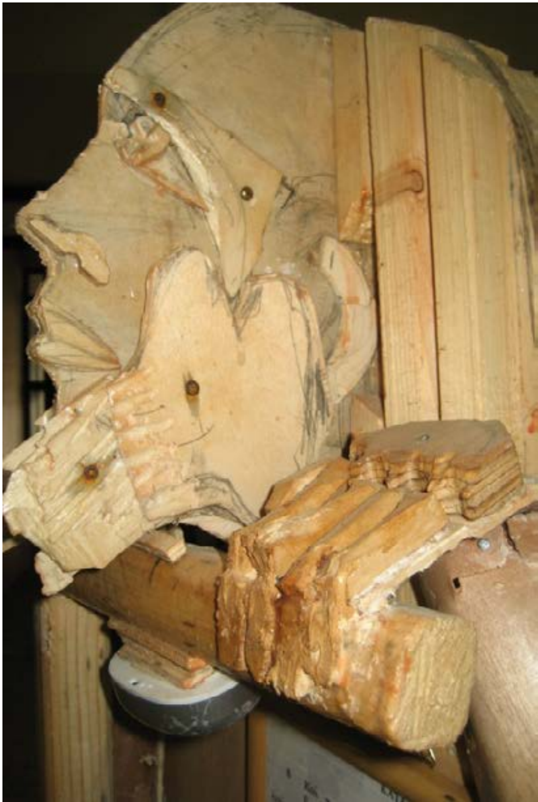
"I buoni pastori, 2009 per la Mostra Sfida educativa", Carlo Vignale