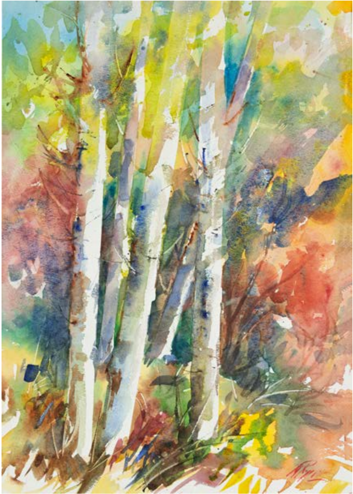
"Betulle" , acquarello su tela, 50x35, Mirella Raggi