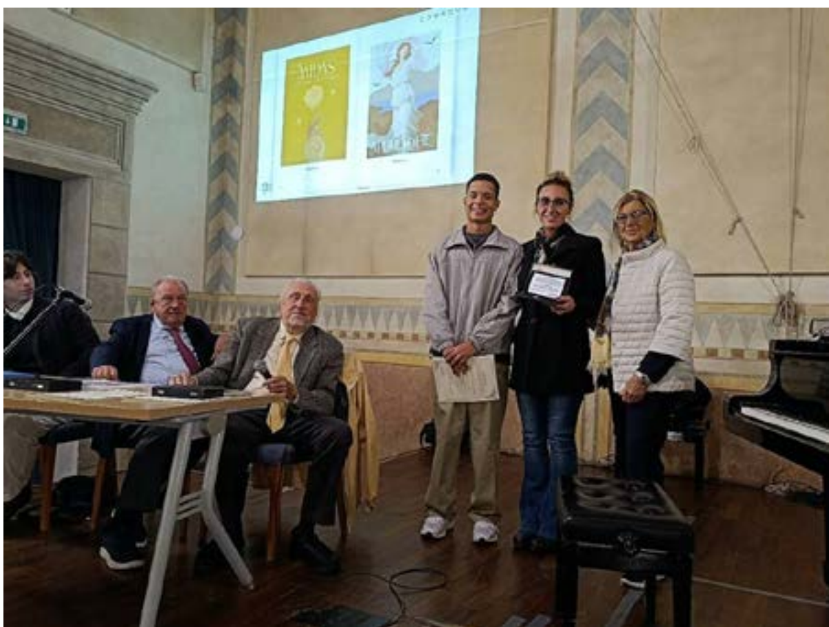
Premio conferito alla classe VB del Liceo Artistico Cardarelli