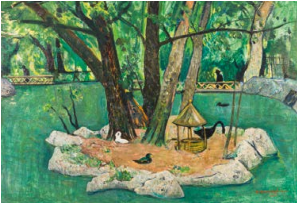
"L'isolotto delle anitre" , 1975, olio su tavola, Cesare Breveglieri