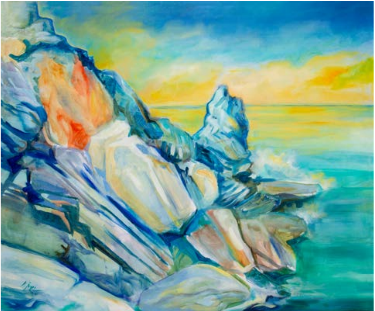
"Scogliera a Portovenere" , olio su tela, 100x120, Mirella Raggi