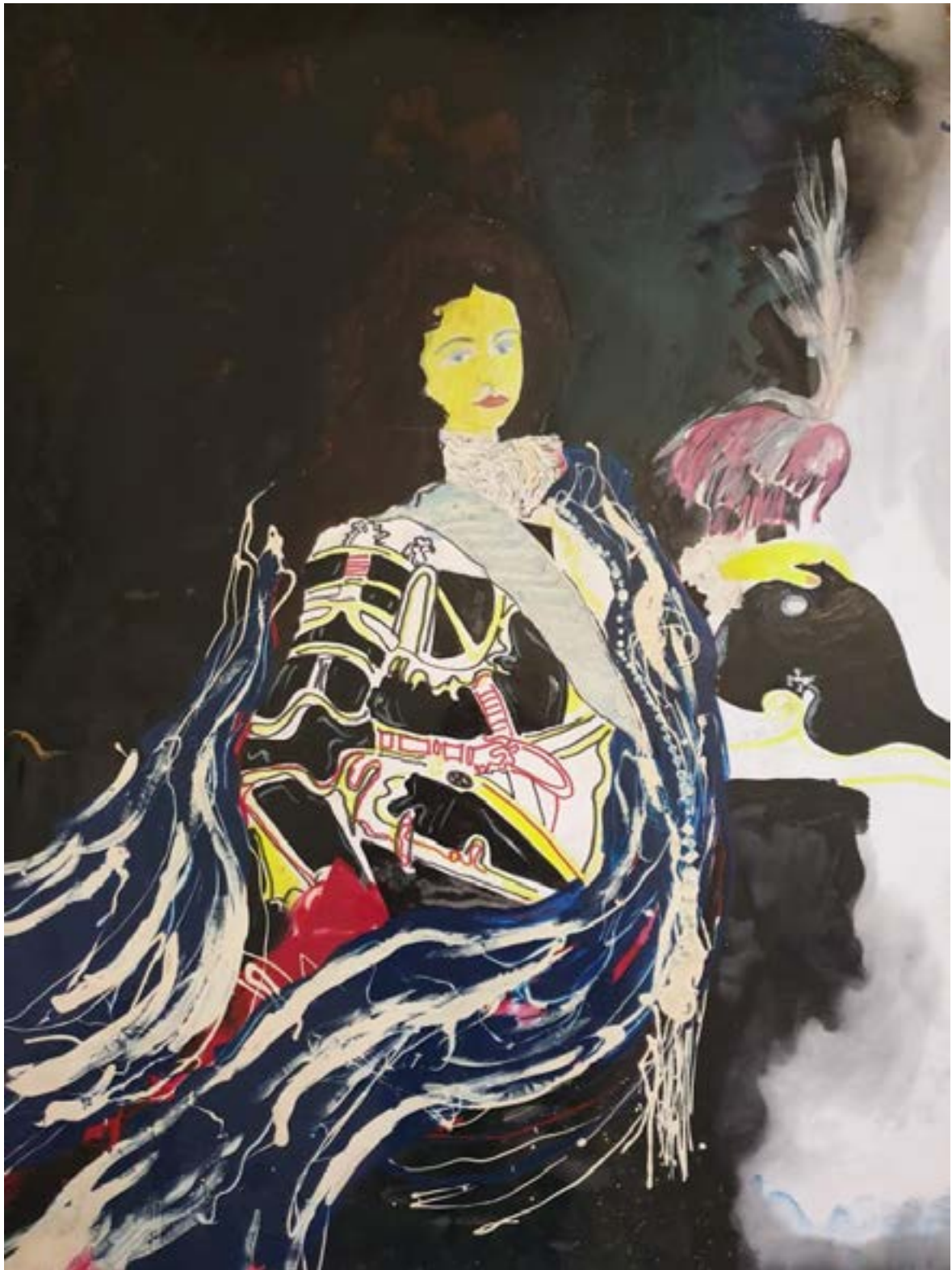
"Ritratto di Cosimo Sutti" , opera di Nicola Sutti