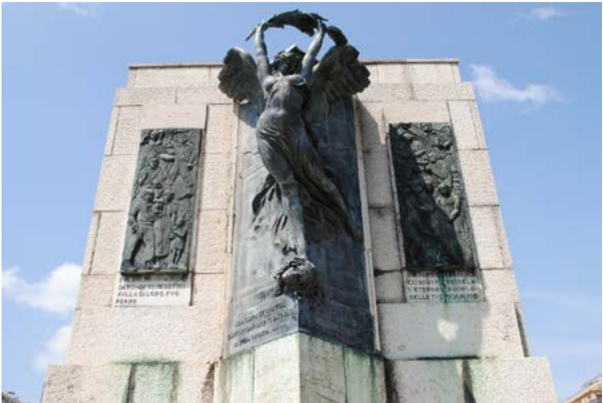
"Allegoria della Vittoria come donna vestita all'antica", Angiolo Del Santo