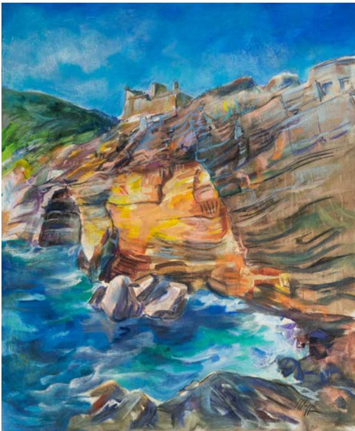
"Grotta Byron" , acrilico su tela, 120x100, Mirella Raggi