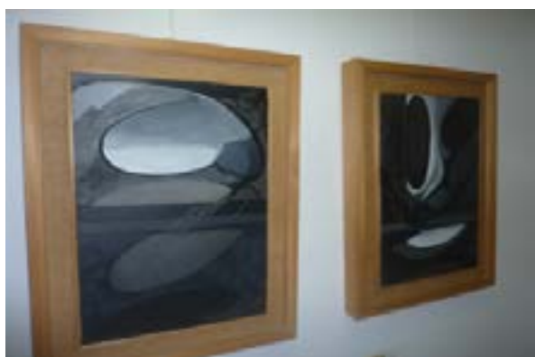
Opere di Matilde Parodi