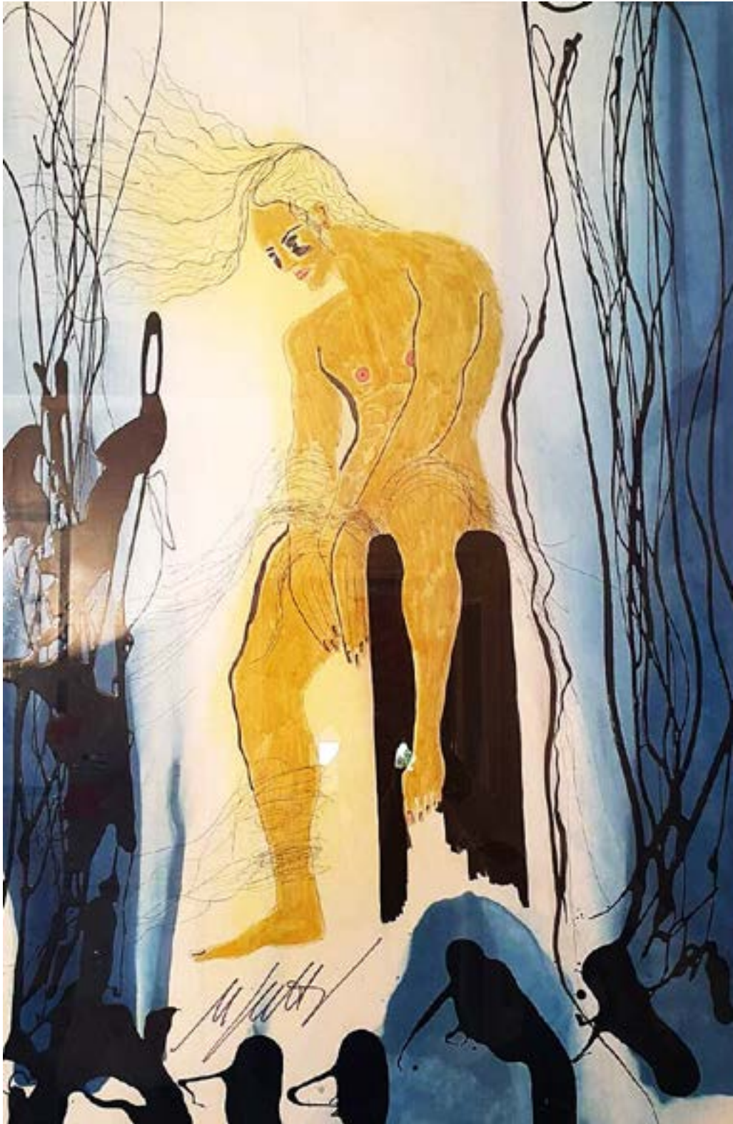
Opera di Nicola Sutti