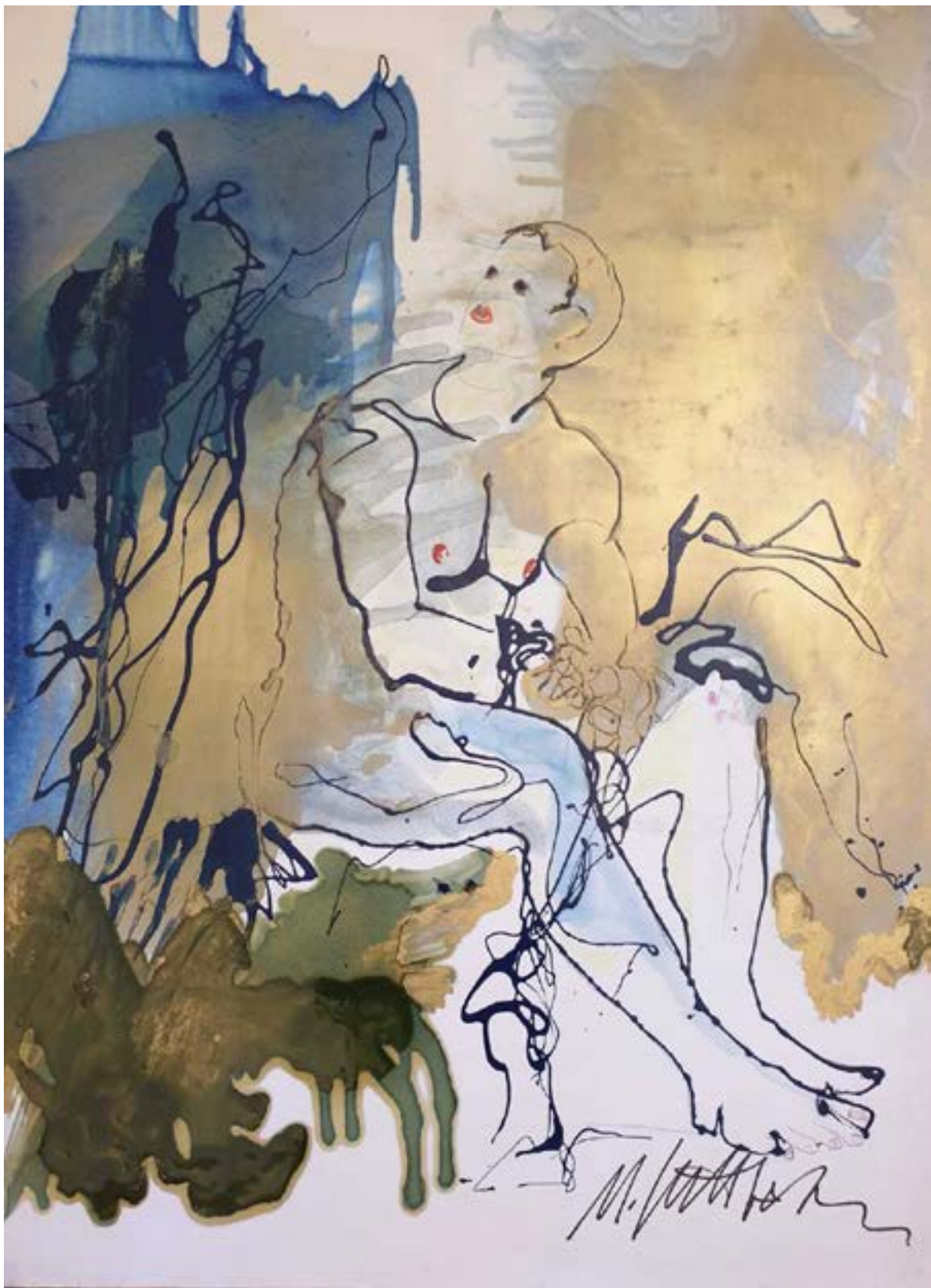
Opera di Nicola Sutti