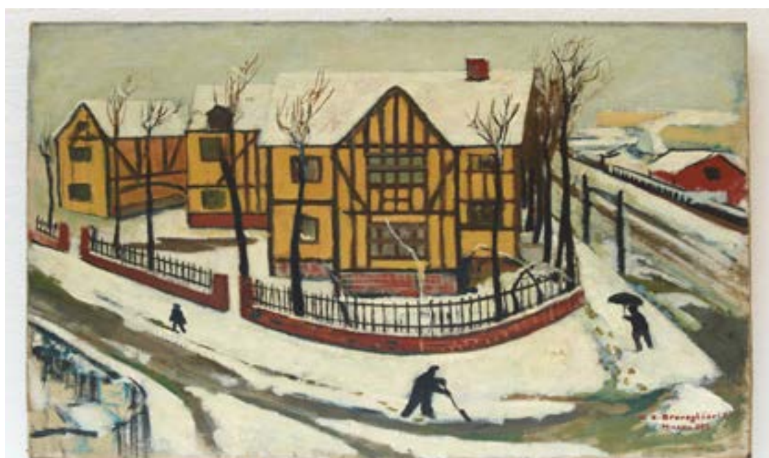
"Nevicata in Via Gianbologna" , 1933, olio su tela, Cesare Breveglieri "I giardini pubblici" , 1936, Cesare Breveglieri (pagina a fianco)