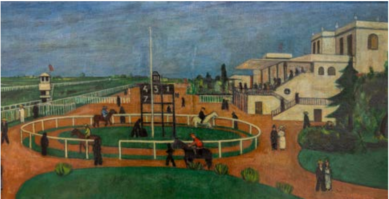
"San Siro" , 1940, Cesare Breviglieri

o mesi, il momento giusto per finirlo. Spesso copriva l'abbozzo con un foglio di carta su cui ritagliava una finestrella che allargava mano a mano che procedeva nel lavoro perché ogni parte del quadro doveva essere portata a fondo e in questo tormentoso procedere creativo era colto da un senso di angoscia". Con questo procedimento tutt'altro che semplice, dunque, Breviglieri dipinge la sua città. In una stagione intensissima, compresa fra il 1932 e il 1936 dà vita a una Milano stupefatta, insieme dimessa e incantata: una città non a misura d'uomo ma di bambino, raccolta attorno al regno leggendario dei Giardini Pubblici che ha la sua capitale nello zoo.