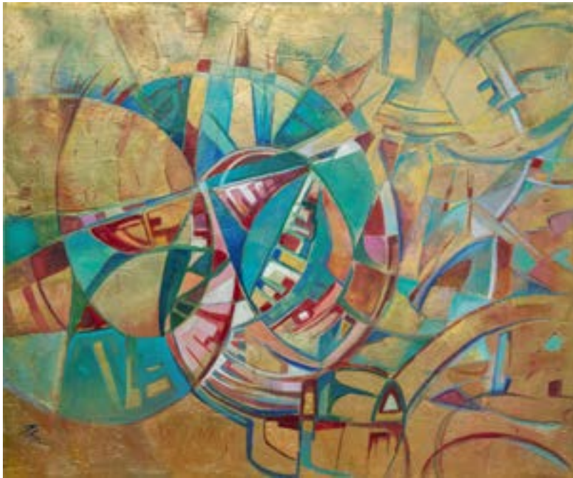
"Compenetrazioni" , acrilico su tela, 100x120, Mirella Raggi