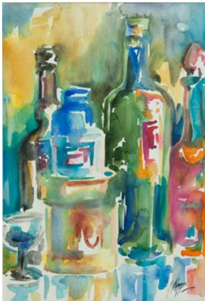
"Le Bottiglie" , acquarello su tela, 50x35, Mirella Raggi