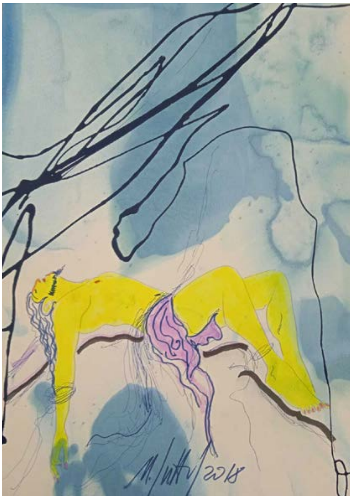
Opera di Nicola Sutti