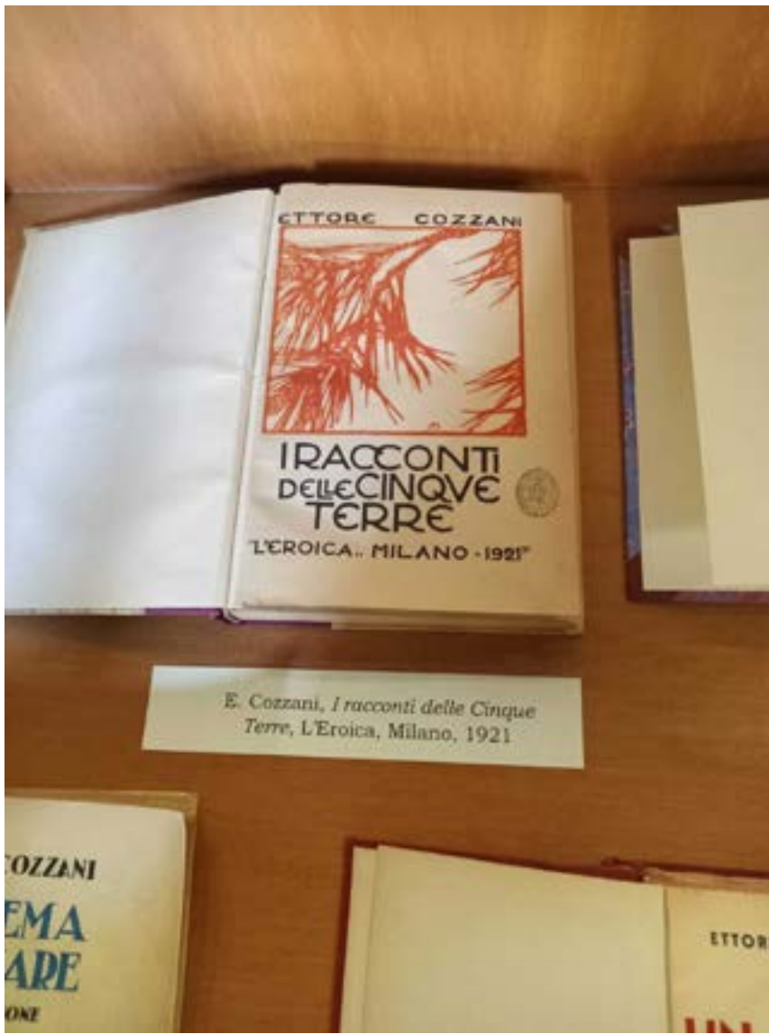
E. Cozzani, I racconti delle Cinque Terre , L'Eroica, Milano, 1921