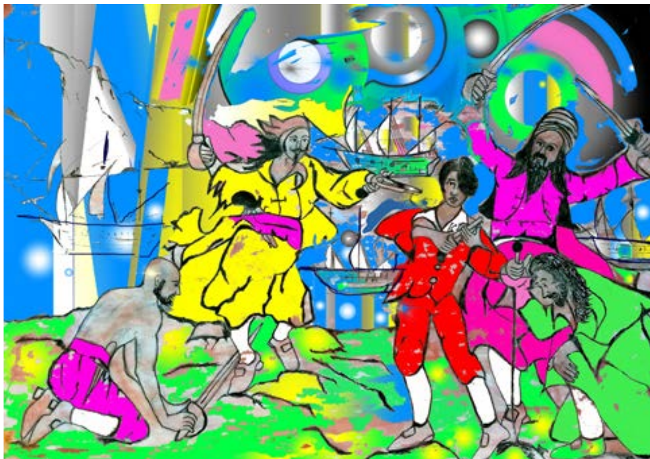
Opera di Andrea Ciardi