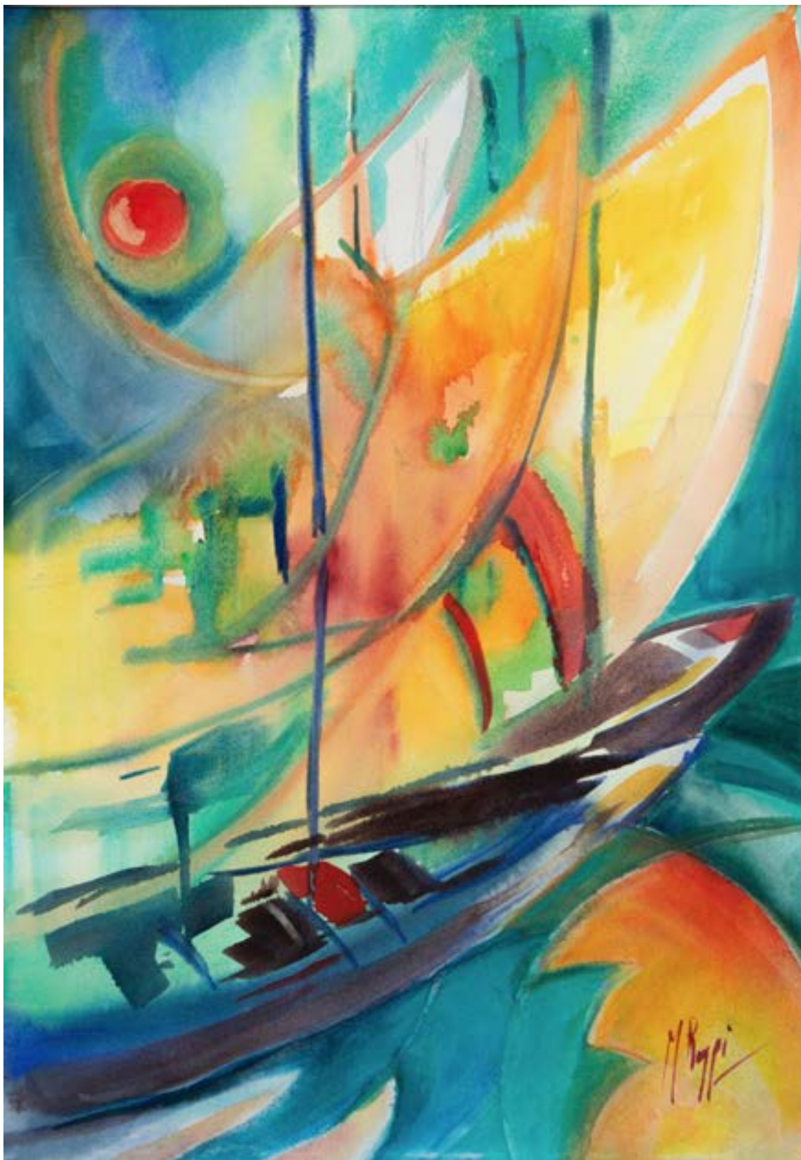
"Vele al vento" , acquarello su tela, 50x35, Mirella Raggi