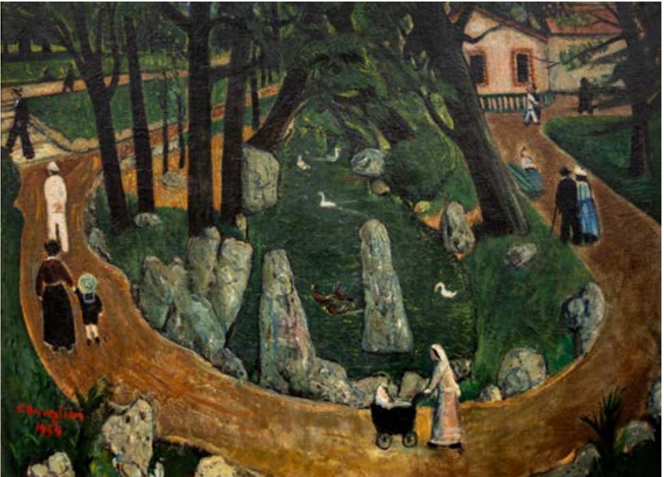
"La passeggiata domenicale" , 1934, Cesare Breveglieri