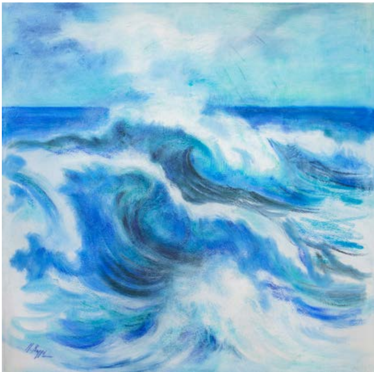
"Mareggiata" , pastello su tela, 100x100, Mirella Raggi