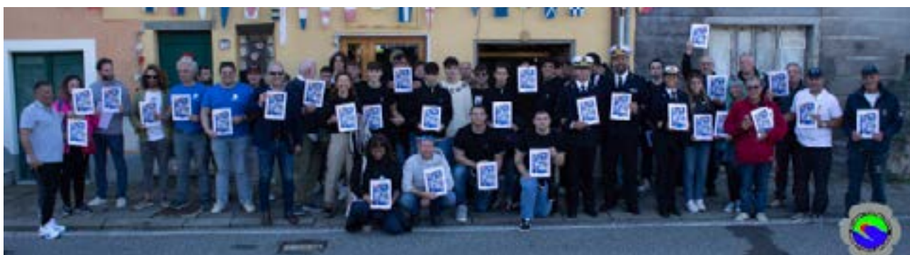
Sopra e sotto, il Palinuro nella crescita professionale di giovani allievi.

Militare; lì a prendere dimestichezza col mare sono gli studenti della Scuola Navale Militare Morosini di Venezia e gli allievi sottufficiali della Scuola Sottufficiali della Marina Militare di Taranto della categoria nocchieri. Il suo armamento a nave goletta evoca il fascino dell'antica mariniera, perpetuando l'arte che ne è alla base. Tre alberi il bompresso costituiscono i pinnacoli della cattedrale del mare che spiega al vento un mix imponente di vele: quadre (sull'albero di trinchetto) e auriche (sugli alberi di maestra e mezzana), vele di strallo e fiocchi per un totale di 1000 metri quadrati circa di tela, manovrati attraverso 17 chilometri di cordami, tra cavi e cime.