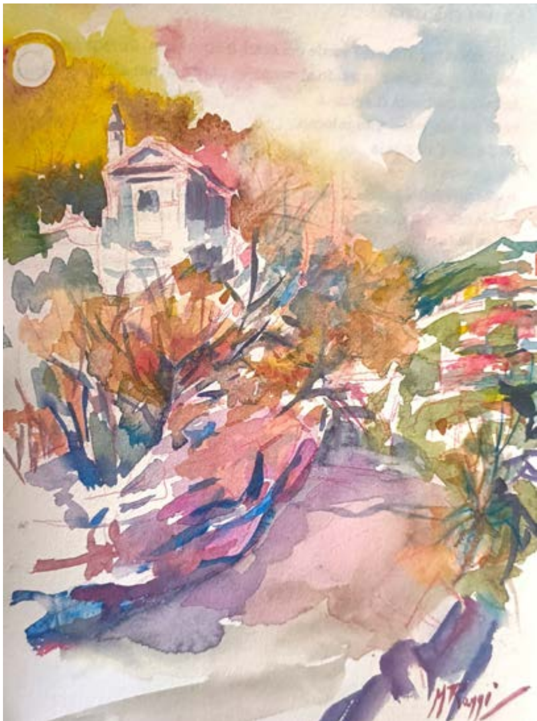
"Chiesetta" , opera di Mirella Raggi