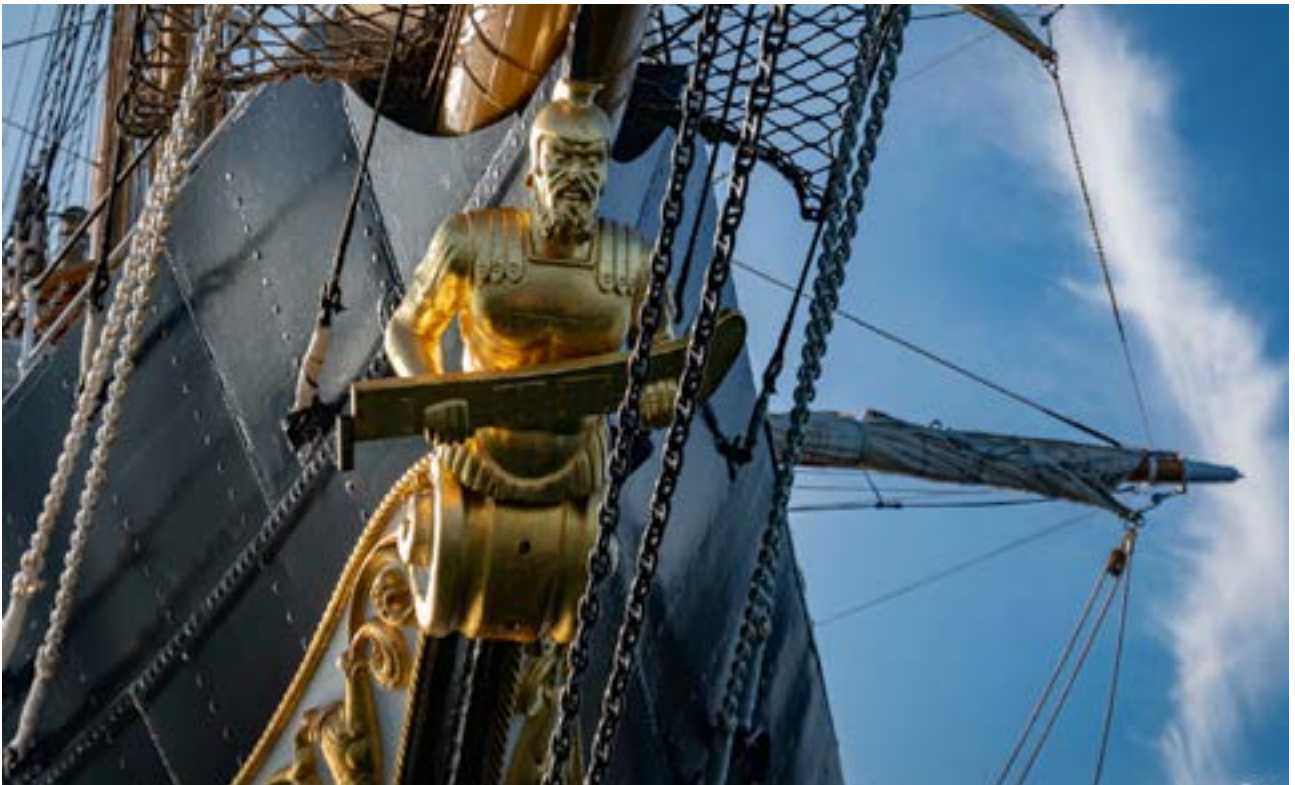
La polena del Palinuro, oro zecchino, in tutta la sua eleganza.