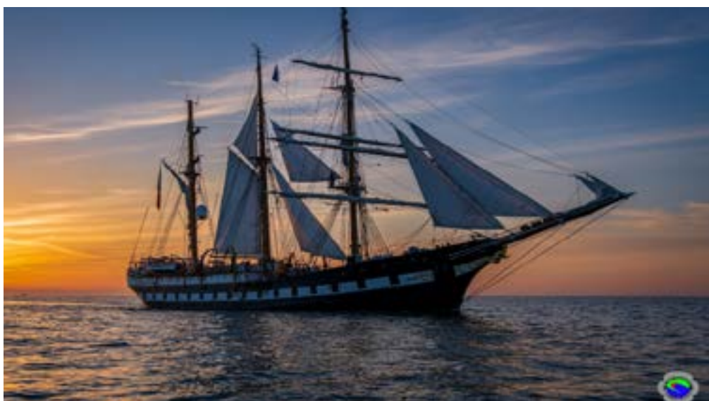
Il Palinuro nella sua nuova casa, il mare della Spezia

Col concorso dell'Autorità di sistema portuale, sono state realizzate le stampe per la riproduzione dell'opera poi donate all'equipaggio e ai ragazzi del Nautico e del Cisita saliti a bordo della nave – all'ancora alle Grazie – il 29 ottobre scorso nell'ambito delle attività didattiche promosse dal Cantiere