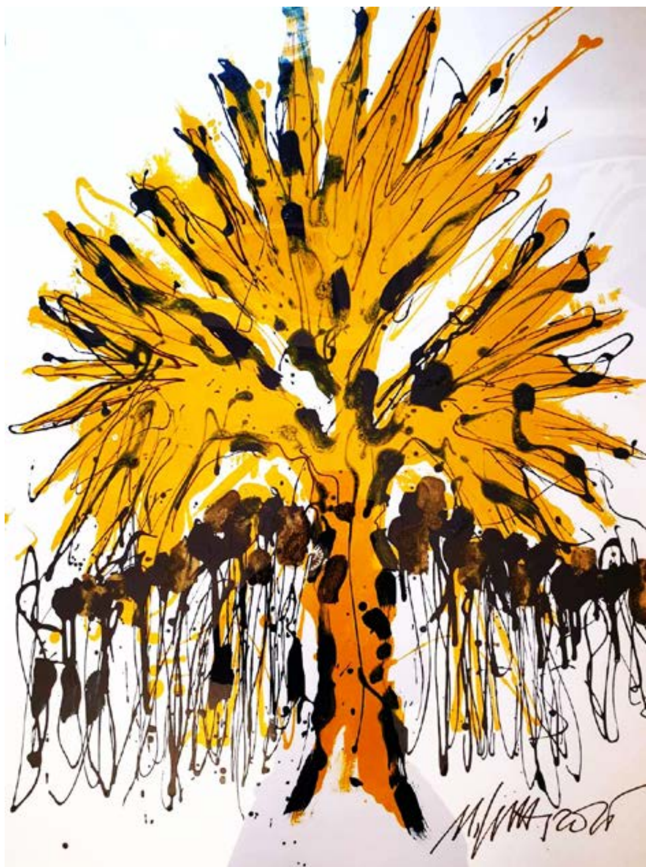
Opera di Nicola Sutti