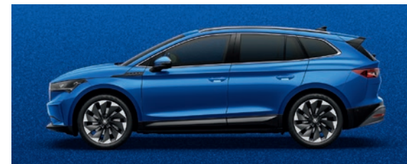
Metallic Race Blau