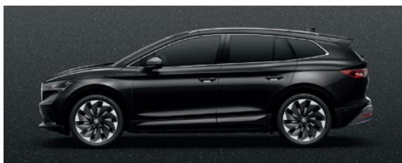
Perleffekt Schwarz Magic