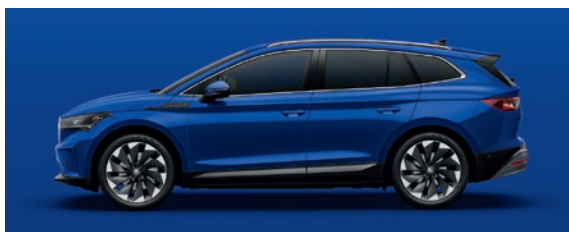
Uni Energy Blau