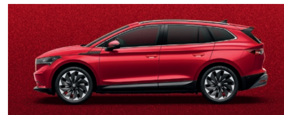
Metallic Velvet Rot

Die Preise verstehen sich in CHF inkl. 8.1% MwSt. Einige der oben aufgeführten Mehrausstattungen können nur in Verbindung mit zusätzlichen Mehrausstattungen bestellt werden. Die dargestellten Farben können von den tatsächlichen Farben und Lackbeschaffenheiten abweichen. Zudem sind nicht alle aufgeführten Mehrausstattungen miteinander kombinierbar. Für detailliertere Informationen kontaktieren Sie bitte Ihren Škoda Partner.