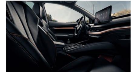
L&K Suite schwarz