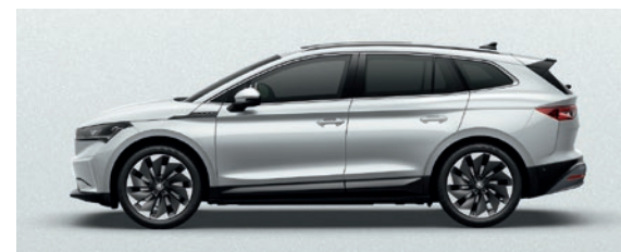
Metallic Moon Weiss