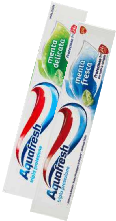
AQUAFRESH DENTIFRICO VARI TIPI 75 ML