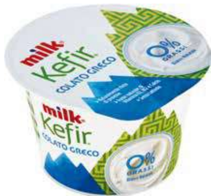
MILK KEFIR GRECO 150 G