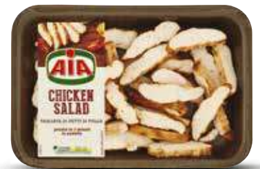
AIA CHICKEN SALAD 300 G