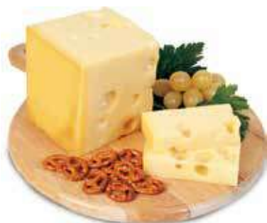
PRÉSIDENT EMMENTAL AL KG