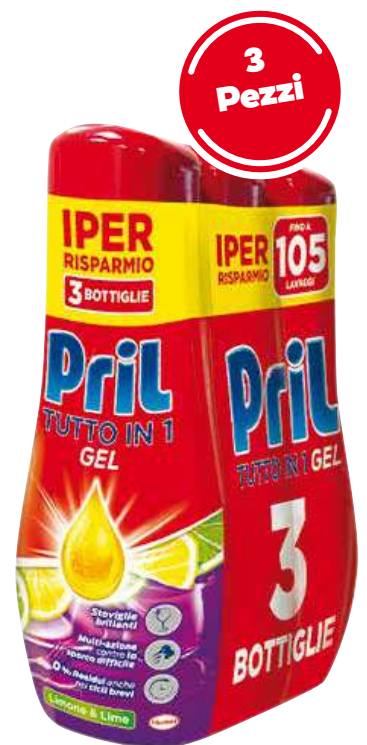
PRIL TUTTO IN 1 GEL LAVASTOVIGLIE VARI TIPI 630 ML X 3