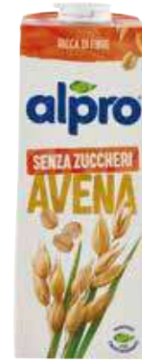
ALPRO BEVANDA 100% VEGETALE VARI GUSTI 1 LITRO