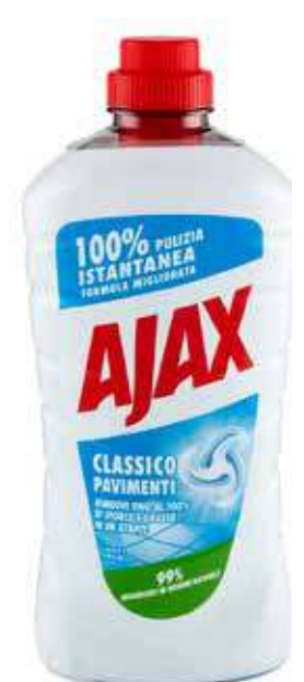
AJAX DETERGENTE PAVIMENTI VARIE PROFUMAZIONI 1 LITRO