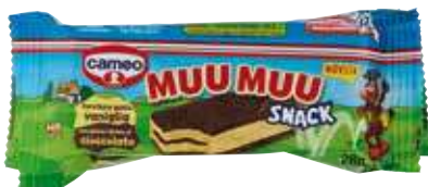
CAMEO MUU MUU SNACK 28 G X 4