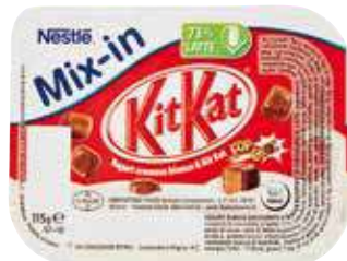
NESTLÉ MIX - IN SNACK VARI TIPI 115 G