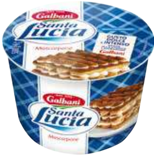
GALBANI SANTA LUCIA MASCARPONE 500 G