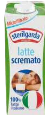
STERILGARDA LATTE SCREMATO MICROFILTRATO 1 LITRO