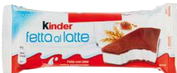
FERRERO KINDER FETTA AL LATTE 28 G X 5