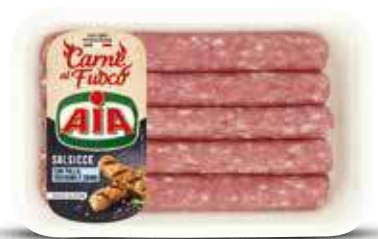
AIA SALSICCIA DI POLLO E TACCHINO 400 G