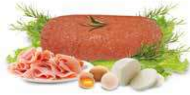
POLPETTONE DI BOVINO ADULTO CON PROSCIUTTO COTTO E PROVOLA AL KG