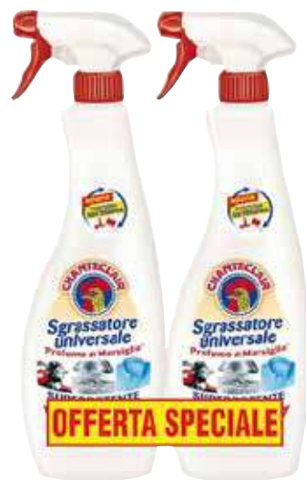
CHANTE CLAIR SGRASSATORE SPRAY MARSIGLIA 600 ML X 2