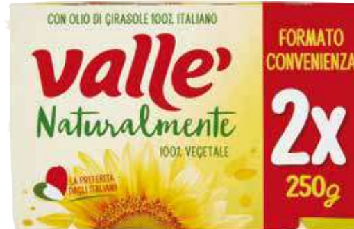
VALLÈ NATURALMENTE 250 G X 2