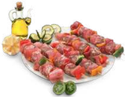
SPIEDINI MISTI AL KG