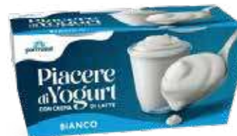
PARMALAT PIACERE DI YOGURT VARI TIPI 115 G X 2