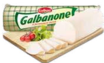
GALBANI GALBANONE AL KG