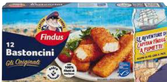
FINDUS BASTONCINI DI MERLUCCIO X 12 - 300 G