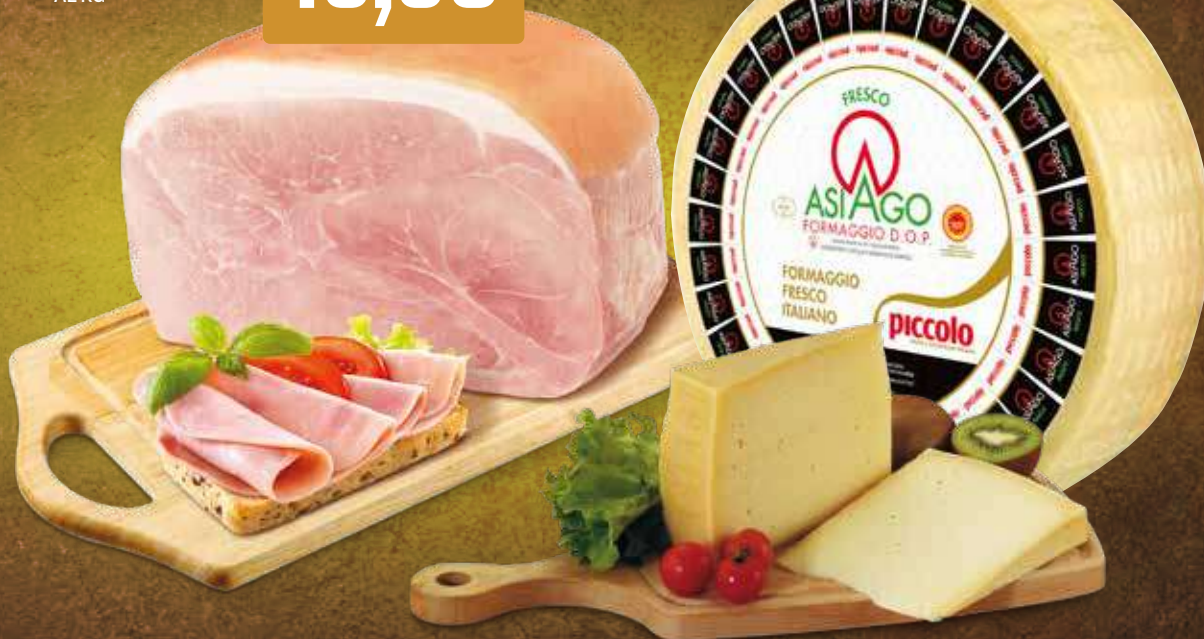
piccolo ASIAGO DOP AL KG