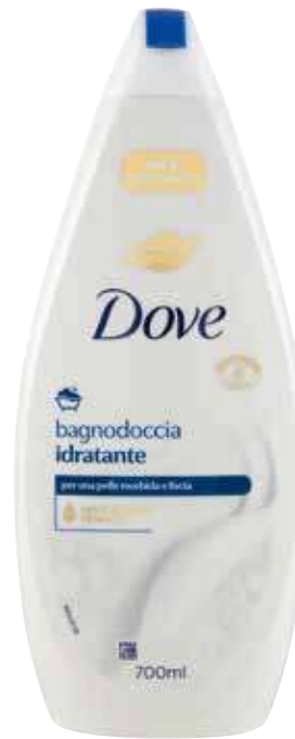
DOVE BAGNODOCCIA VARIE PROFUMAZIONI 700 ML