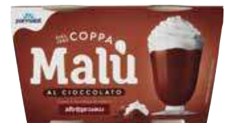
PARMALAT COPPA MALÙ VARI GUSTI 100 G X 2