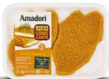
AMADORI COTOLETTA SOTTILE 300 G