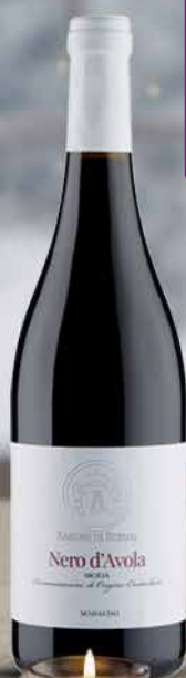
BARONE BERNAJ VARI TIPI 75 CL