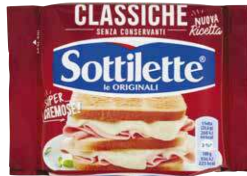
SOTTILETTE CLASSICHE 200 G