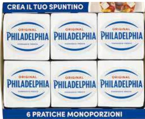
PHILADELPHIA ORIGINAL/LIGHT 25 G X 6