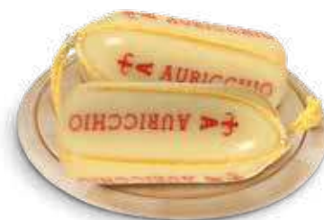
AURICCHIO PROVOLONE GIOVANE SALAMINI AL KG