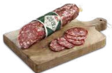
GALBANI SALAME NAPOLI AL KG