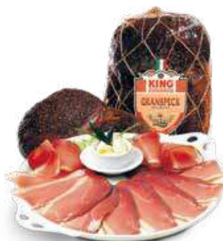
KING'S GRAN SPECK AL KG