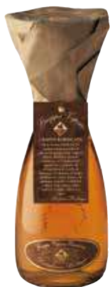
BOTTEGA GRAPPA AL VAPORE 50 CL