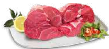
MUSCOLO DI BOVINO AL KG