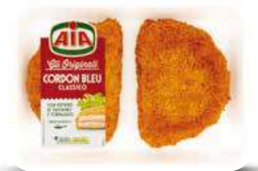
AIA CORDON BLEU 245 G