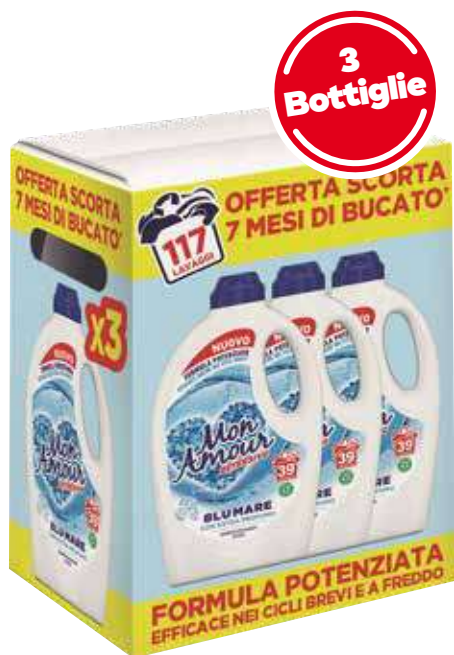
MON AMOUR DETERSIVO LAVATRICE 39 LAVAGGI X 3 PEZZI