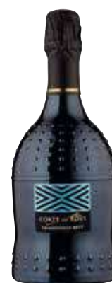
CORTE DEI ROVI CHARDONNAY BRUT 75 CL