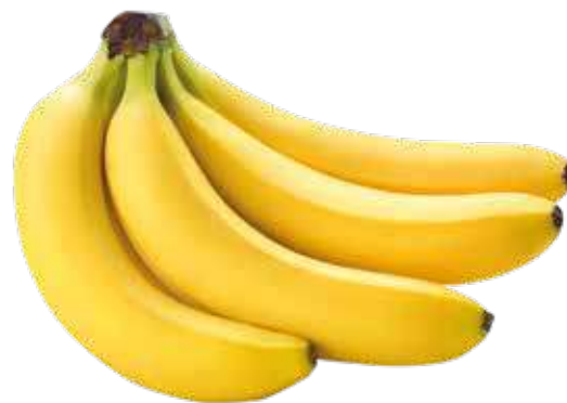
BANANE AL KG