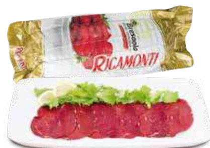
RIGAMONTI BRESAOLA ORO AL KG