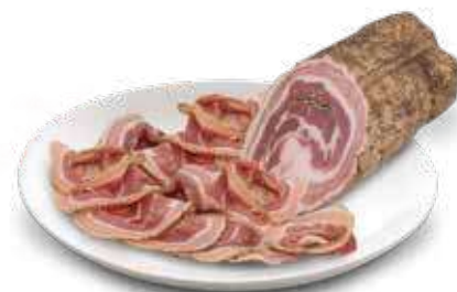
JVON PANCETTA PAESANA AL KG