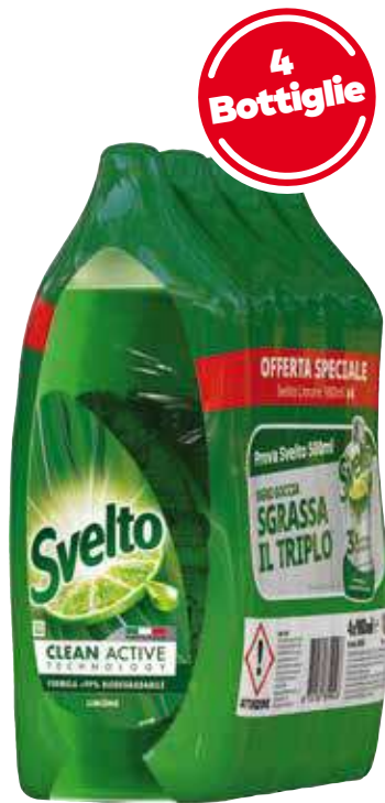
SVELTO DETERGENTE PIATTI LIMONE 980 ML X 4