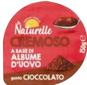
LE NATURELLE CREMOSO A BASE DI ALBUME D'UOVO VARI GUSTI 150 G