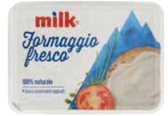
MILK FORMAGGIO FRESCO CLASSICO/LIGHT 200 G