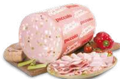
piccolo LA MORTADELLA CON PISTACCHI AL KG