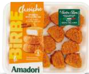
AMADORI LE BIRRE VARI TIPI 300/270 G