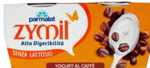
PARMALAT ZYMIL YOGURT VARI GUSTI 125 G X 2