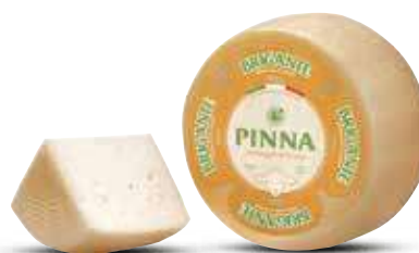
PINNA BRIGANTE AL KG