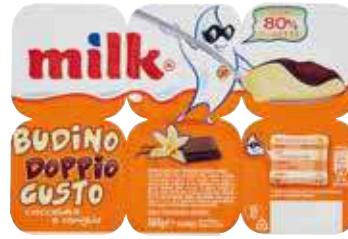
MILK BUDINO DOPPIO GUSTO 360 G