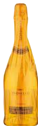
SANT'ORSOLA PROSECCO DOC 75 CL