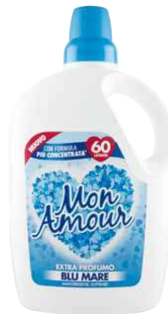
MON AMOUR AMMORBIDENTE VARIE PROFUMAZIONI 60 LAVAGGI