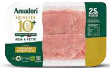
AMADORI FESA DI TACCHINO A FETTE AL KG