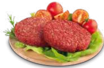
HAMBURGER DI BOVINO ADULTO AL KG