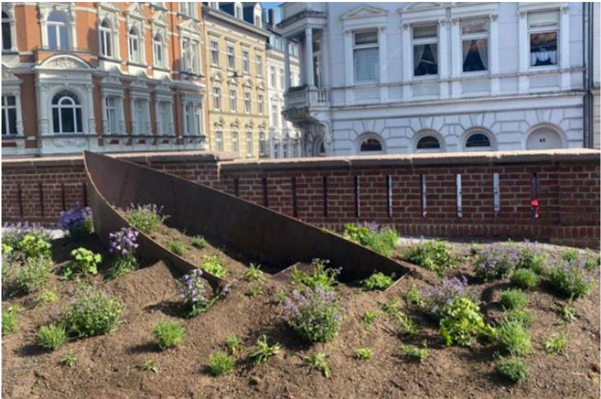
Abbildung 7: Gedenkort der Seebrücke Wuppertal (Seebrücke Wuppertal 2022)

Im Mai 2022 wurde der Gedenkort für Menschen, „die vor Krieg, Not oder Verfolgung aus ihrer Heimat geflohen sind, an Europas Grenzen den Tod gefunden haben oder in noch größeres Elend als zuvor geraten sind“ von der Seebrücke Wuppertal eingeweiht (Seebrücke Wuppertal). Die Seebrücke ist eine 2018 gegründete internationale Bewegung, getragen von verschiedenen Bündnissen und Akteur*innen der Zivilgesellschaft. Sie solidarisiert sich mit allen Menschen auf der Flucht und fordert von der deutschen und europäischen Politik sichere Fluchtwege, die Entkriminalisierung der Seenotrettung und eine menschenwürdige Aufnahme der Menschen, die fliehen mussten (vgl. Seebrücke Wuppertal). Gestaltet ist der Gedenkort durch Beete in Wellenform, einem halb untergegangenen Boot was darin liegt und einer Informations-Steele (vgl. Stein 2022; siehe Abbildung 7).