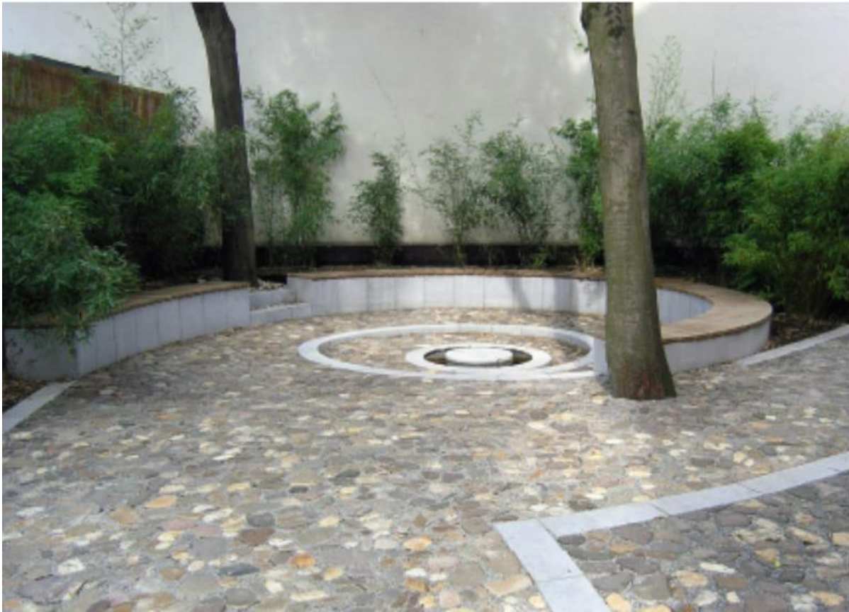
Abbildung 2: Trauerort des Psychosozialen Zentrums für Flüchtlinge Düsseldorf e.V. (PSZ Düsseldorf, 2011)