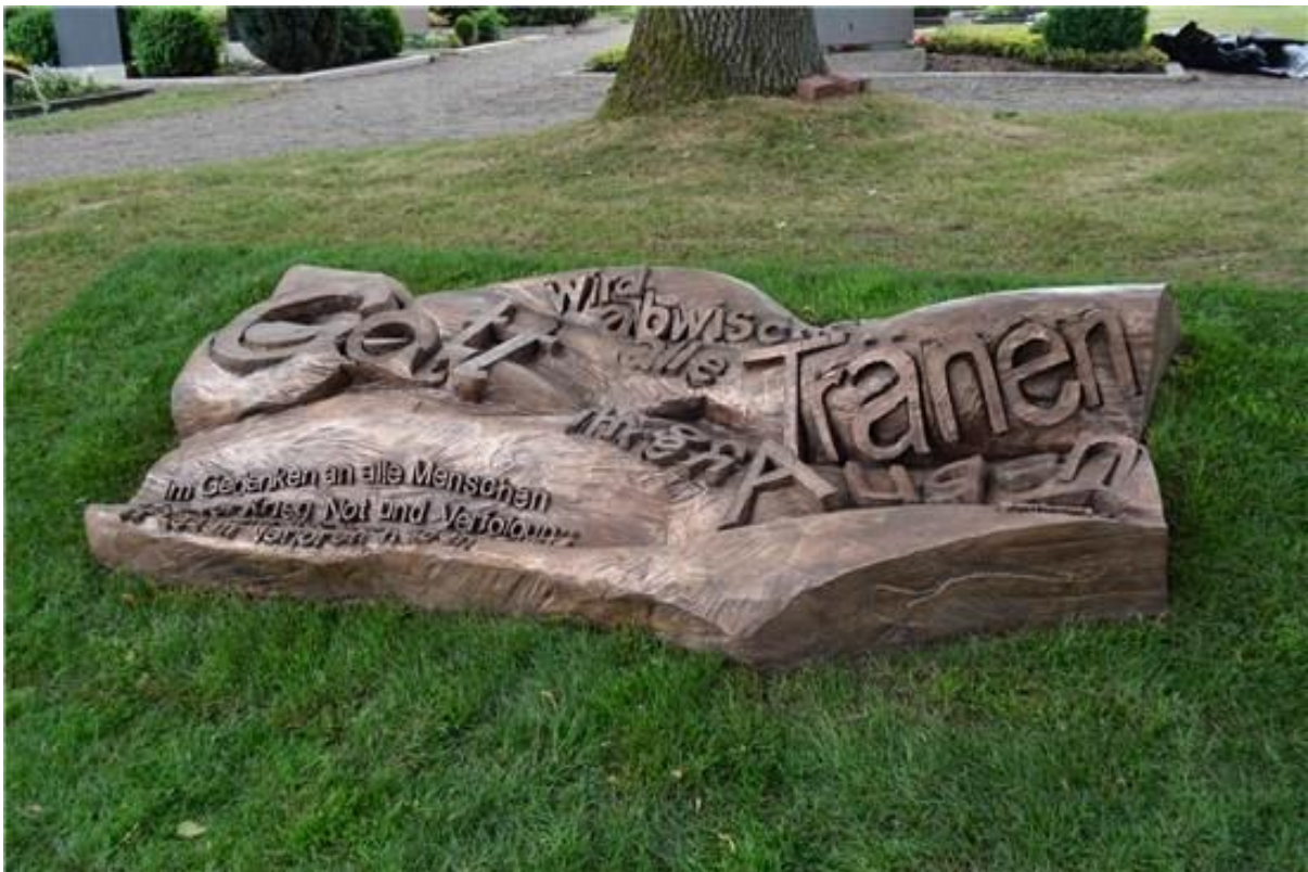
Abbildung 5: Gedenkort der Evangelischen Kirchengemeinde Arsten-Habenhausen (Ev. Kirchengemeinde Arsten-Habenhausen 2018)

Die evangelische Kirchengemeinde Arsten-Habenhausen (Bremen) errichtete 2018 auf Initiative des Arbeitskreises Asyl ein Mahnmal zum Gedenken an die Fluchttopfer auf ihrem Gelände (vgl. Ev. Kirchengemeinde Arsten-Habenhausen). Seit 1995 hat die Gemeinde zwei Standorte mit jeweils einer Kirche, einem Gemeindezentrum und einem Kindergarten. An der Arster Kirche befindet sich ein Friedhof, auf dem auch der Gedenkort für Geflüchtete errichtet wurde (vgl. Bremische Evangelische Kirche 2021; Ev. Kirchengemeinde Arsten-Habenhausen 2018). Der Gedenkort ist gestaltet als eine „liegende Bronze-Skulptur in Form eines Wellen-Teppichs, der das Meer und den Wüstensand symbolisieren soll, in denen Flüchtlinge auf dem Weg nach Europa heute vielfach ums Leben kommen“ (Scholz 2021, S. 605). Die eingearbeitete Aufschrift besteht aus dem Bibelzitat „Gott wird abwischen alle Tränen von ihren Augen“ (Offenbarung 21,4) sowie dem Zusatz „Im Gedenken an alle Menschen, die vor Krieg, Not und Verfolgung flohen und auf dem Weg zu uns ihr Leben verloren haben“ (Ev. Kirchengemeinde Arsten-Habenhausen 2018). Die ungleichmäßige Schrift soll die Unruhe des Meeres symbolisieren und den Eindruck entstehen lassen, als würden die Buchstaben auf diesen Wellen schwimmen (vgl. Schmidt 2020; siehe Abbildung 5).