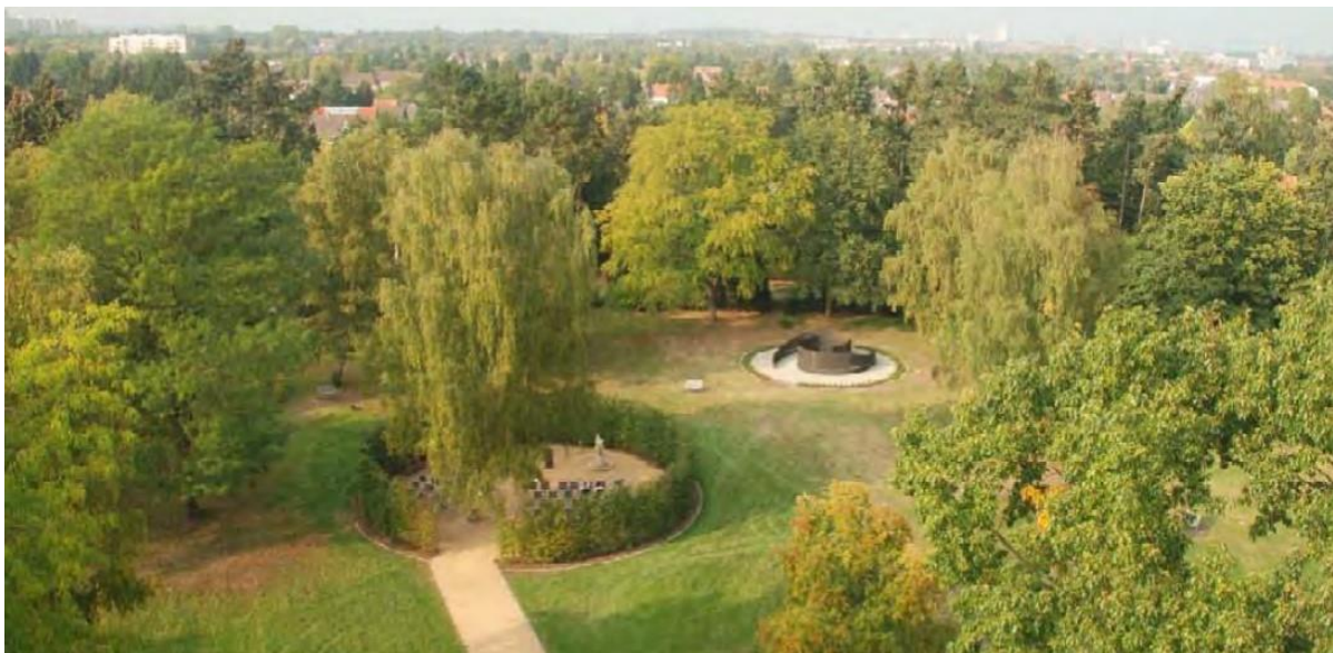
Abbildung 8: Räume der Stille auf dem Stadtfriedhof Ricklingen (Wächter 2011, S. 3)