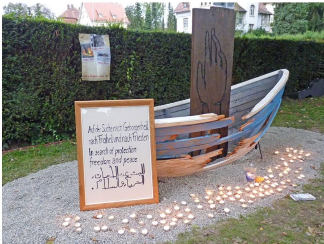
Abbildung 4: Gedenkort der Ökumenischen Migrationsarbeit im Landkreis Biberach (Braß 2018)

In Biberach hat die Ökumenische Flüchtlingsarbeit von Caritas und Diakonie (ÖMA) einen Gedenkort für Menschen die auf der Flucht gestorben sind initiiert und im Oktober 2016 eröffnet. Die ÖMA versteht sich als Ansprechpartnerin für alle im Bereich von zugewanderten Menschen Engagierten im Landkreis Biberach und in den katholischen Dekanaten Biberach und Saulgau bzw. im evangelischen Kirchenbezirk Biberach (vgl. Caritas Biberach-Saulgau). Nach „langjähriger positiver ökumenischer Erfahrung in den Asylarbeitskreisen“ wurde sie im Jahr 2015 von der evangelischen und der katholischen Kirche gegründet. In deren Auftrag unterstützt die ÖMA zugewanderte Menschen, ehrenamtlich engagierte und deren örtliche Initiativen. Träger sind die Caritas Biberach-Saulgau und die Diakonische Bezirksstelle des evangelischen Kirchenbezirks Biberach (vgl. Caritas Biberach-Saulgau). Im Zentrum des Gedenkortes steht ein „zerbrochenes Boot, aus dessen Mitte – auf einem Totenbrett dargestellt – eine Hand wie aus einer Wasseroberfläche herausragt“ (Braß 2018). Es soll an die „überladenen, nicht seetauglichen“ Boote erinnern, auf denen viele Menschen das Mittelmeer überqueren (Dreher 2016). Ergänzt wird das Denkmal durch eine Tafel, deren Text von Geflüchteten aus Gambia und Syrien formuliert und dreisprachig gestaltet wurde und auf die Motive verweist, die Menschen zur Flucht bewegen: „Auf der Suche nach Geborgenheit, nach Freiheit und nach Frieden“ (Scholz 2021, S. 605; Braß 2018; siehe Abbildung 4).