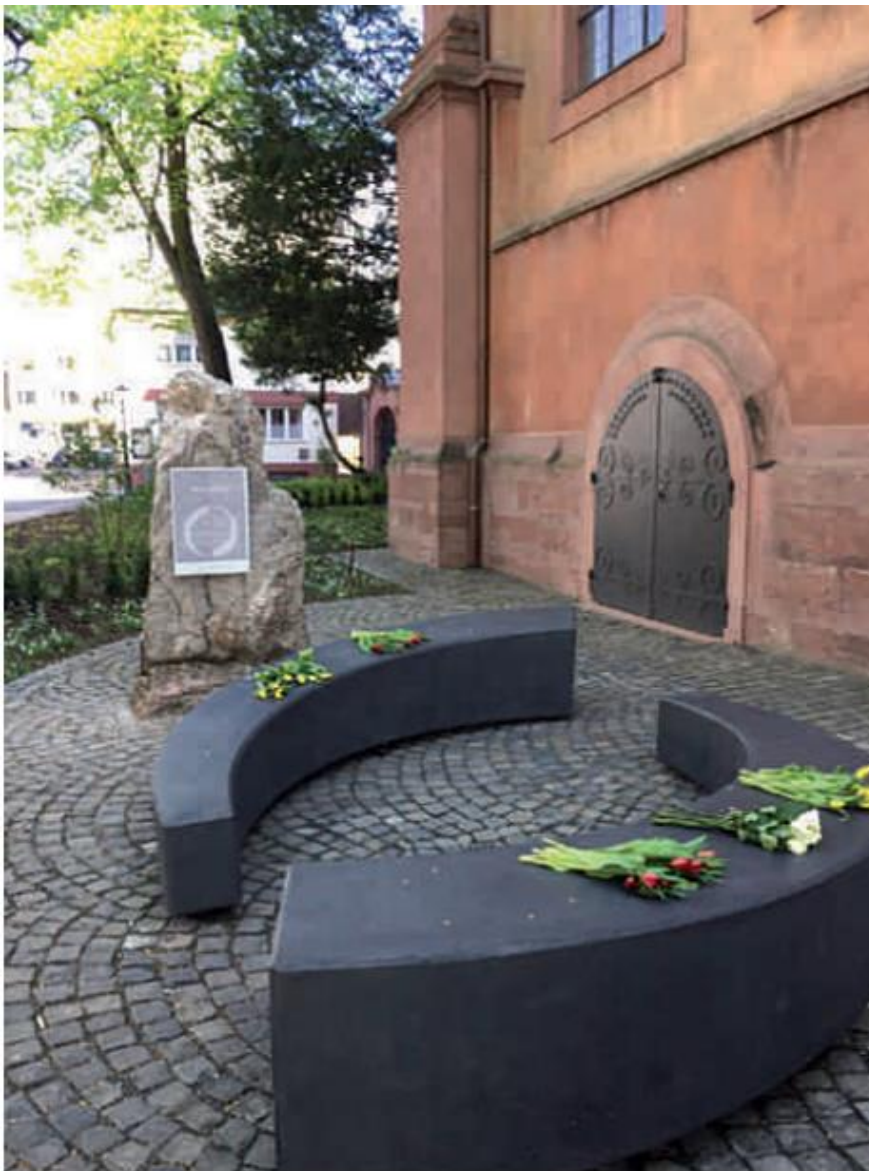
Abbildung 3: Trauerort des Psychosozialen Zentrums für Flucht und Trauma Mainz (Caritasverband Mainz e.V. 2018, S. 29)