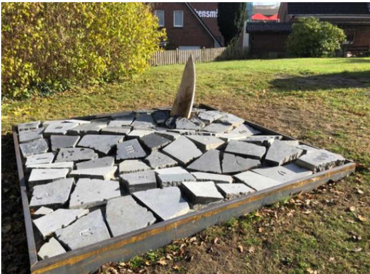
Abbildung 6: Gedenkort der Bürgerinitiative "Cadenberge Hilft" (Cadenberge Hilft 2020)

In Cadenberge im Landkreis Cuxhaven wurde im November 2020 ein Denkmal für alle auf der Flucht gestorbenen Menschen eingeweiht. Dafür kooperierte die Bürgerinitiative „Cadenberge Hilft“ mit einer lokalen Schule, einem bildenden Künstler und Kunstpädagogen, sowie der evangelischen Kirche in Cadenberge, auf deren Gelände das Denkmal errichtet wurde. Die Bürgerinitiative gründete sich 2015, nachdem in der Gemeinde eine Notunterkunft für Geflüchtete eröffnet wurde. Zu der Zeit engagierten sich über 80 Ehrenamtliche in verschiedenen Bereichen – einem Kontaktcafé, einer Nähstube, bei der Begleitung zu Terminen sowie bei Freizeitangeboten und Ausflügen (vgl. Cadenberge Hilft). Der Gedenkort besteht aus Grabsteinfragmenten, die die Wellen des Meeres symbolisieren sollen. Auf ihnen ist der Anfangsbuchstabe des Wortes „Mensch“ auf 20 verschiedenen Sprachen eingearbeitet. Ergänzt werden die Fragmente von einem stilisierten, halbgekehrten Holzschiff (vgl. Cadenberge Hilft 2020; siehe Abbildung 6).