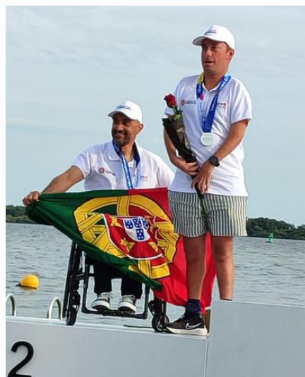
ISAF Para World Championship