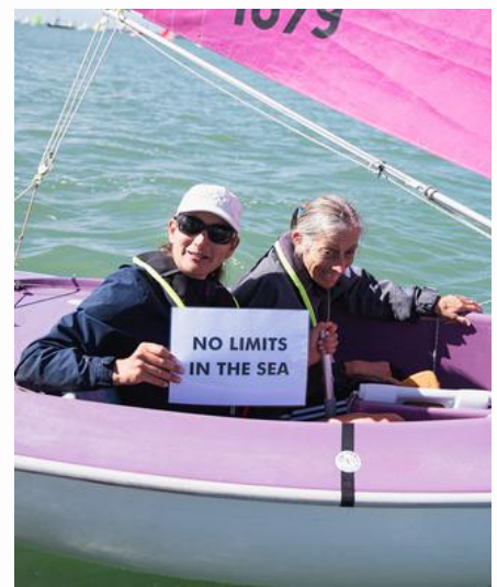
Campeonato do Mundo Hansa