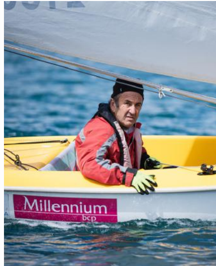
1º Prova de Apuramento Nacional

Após o trabalho realizado no ano anterior, foi possível, em 2023, estar presente em provas nacionais, internacionais e no campeonato do Mundo de Hansa.