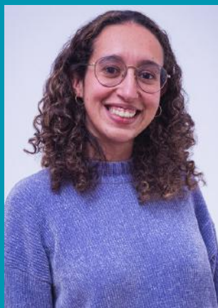
RITA INÁCIO COMUNICAÇÃO