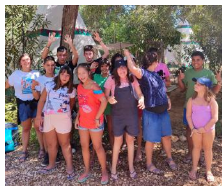
Salema Eco Camp Setembro