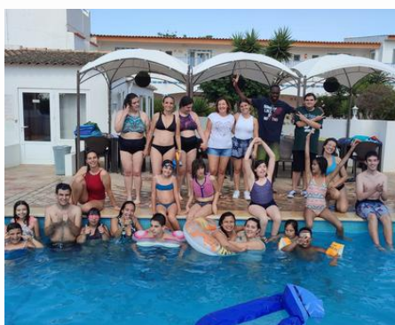
Centre Algarve Hotel Maio

Novas experiências, como a ida a um parque aquático, a realização de um acampamento e um fim de semana repleto de atividades.