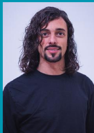
ÁLVARO GÓMEZ AUDIOVISUAIS