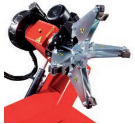
Mondolfo's TBE 128 Super kan tages nærmere i øjsyn på Transportmessen i Herning d. 22.-24. april, hvor Stenhøj naturligvis stiller med flere produkter på stand L9010.