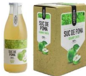
Poma Granny Smith