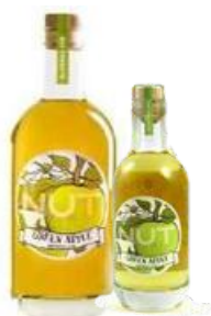
GIN NUT Poma