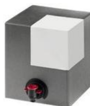
BAG IN BOX 5 litres

D.O. Empordà Vi de licor dos naus Moscatell Garnatxa Vi ranci