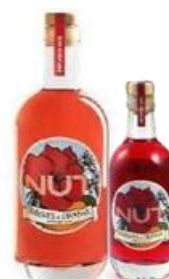
GIN NUT Hibiscus