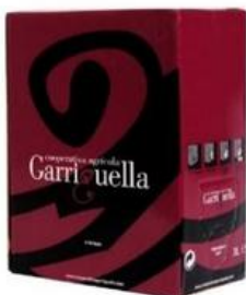
BAG IN BOX 20 litres