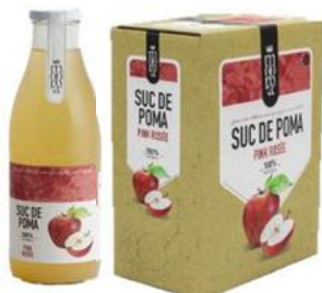
Poma Pink rosée