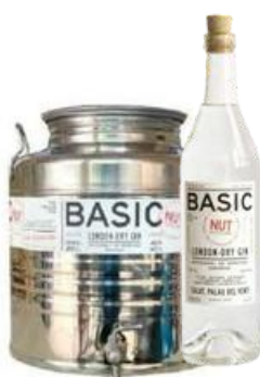
GIN NUT BASIC