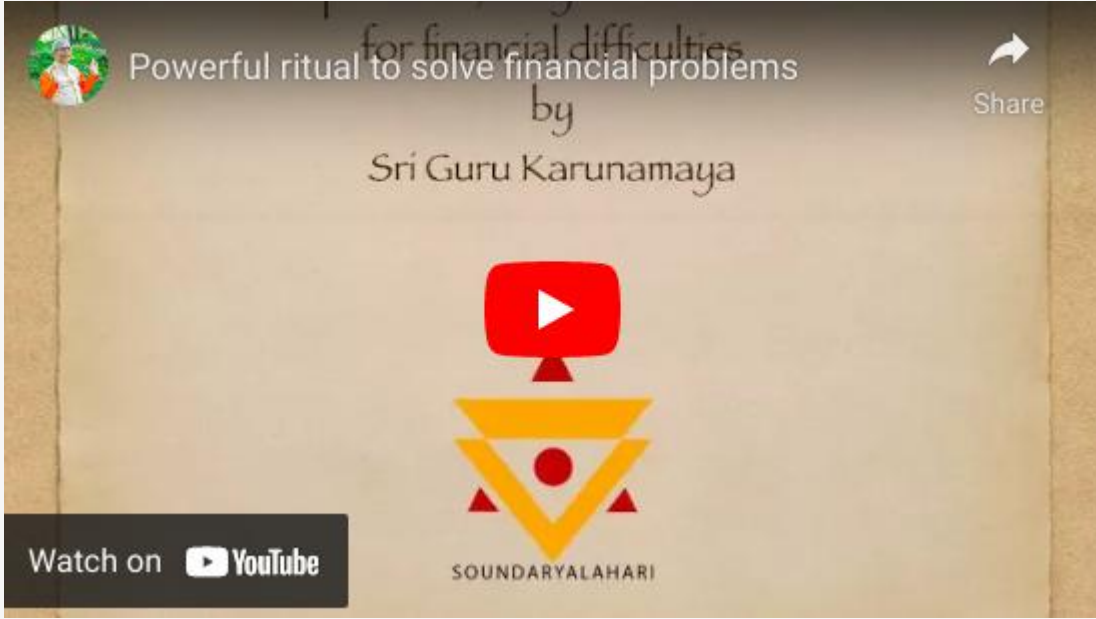
వలకుల పూజ వీడియో