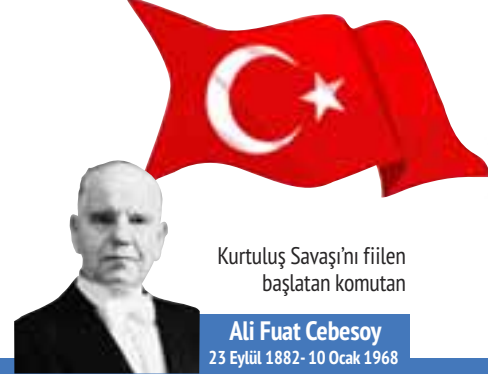
Kurtuluş Savaşı'nı fiilen başlatan komutan Ali Fuat Cebesoy 23 Eylül 1882-10 Ocak 1968