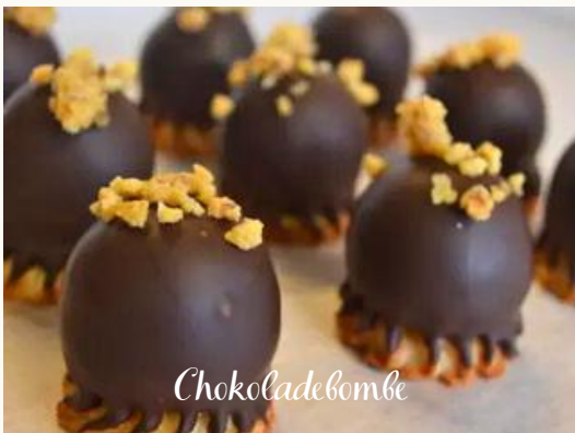
Chokoladebombe Lækkert knæk af mørk chokolade med en blød chokolademidte - på kranskekagebund.