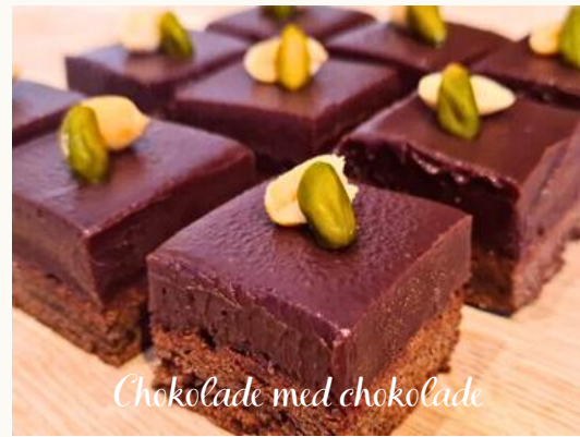
Chokolade med chokolade Chokoladebund bagt med mørk chokolade, toppet med mørk chokoladeganache. Chokolade fra Honduras 70% kakao.