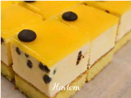
Havtorn Svampet marcipanbund med mousse af havtorn, blodappelsin og stykker af mørkchokolade.