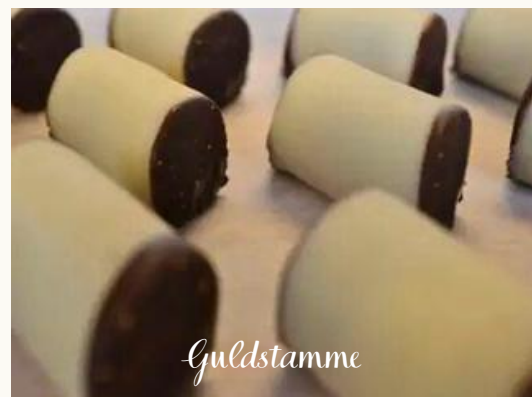
Guldstamme Guldstammer, der er lavet af chokoladebunde smagt til med Jamaica-rom, abrikos og kakao. Overtrukket med marcipan og dyppet i belgisk chokolade.