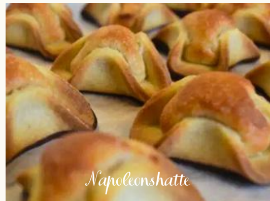
Napoleonshatte En bagt linsedejsbund med kranskekagemasse i midten, dyppet i mørkchokolade.