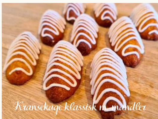
Kransekage klassisk m. mandler

En lækker lille fyldig kage med chewy toffee bund og hasselnøddemousse og toppet med saltkaramelganach.