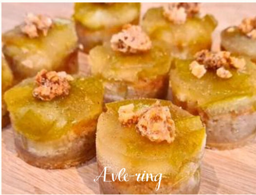
Able-riing Fyldig kage med en fast mandelbund på sprød mørdej, toppet med en delikat æblekompot tilsmagt med ingefær.