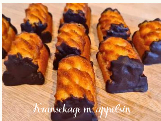
Kransekage m. appelsin

Kransekage af mandelmasse fyldt med nougat. Skønt, blødt, sødt og fyldigt - kransekagestykke.