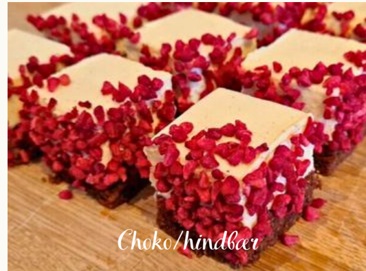
Choko/hindbær Chokoladebund med marcipan og belgisk chokolade, hvidchokolademousse med vanilje og pyntet med frysetørret hindbær.