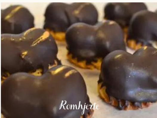
Romhjerte Lækkert knæk af mørk chokolade med en fyldig marcipanmasse smagt til med Jamaica-rom - på kranskekagebund.