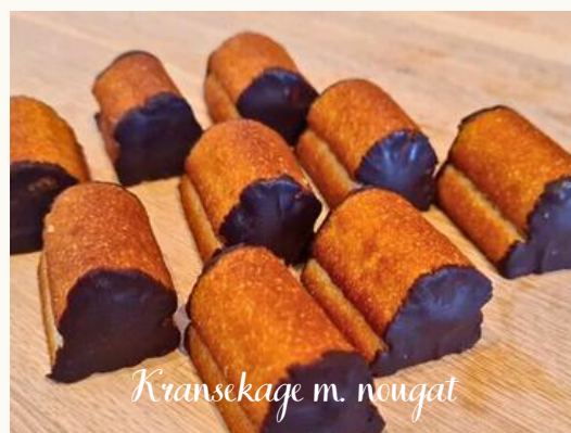
Kransekage m. nougat

Chokoladekonfektbund med karamelmousse, hvori der er overraskelser af passionskaramel. Toppet med passionsglace.