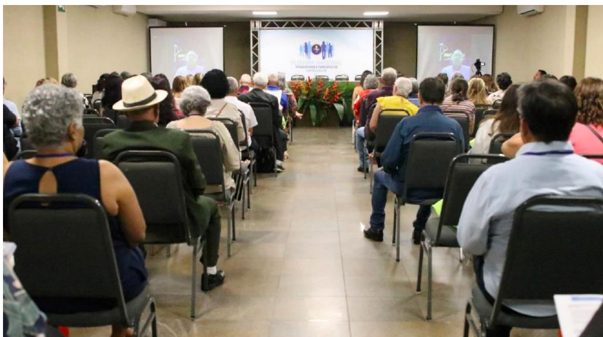
Foto 4 – Presidente do CNRE – Gerônimo Luiz Sartori (participação virtual)