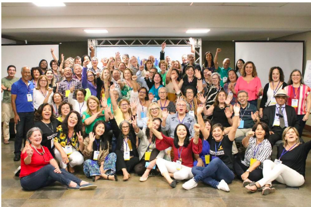
Foto 14 - Todos os participantes da Plenária