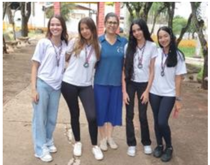
2º Lugar – Prata: E.E. Lázaro do Páteo