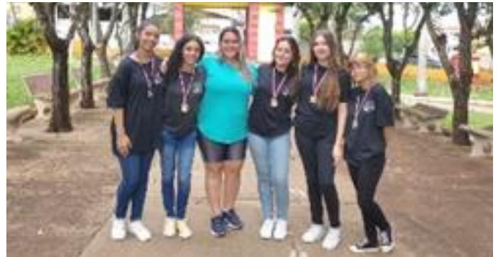
1º Lugar – Ouro: E.E. Gabriel Pozzi