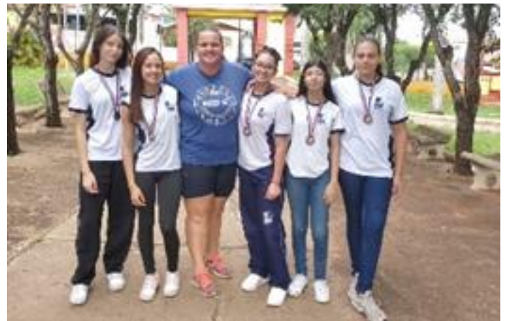
3º Lugar – Bronze: E.E. Leovegildo Chagas Santos