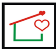
FUNDACJA OPIEKI PRO-TUTELA

Stowarzyszenie Krajowa Izba Domów Opieki KIDO potwierdza współpracę z Fundacja Opieki Pro-Tutela z siedzibą w Szczecinie na poziomie Partnera Stowarzyszonego Izby . Niniejszym w oparciu o nasze dotychczasowe doświadczenia rekomendujemy Fundacja Opieki Pro-Tutela