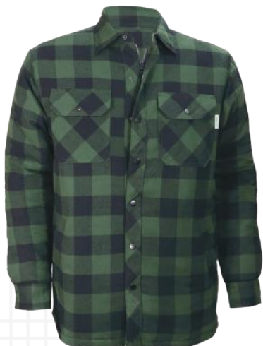
Vert forêt Green forest