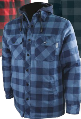
Steel blue Bleu acier