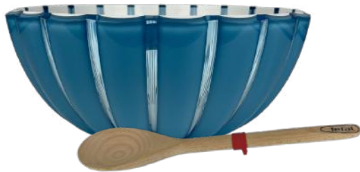
DUO 4 Saladier Moyen Bleu - Guzzini - Démarque de Marques 32,50€ 27€ Spatule en Bois - Tefal - Home & Cook 6,90€ 4,80€