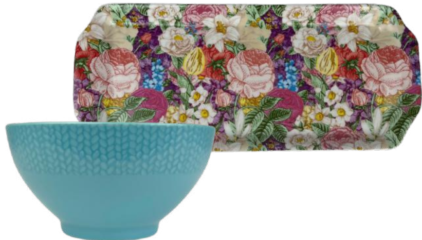
DUO 5 Plateau Motifs Fleurs - Aulica - Arc Outlet 43,30€ 29,95€ Bol Bleu - Guzzini - Démarque de Marques 8€ 4,99€