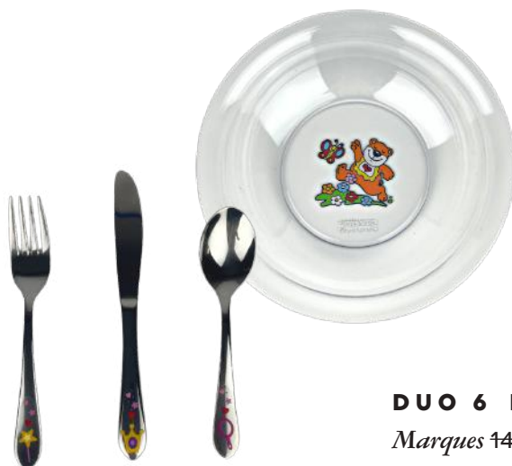
DUO 6 Ménagère Enfant 3 Couverts - Démarque de Marques 14,90€ 9,95€ Bol Enfant - Guzzini - Démarque de Marques 5,95€