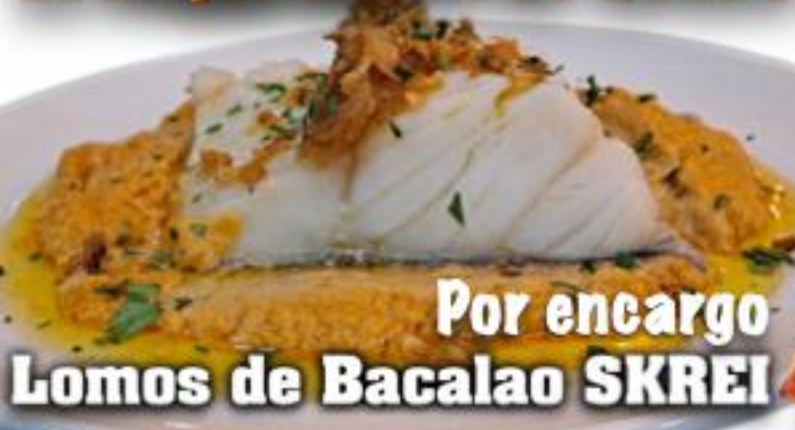
Por encargo Lomos de Bacalao SKREI