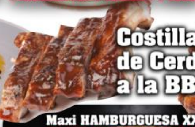
Costillas de Cerdo a la BBQ