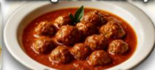
salsa de tomate