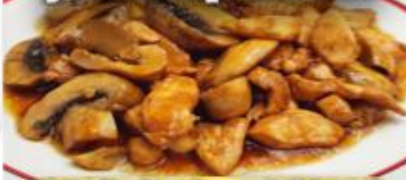
Estofado de mi Abuela