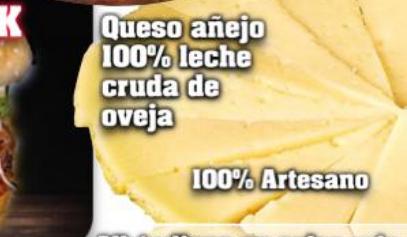
Queso añejo 100% leche cruda de oveja