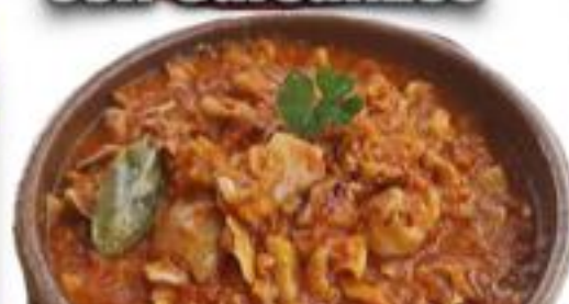
Oreja de cerdo en salsa con jamón y chorizo