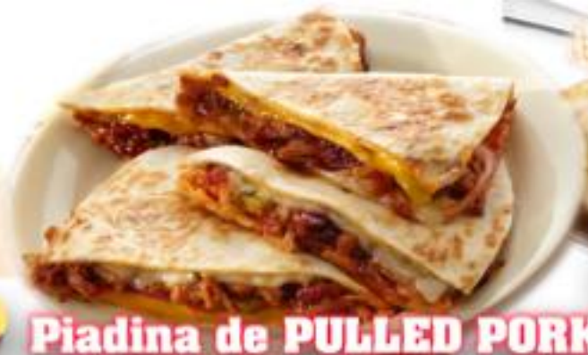
Piadina de PULLED PORK