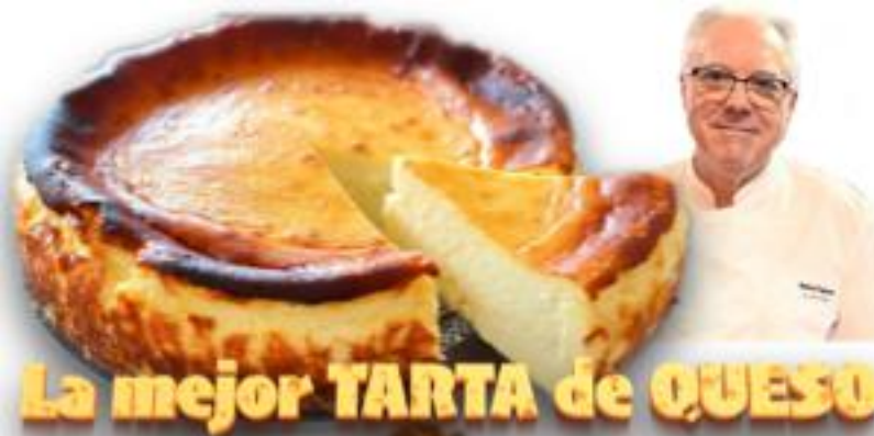
La mejor TARTA de QUESO