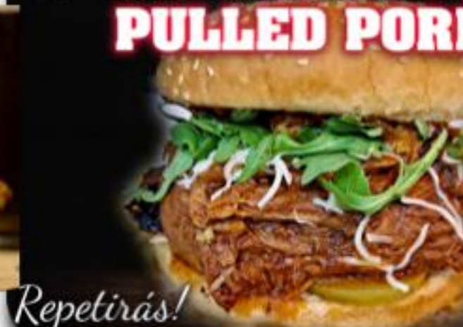
Maxi HAMBURGUESA XXL PULLED PORK