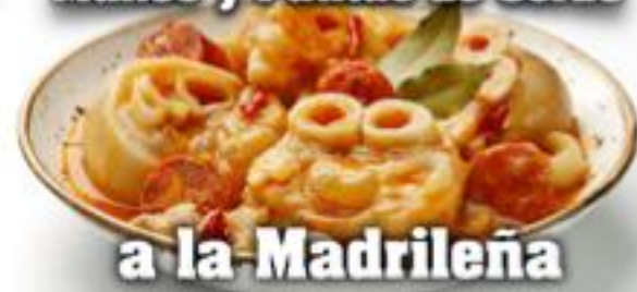
a la Madrileña