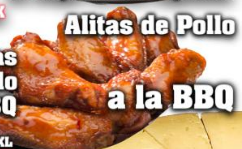
Alitas de Pollo a la BBQ