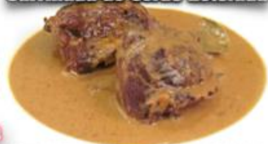
Carrillada de Vacuno Estofada