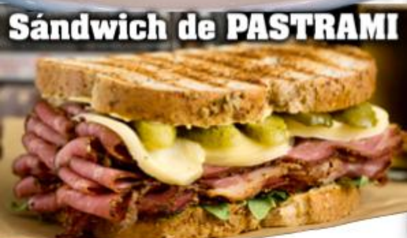
Sándwich de PASTRAMI