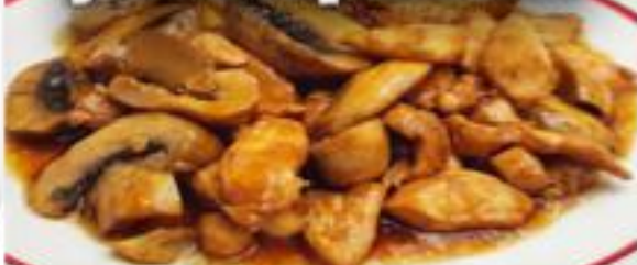
Estofado de mi Abuela