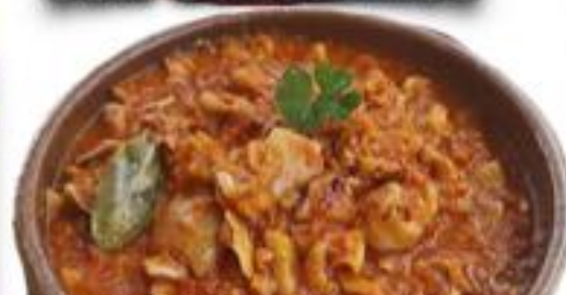
Oreja de cerdo en salsa con jamón y chorizo