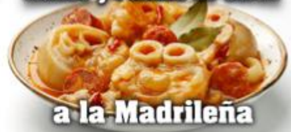
a la Madrileña