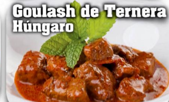
Goulash de Ternera Húngaro