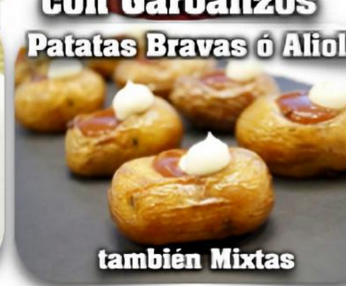
Patatas Bravas ó Alioli