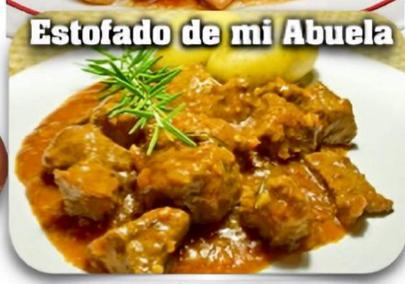
Estofado de mi Abuela