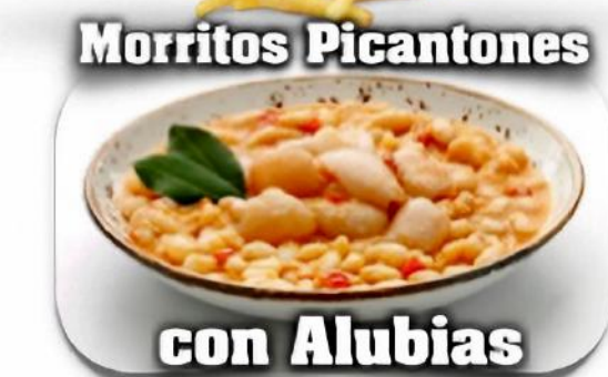
Morritos Picantones con Alubias