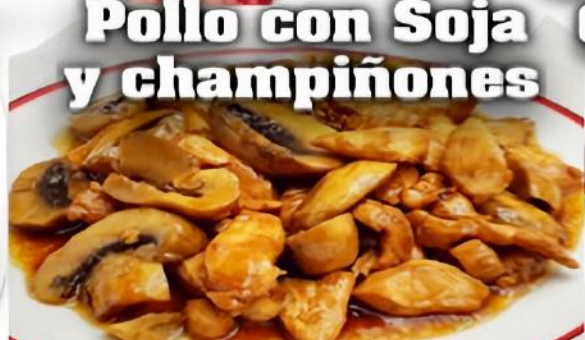
Pollo con Soja y champiñones