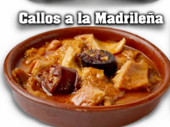
Callos a la Madrileña