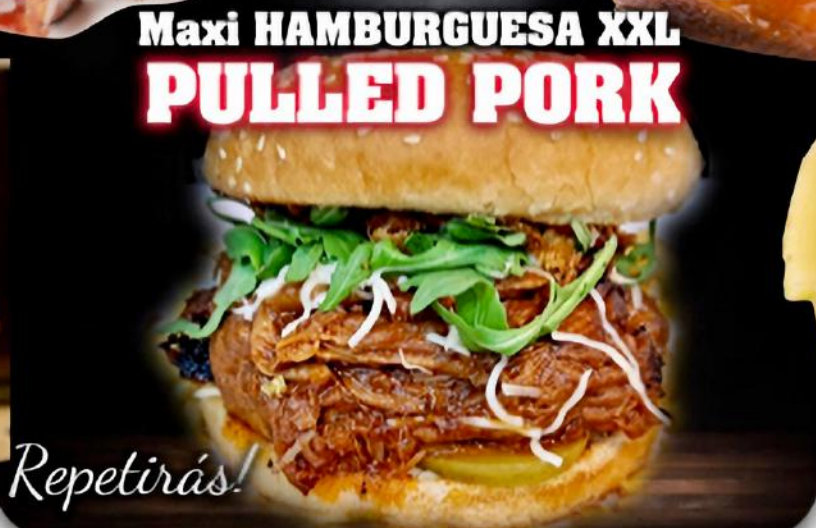
Maxi HAMBURGUESA XXL PULLED PORK