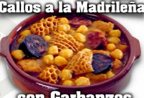
Callos a la Madrileña con Garbanzos