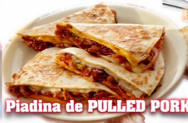
Piadina de PULLED PORK