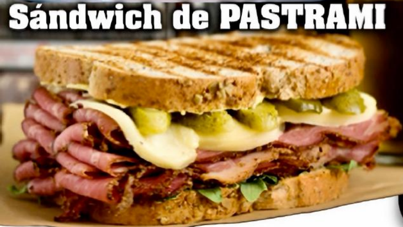
Sándwich de PASTRAMI