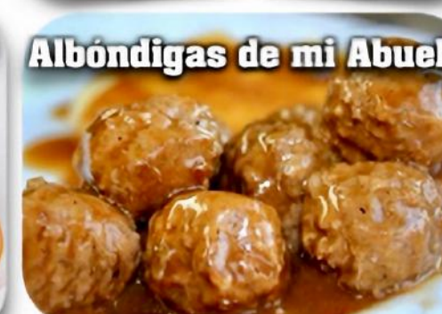
Albóndigas de mi Abuela