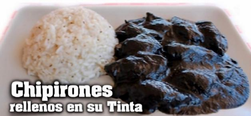
Chipirones rellenos en su Tinta