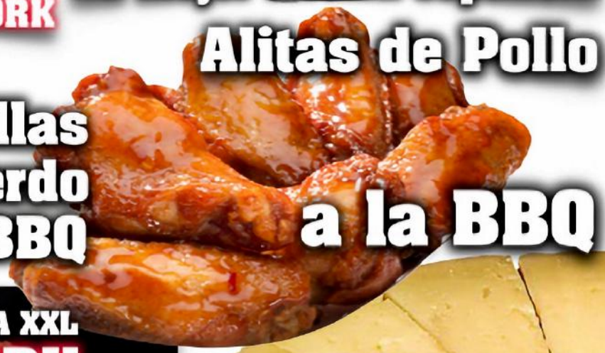
Alitas de Pollo a la BBQ