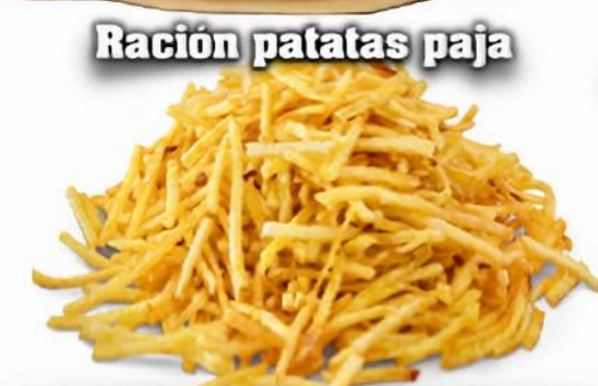
Ración patatas paja