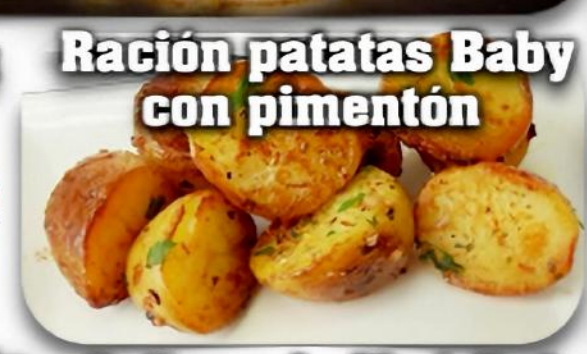
Ración patatas Baby con pimentón