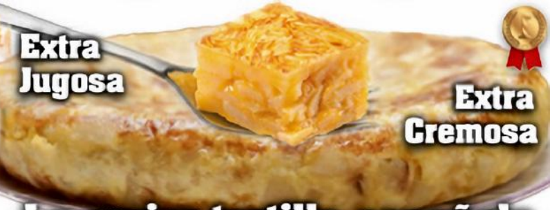
Extra Jugosa Extra Cremosa La mejor tortilla española