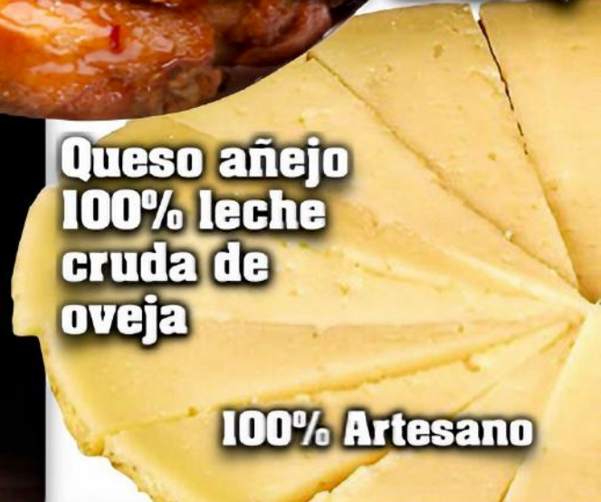
Queso añejo 100% leche cruda de oveja