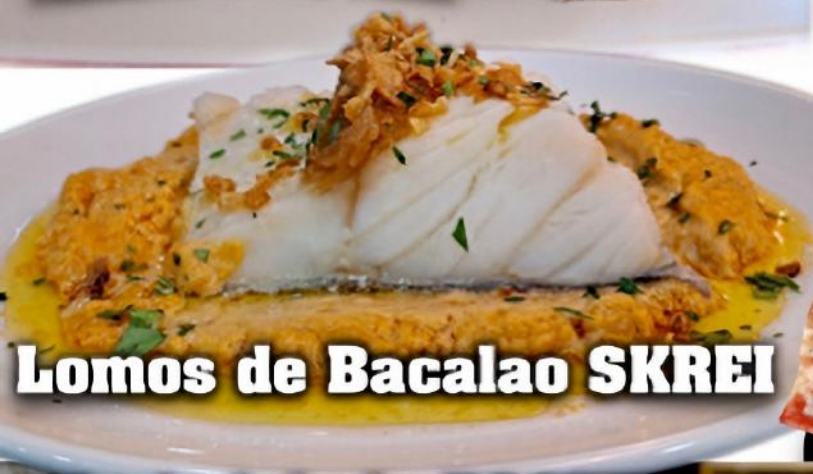
Lomos de Bacalao SKREI