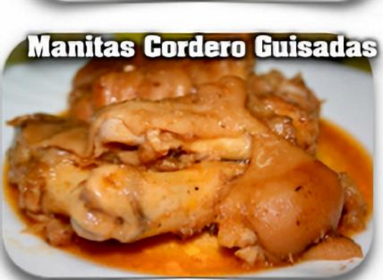
Manitas Cordero Guisadas