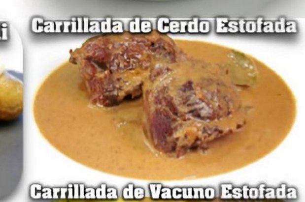
Carrillada de Cerdo Estofada