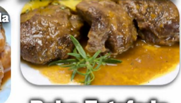
Carrillada de Vacuno Estofada