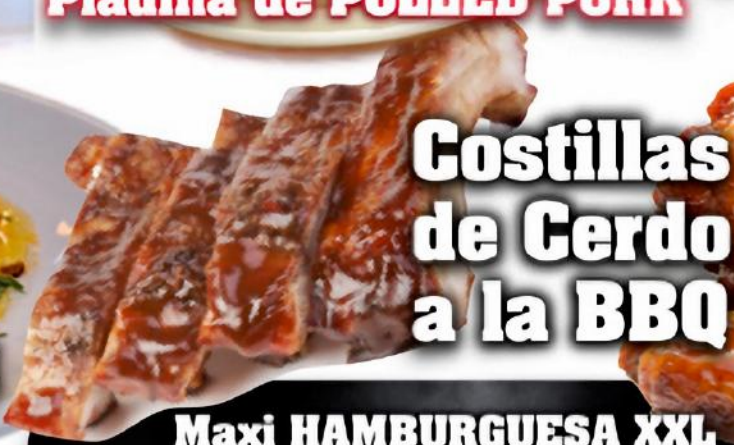
Costillas de Cerdo a la BBQ