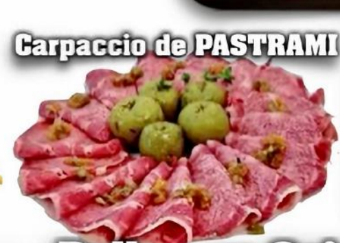
Carpaccio de PASTRAMI