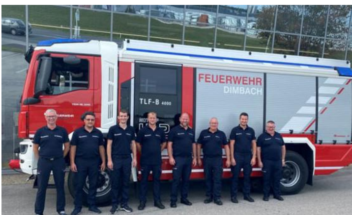
Das Kommando bei der Fahrzeugübergabe in Asten bei Fa. Rosenbauer

Danke an die Diebe, den Volksschulkindern, den Kameradschaftsbund, dem Musikverein, der Landjugend sowie den Goldhauben für die tolle und gelungene Veranstaltung.