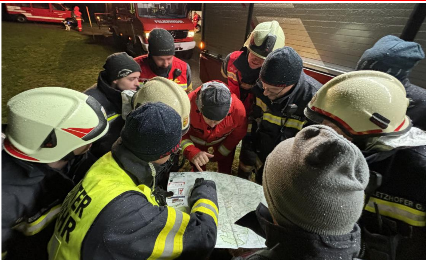
Übung; KameradInnen gemeinsam mit der Rettungshundebrigade bei der Lagebesprechung

Ein ganz großes Dankeschön möchte ich im Namen der Freiwilligen Feuerwehr der gesamten Bevölkerung und den Gewerbetreibenden für die Unterstützung bei der Fahrzeugsammlung aussprechen. Wir hatten uns einen gewissen Betrag erhofft, doch dieser wurde bei weitem übertroffen. Danke an alle für die Unterstützung.