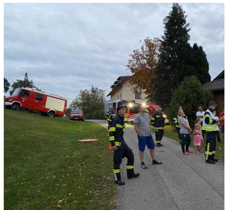
Suche nach entlaufenem Kalb, Unterstützung durch Drohne