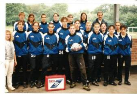
A1 - 1996/1997 Alemannia Pfalzdorf