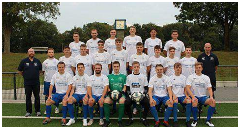
Die Zweite bildet auch das Korsett der Vierten. Dadurch kann ausreichend Spielpraxis für die jungen Talente garantiert werden.

Van KESSEL ▲ Sand-Kies-Beton ▼ Zand-Grind-Beton www.vankessel.de