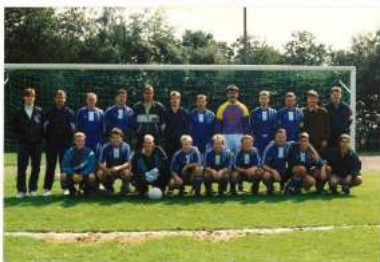
1. Mannschaft - Saison 1992/1993 Alemannia Pfalzdorf