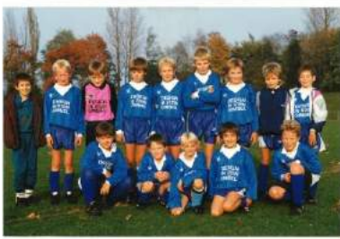
E1 - Saison 1992/1993 Alemannia Pfalzdorf