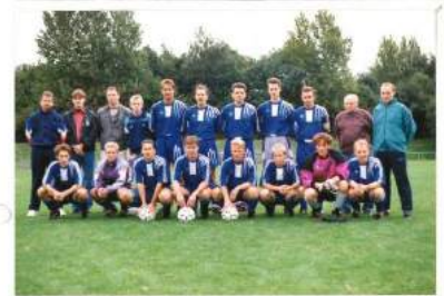
1. Mannschaft - Saison 1994/1995 Alemannia Pfalzdorf