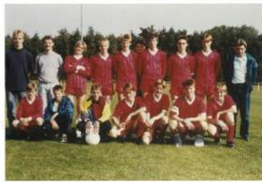
B1 - Saison 1992/1993 S.G. Alemannia Pfalzdorf - DJK Ha-Ha