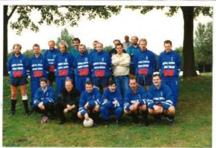
Alle Herren - Saison 1993/1994 Alemannia Pfalzdorf