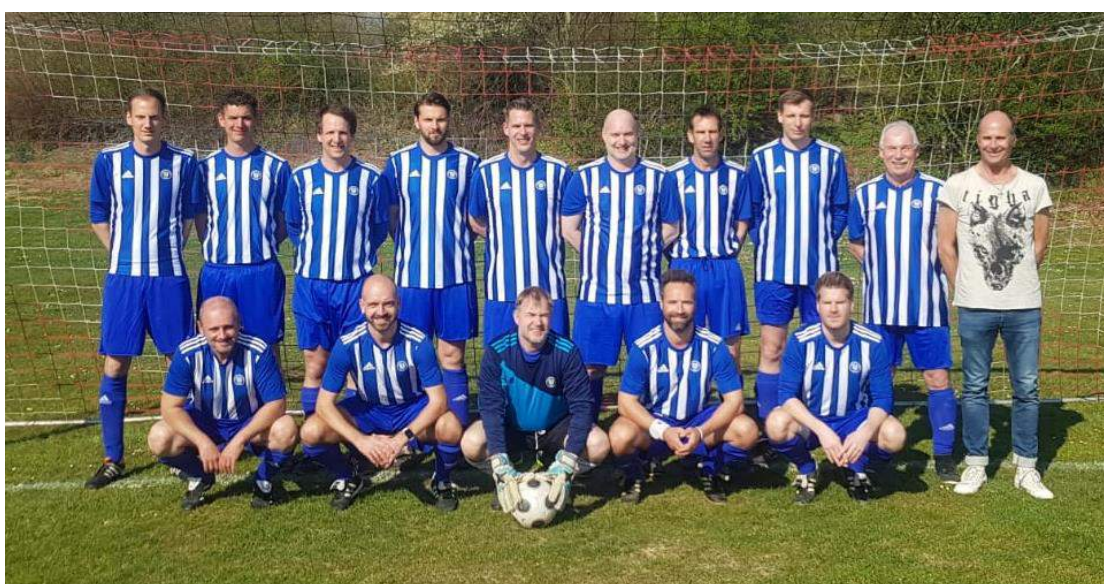
Die AH im neuen Dress beim Auswärtsspiel in Emmerich.

Als kleines Trostpflaster soll eine Radtour noch in diesem Jahr angeboten werden. Natürlich sind hierbei auch alle Ehefrauen