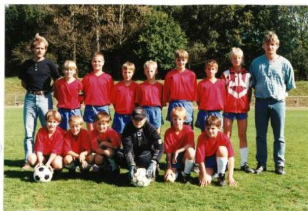
D1 - 1997/1998 Alemannia Pfalzdorf