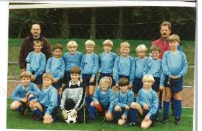
F1 - Saison 1995/1996 Alemannia Pfalzdorf