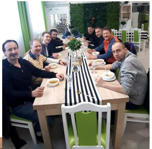
Stärkung muss sein: in Polen aß man auf Einladung des Bürgermeisters gemeinsam zu Mittag. So sieht ein friedliches und menschliches Miteinander aus.

Binnen eines Tages wurden gut zwei Tonnen Sach- und 2800 € an Geldspenden gesammelt. Hygieneartikel, Lebensmittel und Kleidung stapelten sich in Rolands Hauseinfahrt. Von den Geldspenden wurden Medikamente gekauft. „Die Hilfsbereitschaft hat mich überwältigt.