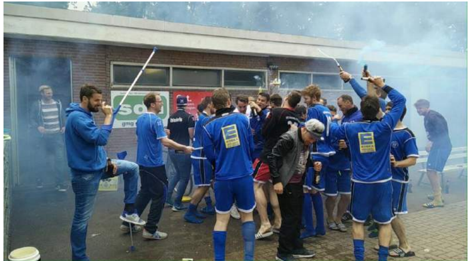
2016 wurde der letzte Bezirksliga-Aufstieg gefeiert. Ob es in dieser Saison wieder soweit ist?

Ebenfalls beginnt jetzt die heiße Phase der Spielzeit, das Saisonfinale rückt näher und die einzelnen Mannschaften wollen Ihre Saisonziele erreichen. Zeitgleich werden in dieser Saisonphase jedoch bereits auch wegweisende Entscheidungen für die nächste Spielzeit wie bspw. die Trainerfrage geklärt und möglichst frühzeitig vereinbart, sodass man Planungssicherheit hat. Wir