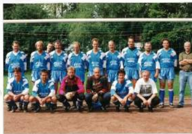
„Alte Herren“ - 1997/1998 Alemannia Pfalzdorf