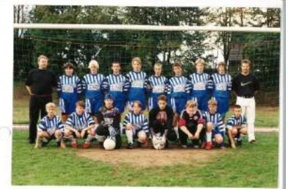
C1 - 1997/1998 Alemannia Pfalzdorf

Günter ist es nach wie vor wichtig sich im eigenen Dorf und Verein zu engagieren. Ganz nach Erich Kästner und dem Motto „Es gibt nichts Gutes, außer: Man tut es“. So trug er sich auch in die jüngste Vereinsgeschichte der Alemannia ein. Im Rahmen der Spendenaktion zum Bau des Kunstrasens erwarb