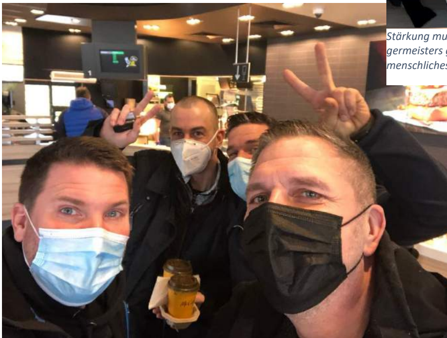
Kaffeepause an der Autobahn-Raststätte.

Innerhalb kürzester Zeit entwickelte sich eine Dynamik, die beispiellos war.“ Freunde, Nachbarn, die Sportskameraden der Alemannia und Einige, die Roland persönlich gar nicht kannte, erschienen an der Wohnanschrift und spendeten fleißig.