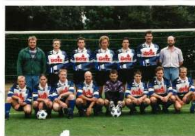
2. Mannschaft - Saison 1995/1996 Alemannia Pfalzdorf