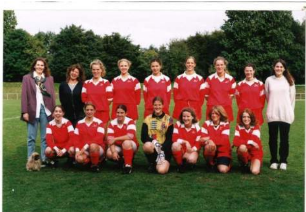
Damen - 1996/1997 Alemannia Pfalzdorf