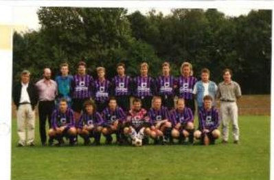
3. Mannschaft - Saison 1994/1995 Alemannia Pfalzdorf