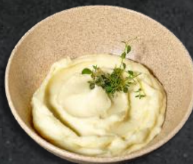
Piure de cartofi (*7) 200g - 14 Lei