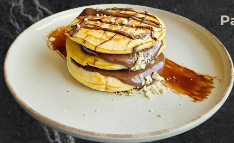
Pancake nutella / nutella și banane pancake 3 buc, nutella (*1,*3,*6,*7,*8) 350g - 31 Lei