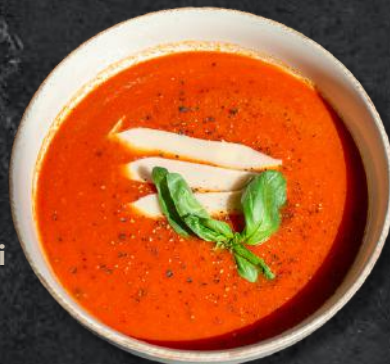
Supă cremă de roșii (*7) 250g – 25 Lei