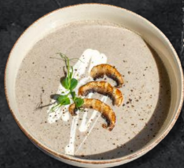
Supă cremă de ciuperci (*7) 250g – 27 Lei