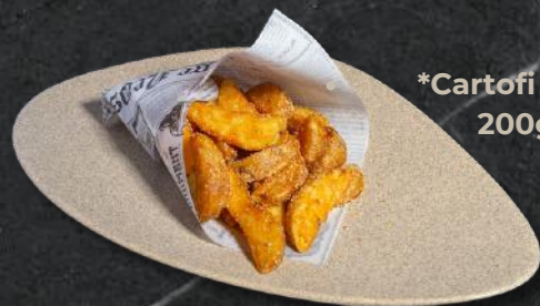
*Cartofi wedges 200g - 14 Lei