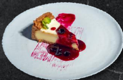
Cheesecake (*1,*3,*5,*6,*7,*8,*11) 140g - 26 Lei