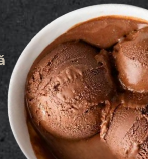
Înghetată diverse sortimente (*7) 50g glob - 8 Lei