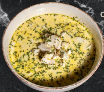
Ciorbă rădăuțeană (*3,*7,*9) 300g/100g – 26 Lei