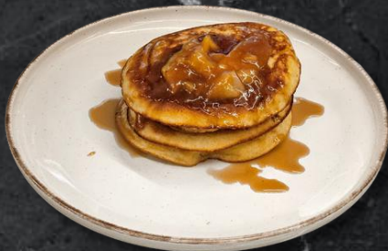
Pancake mere caramelizate pancake 3 buc, mere caramelizate (*1,*3,*6,*7) 350g - 31 Lei