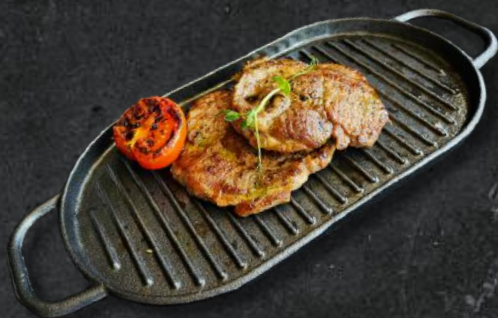
Ceafă de porc la grill 200g – 36 Lei