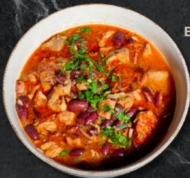
Babgulyás (*1,*3,*9) 300g/100g – 32 Lei