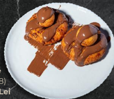
Papanăși cu nutella / mere caramelizate (*1,*3,*7,*8) 230g – 29 Lei