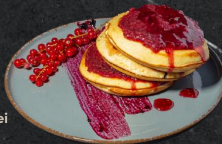
Pancake zmeură pancake 3 buc, dulceață de zmeură, sirop (*1,*3,*6,*7) 350g - 33 Lei