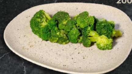
*Broccoli sote (*7) 200g - 19 Lei