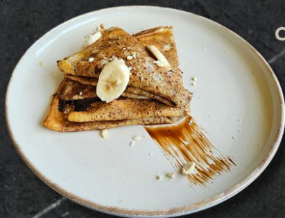
Clătite cu nutella / nutella și banane / mere caramelizate (*1,*3,*7,*8) 200g / 250g – 23 Lei