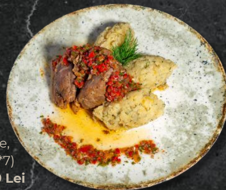
Obrăjori de porc cu cartofi cu lămâie și sos chimichurri *obrajori de porc, cartofi cu lămâie, mărar, sos chimichurri (*7) 400g – 59 Lei