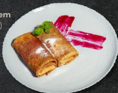
Clătite cu gem (*1,*3,*7) 200g – 20 Lei