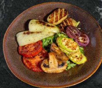
Legume la grill 300g - 18 Lei