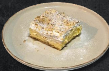
Cremeș de casă (*1,*3,*7) 250g - 28 Lei