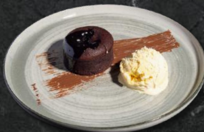
Lava cake cu înghețată de vanilie (*1,*3,*5,*6,*7,*8,*11) 200g – 26 Lei