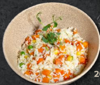
Orez alb 200g - 12 Lei