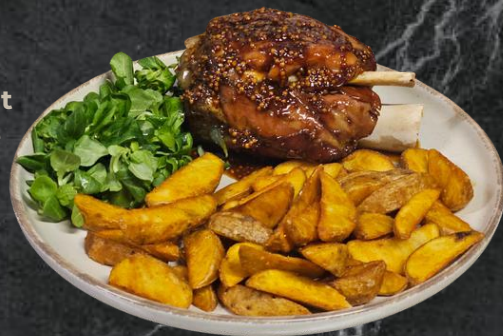
Ciolan glazurat *ciolan cu os, sos de portocale, boabe de muștar, cartofi wedges, valeriană (*7,*10) 800g – 79 Lei