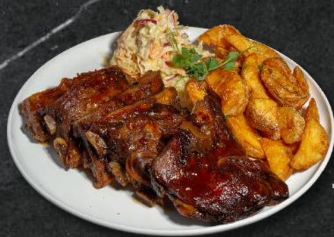
Coaste de porc cu *cartofi wedges și salată coleslaw coaste de porc, *cartofi wedges, salată coleslaw (*3,*6,*7,*10) 750g – 71 Lei