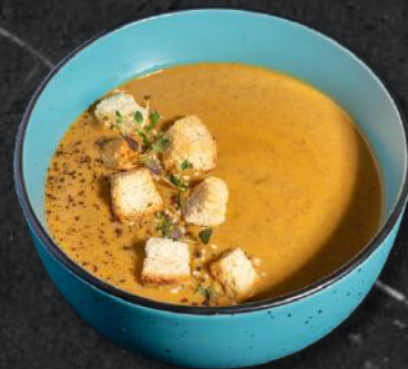
Supă cremă de linte 250g – 21 Lei