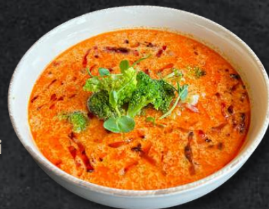
Supă *cheddar cu bere și bacon crocant (*1,*6,*7,*10) 250g/30g – 29 Lei