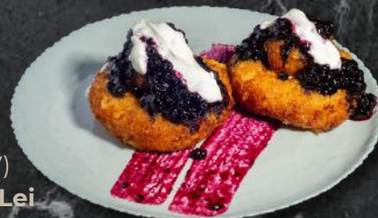
Papanăși papanăși, smântână, dulceață de casă (*1,*3,*7) 250g – 29 Lei