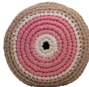
Ροζ / Pink Αγάπη / Love