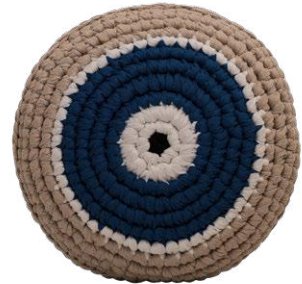
Αμέθυστος / Amethyst Νοημοσύνη / Intelligence