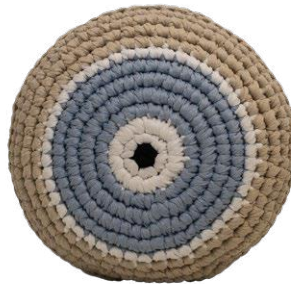
Τιρκουάζ / Turquoise Υγεία / Health