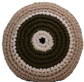
Πράσινο / Green Ευτυχία / Happiness