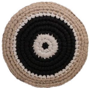
Μαύρο / Black Δύναμη / Power