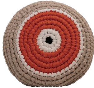
Κοραλί / Coral Προστασία / Protection