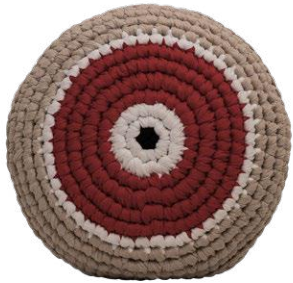
Κόκκινο / Red Κουράγιο / Courage