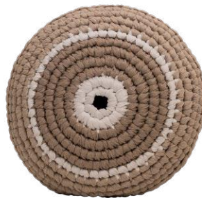
Λευκό / White Πλούτος / Wealth