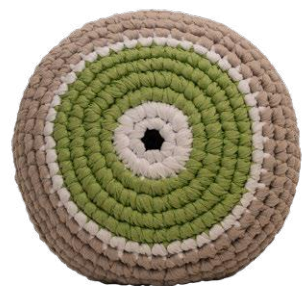
Ανοιχτό Πράσινο / Light Green Επιτυχία / Success