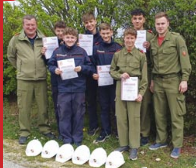
Feuerwehrjugend-Leistungsabzeichen in GOLD