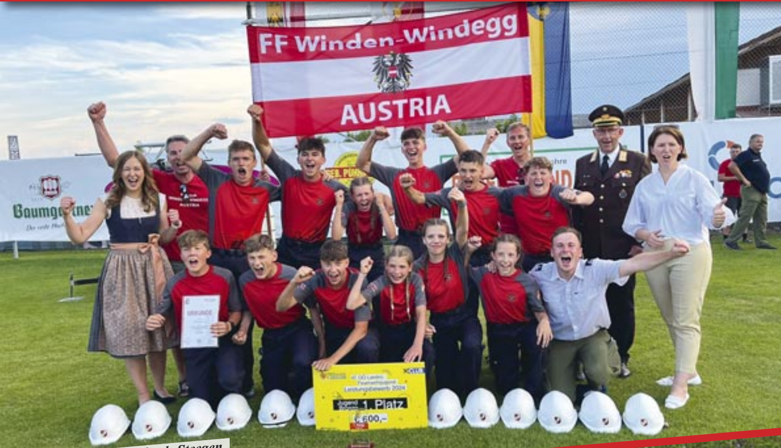
Landessieger in Peuerbach-Steegen