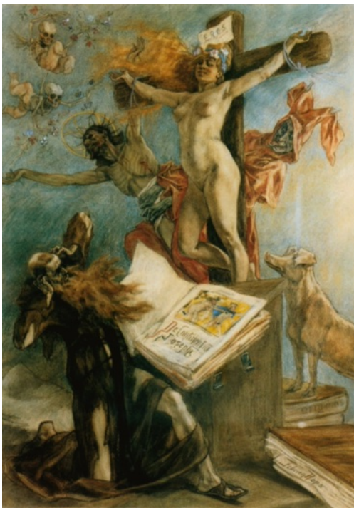
Félicien Rops : la Tentation se Saint-Antoine

vrai belge complet ! Quelques autoportraits emplis de nostalgie témoignent d'une intense vie intérieure. Léon Frédéric, peintre bruxellois, est le fils d'un bijoutier prospère, mais il est le peintre par excellence des pauvres paysans qui vivent misérablement entourés de leurs nombreux enfants. C'est la poésie de la misère, de la résignation. Quelques œuvres présentées y sont cependant plus gaies, comme cette adorable petite fille blonde, entourée de roses dont on sent le parfum. George Minne, célèbre graveur et sculpteur, connu pour ses personnages filiformes dépouillés, fait partie du premier groupe de l'École de Laethem Saint Martin. Sa « fontaine des agenouillés » est très célèbre. On peut en voir un exemplaire au Palais de la nation à Bruxelles.