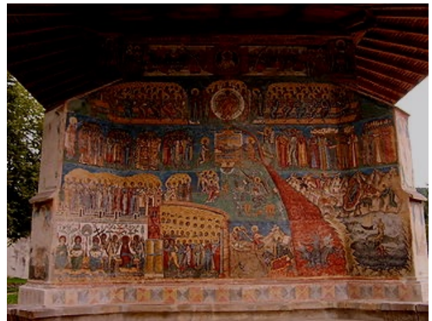
Het monasterie van Voronet: schilderij van de 14e eeuw

twee times lang. De geschiedenis van Roemenië passeerde als een jeugdnovelle, namen als Moldavië, Walachije en Transsylvanië, die ik vroeger eerder associeerde met bloedzuigende vampiers en Dracula kregen een heel eigen gezicht. Historische figuren als Decebal en andere Daciërs werden werkelijkheid en sites als Sarmizegetusa Regia, de koninklijke verblijfplaats, de goudelfplaats Alburnus Maior en de weerkerk Prejmer en die Van Biertan mocht ik leren kennen. Na een drietal velletjes notities gaf ik het op. Zo veel namen, zo veel plaatsen, zo veel indrukken. Gelukkig kon je tijdens de pauze een brochure krijgen met de neerslag van deze fantastische voordracht.