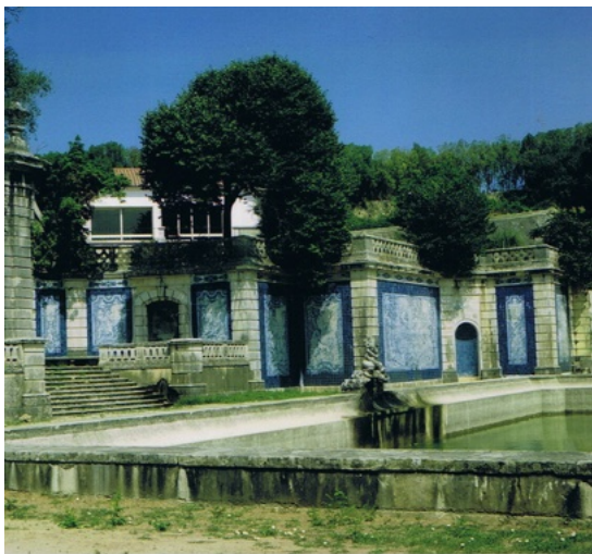
Le jardin du palais