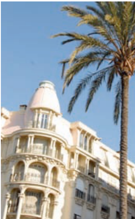
Le Negresco

devant l'Office du Tourisme et des Congrès. Faire le parcours des œuvres d'art qui longent la ligne du tramway avec guide conférencier les vendredis à 19 h (inscription obligatoire à l'Office du Tourisme). A recommander, l'hôtel Durante, adorable maison pleine de charme, un parking privé, des chambres coquettes, un calme absolu, une petite cour plantée de palmiers, d'oliviers et d'orangers qui ombragent quelques tables et un jacuzzi. Sans oublier l'accueil personnalisé et la qualité des services.