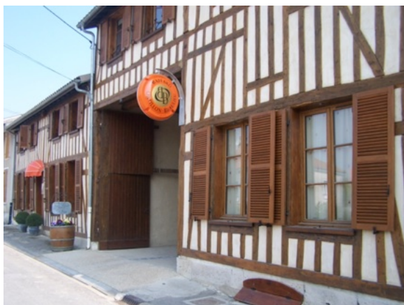
La maison Baffard-Ortillon

trottoirs, un carrefour fluvial, ferroviaire et routier qui constitue déjà un but d'excursion agréable. Saint-Amand-sur-Fion , une étape de charme incontournable, ses rivières, ses moulins, ses lavoirs, ses sentes, ses sources, ses maisons champenoises, la « Merveille », église construite en 1138, l'exposition des anciennes voitures hippomobiles - un des plus beaux villages de France. La ferme du Châtel , à la sortie du village, dans un environnement calme, son château du 18 e siècle, un accueil aux familles et entreprises pour un repas autour d'une grande cheminée. De nombreuses animations y sont organisées toute l'année, avec des soirées à thèmes, des excursions en calèche. L'histoire, le terroir et la gastronomie, la tradition d'hospitalité et la convivialité : unique en Champagne.