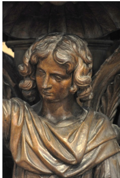
Een engel in de Sint-Vincentiuscollegiale

onder invloed van magma jaarlijks enkele mm opschuiven en hier de felgezochte steen tot juist onder de oppervlakte omhoogstuwde na een spectaculaire reis in tijd en ruimte. Ruim 340 miljoen jaar geleden werd het koraal ter hoogte van de evenaar na afsterven samengeperst onder geweldige druk en wil het nu deze samengeperste massa zijn die de blauwe hardsteen heeft gevormd en verder gestuurd tot hier in Soignies.