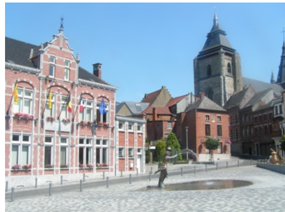
Het stadhuis van Soignies