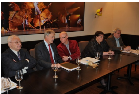
Les représentants de la Province nous accueillent