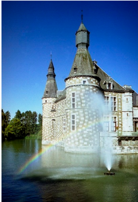
Le typique château à damiers de Jehay