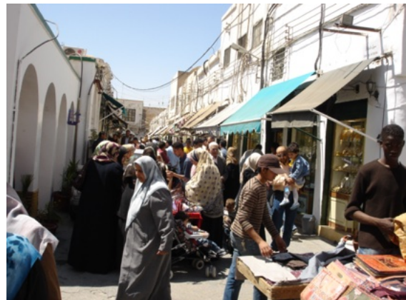
Een drukke straat in Fazzan

(500/700 €). We rijden verder langs het goudkleurig zand, er is landbouw in sommige plaatsen, dadels, tarwe, ajuinen, tomaten, en druiven. Zo komen we in de vooravond aan in Fazzan . In deze stad bracht Kadhafi zijn jeugd door en en ging er naar school. Vanuit Fazzan begint onze “Paris-dakarervaring ». Negen jeeps, telkens een ervaren toeareg chauffeur, 4 touristen, zo rijden we de volgende dagen door de zandzeen en rotswoestijnen. Na 110 km eerste stop om de spanning op de banden van te verminderen, voor we de grote woestijn inrijden, er wordt eveneens getankt (aan 10 cent 0.10 € per liter).