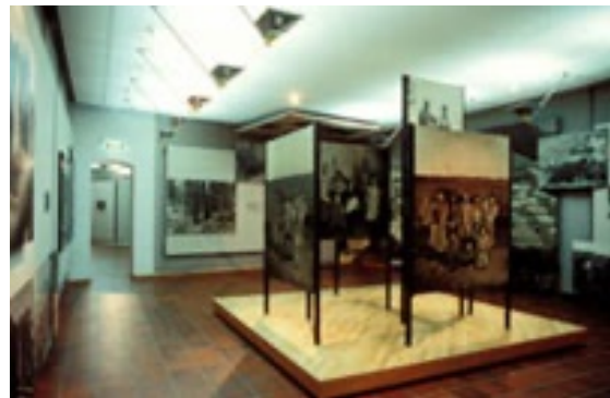
Exposition « The Family of Man » à Clairvaux

Par une belle journée d'automne, nous avons pris la direction de Clervaux, petite cité surprenante. Au départ de Remouchamps, nous avons emprunté la jolie vallée de l'Amblève en direction de Stoumont. Petite halte à Coo, pour revoir sa célèbre cascade. A la « Truite gourmande », vous trouverez des menus 3 services de bonne cuisine régionale, à moins de 10 €.