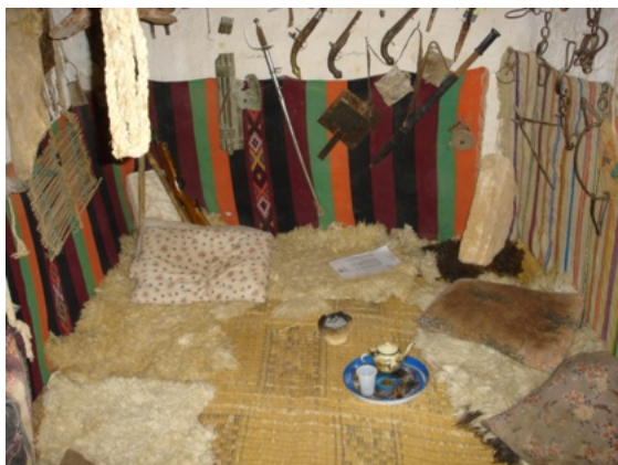
Een typische tent

grootse meren van de Sahara, enkele van de groep springen in het water, zwemmen en zoeken zo afkoeling. We rijden nu naar het mooiste meer Umm al-Maa (Moeder v/h water) het is er prachtig ! In Mandara gelegen staan we voor een uitgedroogd meer. Het word stilaan donker als we in het mooie tentenkamp " Magic Lodge " in Ubari aankomen. Na het opladen van onze bagage en een lekker ontbijt goed uitgerust, vertrekt de karavaan om naar de ruines van Germa te rijden. Egyptenaren, Cartagers, Grieken, Romeinen en andere culturen hebben hier sporen achtergelaten. We bezoeken het Museum en de Hattia Pyramids, verder rijden en rotsen we door de mooie grillige woestijn, na een laatste stop te in Al Awaynet , hebben we nog 35 km voor de boeg.