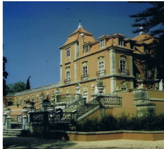
Le palais, côté jardin

dans le parc des ateliers où des maîtres étrangers enseignaient la fonderie et l'élevage des vers à soie. C'est que Pombal avait entrepris d'assurer l'indépendance économique du pays en animant le commerce et en régénérant l'agriculture et l'industrie. Il voulut également vivifier les métiers traditionnels comme la céramique. Le parc du palais est orné de cascades. Mais on y admire surtout un joyau de pierres, une féerie bleu ciel, une galerie tapissée d'azulejos, ces carreaux de faïence émaillée qui sont l'expression traditionnelle de la céramique portugaise. Dans un style baroque, ces azulejos bleus et blancs, soutenus par des murs de granit, forment de somptueux tableaux monumentaux où figurent des scènes mythologiques.