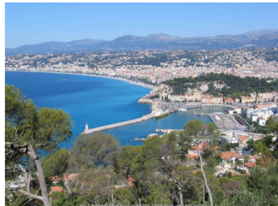
Panorama sur la ville.

Située au sud-est de la France, Nice est un point de jonction entre les Alpes, la Provence, la Corse et l'Italie. Protégée des vents par ses collines, elle bénéficie d'un microclimat exceptionnel qui contribue à sa renommée depuis près de deux siècles. Cependant, Nice n'est plus le paisible lieu de villégiature des nobles anglais, des aristocrates russes et des têtes couronnées de la fin du 19 e siècle. Aujourd'hui, ce grand centre urbain de la Côte d'Azur site exceptionnel entre mer et montagne est devenu la cinquième ville de France ; si la voiture a trop envahi l'espace, la ligne 1 du tramway et les vélos bleus avec 205 km de pistes cyclables sont en train de rendre le trafic plus fluide.