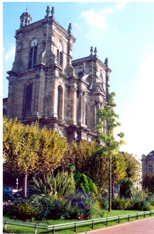
La collégiale

Epris de nature et de culture, avouez que vous n'avez pas songé à découvrir les richesses du bocage champenois, ce territoire pétillant et plein de charme. C'est un lieu idéal pour tous ceux, voulant se nourrir de grand air, de quiétude, souhaitant allier sport et nature dans un cadre enchanteur, qui révèle une nature généreuse autour du lac du Der-Chantecoq, le plus grand lac artificiel d'Europe. Des hommes et des femmes, impatients de vous faire partager leur passion et leur savoir-faire sont prêts à vous initier aux plaisirs de la dégustation des plats du terroir accompagnés du précieux nectar qu'est le champagne. Un vrai bonheur pour nous tous.