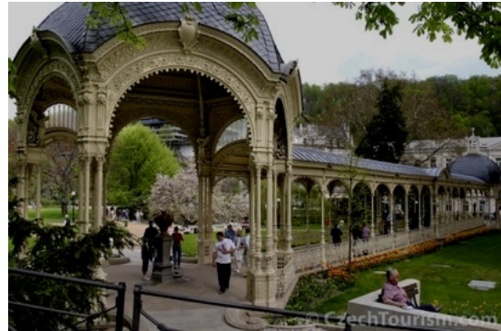
Carlsbad : La colonnade

international du film ( www.iffkv.cz ) et en octobre s'y retrouvent les professionnels du tourisme et du thermalisme. Dans la ville se déroule aussi l'un des plus anciens festivals du film touristique au monde, TOURFILM ( www.tourfilm.cz ).