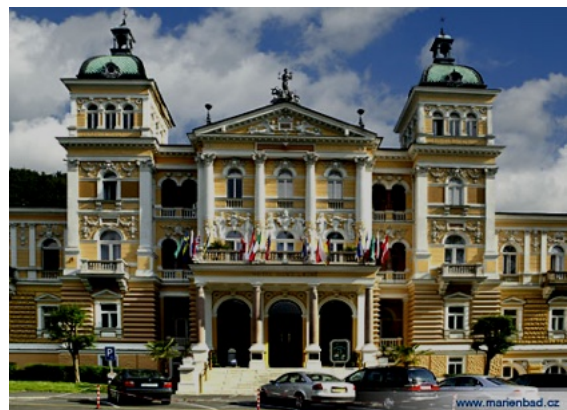
Hôtel Nové Lázně

Nové Lázně (nouveaux bains). J'apprécie de me plonger dans les bains romains, avec leurs belles colonnes en marbre rouge et leurs plafonds peints, ou me plonger dans le bain de la cabine royale, où le roi Edouard VII d'Angleterre aimait se reposer. C'est un lieu superbe recouvert de peintures et de mosaïques. Il y a même une chaise étrange qui n'est pas une toilette, mais une balance. On s'assied et un mécanisme à droite indique le poids. C'est ma grande préoccupation, car je veux rester mince.