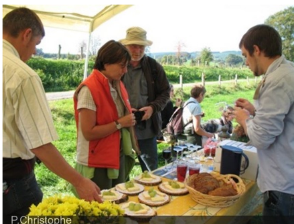
Une balade gourmande au Luxembourg

Un workshop et une conférence de presse conjoints des deux poids lourds du tourisme belge du Nord et du Sud du pays qui ont présenté en mars leurs saisons 2010. Un tel événement ne s'est plus produit depuis les années 80. C'est pourtant ce qu'on fait les provinces de Flandre-Occidentale et du Luxembourg belge dans la Maison du Luxembourg à Bruxelles, en présence des autorités provinciales et d'une brochette d'opérateurs et attractions touristiques. Normal me direz-vous, puisque 60% des touristes du Luxembourg sont néerlandophones et que 3,7 millions de vacanciers à la Côte sont francophones. Il convient néanmoins de saluer cette remarquable initiative qui va au-delà des clivages pour mettre en avant les atouts de chacun au bénéfice de tous.