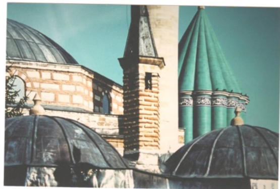
Le monastère soufi à Konya

Pratique : Cercle des Voyageurs, Rue des Grands Carmes 18 à 1000 Bruxelles, entrée libre.