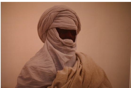
Een Toeareg verwelkomt in het tentenkamp

Na een prachtig bezoek aan Libië met zijn groots verleden en prachtige sites vetrekken we voor een groote 5 daagse avonturentocht door de Libiëse woestijn. Vanuit Tripoli rijden we richting Ghadames , “Parel van de woestijn” genoemd. Ons bezoek begint in het plaatselijk museum met vele voorwerpen uit de Toearegse beschaving, de triomfboog, de resten van Romeinse zuilen enz. Tijdens de wandeling door de oude stad vertelt de gids o.a. over de deuren der huizen, de kleurrijke stukjes stof of leder erop aangebracht, (rood, geel, groen) tonen ons hoe dikwijls de bewoners op bedevaart naar Mekka geweest zijn. We stappen voorbij de Moskee, komen voorbij een waterbron (water 32 °); op het einde van ons bezoek verlaten we de mooie oude stad langs één der zeven oude stadpoorten. In de vooravond trekken we naar de woestijn, voor een prachtige zonsondergang. We sluiten de dag af met een folklorische avond, op het voorplein van de plaatselijke moskee, waar we een typische Toearegse dansavond meemaken (de vrouwenpersonages worden door mannen vertolkt).