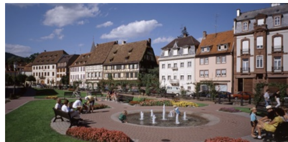
Le Quai Anselmann

souvenirs où il fait bon flâner dans ses rues pittoresques aux maisons à colombages et aux balcons fleuris. C'est une terre de rencontres, un terroir viticole, un pays de caractère, de collines, de vallons et de vignobles, de traditions bien vivaces. Wissembourg est une agréable cité, riche en monuments que les touristes n'ont pas encore envahie. Allons ensemble à la rencontre de la nature et d'un riche passé historique, en suivant l'itinéraire touristique disponible à l'office de tourisme, en mini-train ou en groupe grâce aux visites guidées organisées toute l'année. L'église Saints-Pierre-et-Paul est la plus grande d'Alsace en espace après Strasbourg. Deux périodes de construction distinctes : la romane avec le clocher carré, simple et élégant et la partie gothique achevée au 14 e siècle avec sa tour octogonale. A l'intérieur : une nef harmonieuse, des rosaces et de jolis vitraux, des fresques du 14 e siècle dans le transept droit et en sortant une galerie et deux travées d'un majestueux cloître gothique, jamais achevé et à côté une chapelle aux seize colonnes avec chapiteaux cubiques. Dans la rue Stanislas, nous découvrons l'ancien hôpital où résida le roi déchu de Pologne.