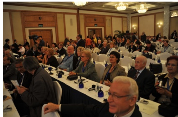
Een deel van de Belgische delegatie.

Later zullen de FIJET protagonisten hun plaats innemen om op hun beurt de loftrumpet te laten schallen. In de zaal: elke stoel, je mag gerust van zetel spreken voorzien van schrijftafel met netjes gemillimeterd twee glazen, twee flesjes water (plat en bruisend), één schrijfblok (negen velletjes: er worden heel wat toespraken verwacht), drie potloden en vier kauwgommetjes. Alles efficiënt onder controle want toen ik strategisch een zitje versierde dicht bij de middengang en na enkele tellen een plaats diende op te schuiven omdat een Italiaanse twaalf-ponder-journaliste onmogelijk kon passeren, had ik (ik geef toe: bewust) twee doosjes kauwgom meegeritst naar mijn nieuwe stek. Binnen de twee tellen werden de doosjes op de plaats waar nu de Italiaanse matrona neerzeeg aangevuld maar de glazen bleven netjes staan. Ik had de flesjes nog niet aangeroerd en dus dienden ze niet te worden vervangen.