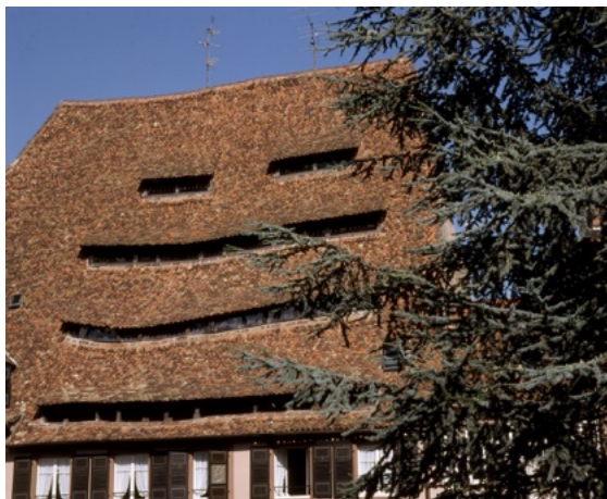
La maison du Sel

La « Petite Venise » est le point de vue depuis la rue de la Passerelle vers l'abbatiale. Plus loin, au n° 35 de la rue Nationale, le Holzapfel, de style gothique, ancienne maison des corporations du 15 e siècle, puis relais de poste où Napoléon 1 er dormit en 1806. Partout, de belles demeures bourgeoises de 1598 et, rue de la Laine, un élégant oriel aux encadrements de fenêtres ciselés. Le musée Westercamp, actuellement fermé pour cause de rénovation, est installé rue du Musée, n°3 dans un superbe bâtiment Renaissance, ancienne demeure de vigneron. De l'église Saint-Jean, construite au 13 e siècle, subsiste le clocher roman. En 1725, on y annonça les fiançailles de Louis XV avec Marie Leszczyńska, fille du roi de Pologne. C'est aujourd'hui un temple protestant. C'est aussi le départ d'une promenade sereine et bucolique à souhait le long des fortifications de 1746 sur l'ancienne muraille du 13 e siècle et au-delà, le quartier du Bruch avec quelques demeures intéressantes. La maison de tanneur « L'Ami Fritz » de 1550, un bel exemple de la Renaissance, qui servit de décor à un film.