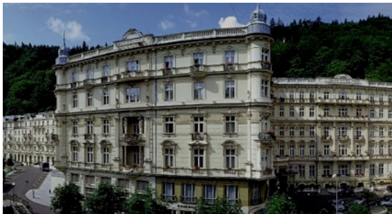
Karlovy Vary : grand hôtel Pupp