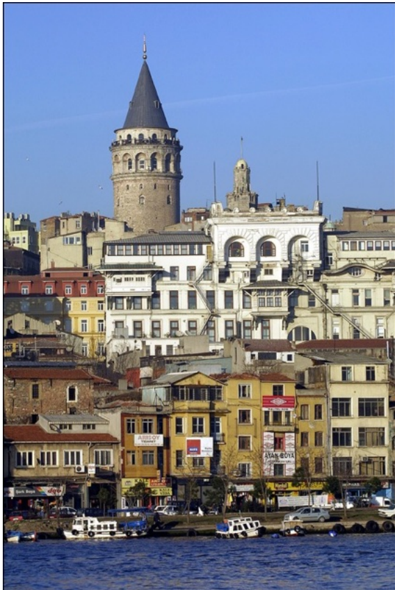
Istanbul: de toren van Galata

Istanbul, Konya, Bursa, Edirne, verplichte etappes en om de Ottomaanse en Seldjukse kunst te ontdekken. Istanbul, legendarische erfenis van Byzantium en Constaninopel... De haven wordt bezocht door cargo-schepen uit de hele wereld en blijft altijd de "Poort van Azië" met zijn Bosphorus, een zeearm van 32 km lang tussen het oostelijke en het westelijke deel van de stad. Dit is ook een museumstad met het Byzantijnse heiligdom Aya Sophia, de christelijke basiliek bij uitstek! Topkapi is een stad in de stad, een uitdrukking van het Ottomaanse rijk, met zeer belangrijke moskeeën waaronder de Suleymaniya, het meesterwerk van Sinan, de architect van sultan Suleyman I.