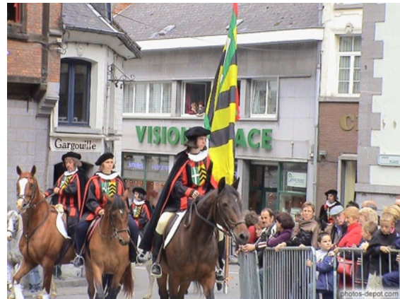
Le Grand Tour Saint-Vincent

Il faut avouer que la pierre bleue est toujours utilisée pour décorer certaines façades. La visite du musée consacré à cette pierre bleue nous parle du rude travail des ouvriers. Un apprentis est reconstitué, on peut y voir tous les outils traditionnels, et une riche collection de fossiles (crinoïdes) qui ont formé cette pierre qui a fait la richesse de la région. On imagine difficilement qu'il y a environ 350 millions d'années, Soignies baignait dans une mer tropicale chaude. Ce centre présente aussi les étapes de la fabrication du verre. La pierre bleue est toujours exploitée : 500 personnes y sont occupées. La seule pierre concurrente est irlandaise : c'est donc une spécialité européenne qui n'est pas délocalisable, ouf !