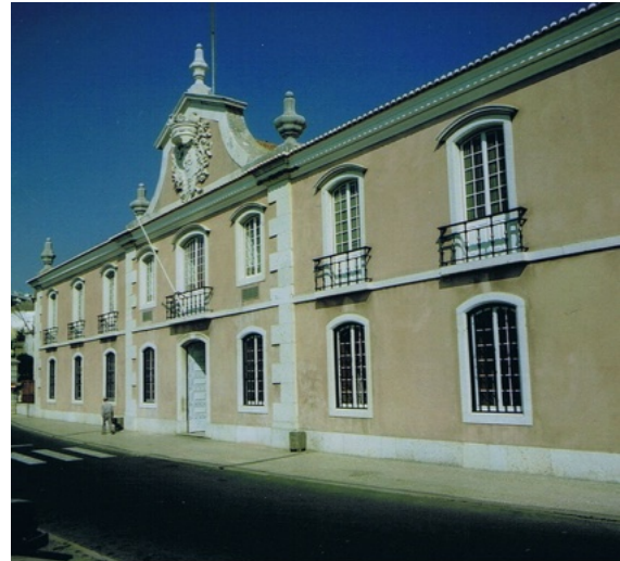
Le palais du marquis de Pombal

Le marquis possédait une forte personnalité, énergique et tenace. Mais il était détesté par le peuple pour son orgueil, sa tyrannie et sa cupidité. C'est une des figures les plus controversées de l'histoire portugaise. Il est entré dans l'histoire comme celui qui sauva Lisbonne après le tremblement de terre du 1 er novembre 1755.