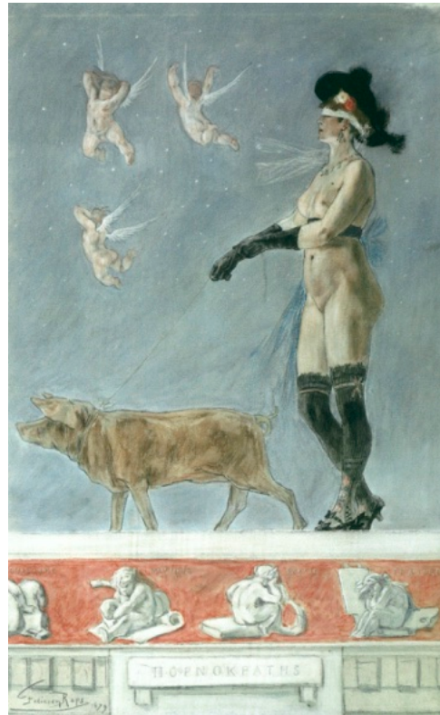
Félicien Rops : Pornokratés

m'a beaucoup impressionnée, Jean Delville, qui peint des personnages criant de vérité, mais dans un décor de rêve. « Orphée mort » représente un visage surgissant des ondes laiteuses. La lumière blafarde qui éclaire la face transcende cette beauté surnaturelle. Son œuvre est placée sous le signe de l'occultisme et de l'ésotérisme.