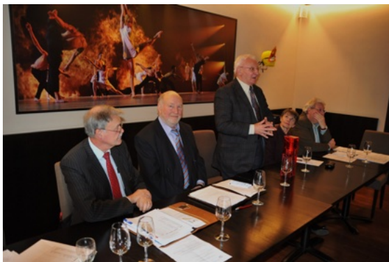
De academische zitting

Tome 2 van “Les histoires de l’oncle George” ging gretig van de hand. (verplichte lectuur!). De sfeer was opperbest en node namen we afscheid van nat en droog voor obligaat streekbezoek. De Collegiale Kapittelkerk waar men in 1290 aan begon en tweehonderd jaar aan bouwde – er was toen nog echt sprake van familiebedrijven – opgetrokken uit zandsteen en kalksteen uit de Zennestreek is groot en groots en dat voor een toch niet zo’n grote gemeente. Duidelijk valen de verschillende stijlen te onderscheiden: Romaans maar met een Gotische toren.