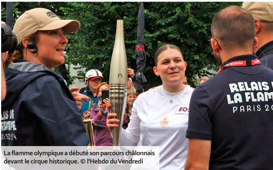
La flamme olympique a débuté son parcours châlonnais devant le cirque historique.