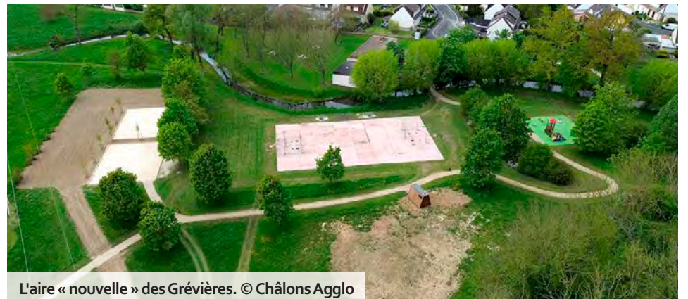
L'aire « nouvelle » des Grévières.

Officiellement inaugurée ce vendredi 5 juillet, l'aire de loisirs rénovée au quartier des Grévières, à Châlons, se dote de nouveaux équipements à la fois ludiques et sportifs. Avec une particularité : la voici désormais labellisée « parcours famille » par la Fédération nationale de pêche, naturellement associée au projet, que portent aussi la mairie de Châlons et le Syndicat mixte de la Marne moyenne. Ce site, implanté à proximité du boulevard de la Croix-Dampierre, est bordé par la rivière de la Blaise. Elle-même a fait l'objet d'aménagements écologiques sur près de 600 mètres linéaires. L'aire « nouvelle » comprend ainsi un cheminement d'environ 300 m 2 , deux mares spécifiquement créées pour favoriser la biodiversité et une zone de pêche partagée, accessible aux personnes à mobilité réduite.