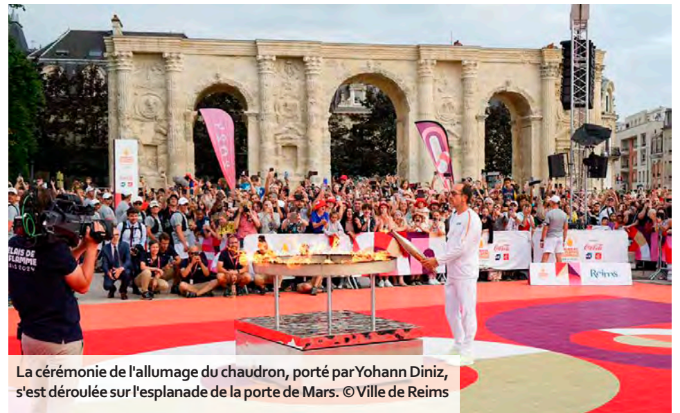
La cérémonie de l'allumage du chaudron, porté par Yohann Diniz, s'est déroulée sur l'esplanade de la porte de Mars.

L e dimanche 30 juin 2024 restera gravé dans l'histoire du département. La flamme olympique a sillonné la Marne, escortée par 157 relayeurs, depuis Vitry-le-François jusqu'à Reims, en passant par Épernay et Châlons. La cité des sacres, ville-étape de ce passage mémorable, a affiché complet sur l'esplanade de la porte de Mars, site choisi pour l'allumage officiel du chaudron, porté par l'athlète sparnacien Yohann Diniz. En présence de nombreux champions, comme