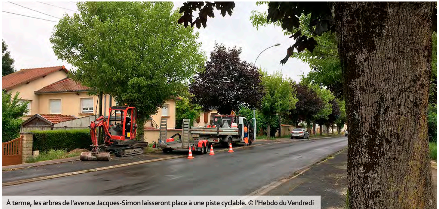
À terme, les arbres de l'avenue Jacques-Simon laisseront place à une piste cyclable.

C'est un chantier d'envergure qui se dessine sur l'avenue Jacques-Simon, à Saint-Memmie, près de Châlons : 13 mois de travaux et 3,6 M€ HT d'investissement, pour une traversée urbaine entièrement repensée dans ses usages, depuis le rond-point des Catalaunes jusqu'à celui de l'hôtel de ville. Pierre angulaire du projet, l'aménagement d'une piste cyclable bidirectionnelle, sur un peu plus d'un kilomètre, nécessite l'enlèvement de 78 érables situés le long de ladite avenue. En 2023, déjà, cette décision municipale s'attirait les foudres de plus d'une centaine de riverains, tous signataires d'une pétition lancée en ligne pour s'y opposer. « On souhaite réorganiser les mobilités sur ce secteur, en déplaçant la voirie de 30 centimètres et en y intégrant des pistes cyclables, justifiait, au printemps dernier, François Gaignette, premier adjoint au maire en charge de l'environnement et de l'urbanisme. Malheureusement, les arbres se retrouve-