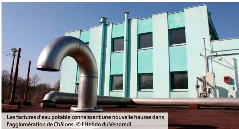
Les factures d'eau potable connaissent une nouvelle hausse dans l'agglomération de Châlons.

Les augmentations des tarifs et redevances appliqués par Châlons Agglo se suivent... mais ne se ressemblent pas. La nouvelle grille votée par les élus en conseil communautaire du 26 juin ne concerne pas les transports en commun, déjà revus à la hausse (+7 % sur les titres « tout public » et « moins de 26 ans ») pour la période allant de septembre 2023 à août 2024. Rien à signaler non plus du côté des piscines, hormis les créneaux dédiés aux associations, plus chers de 1,6 % à 7 % dès la rentrée.