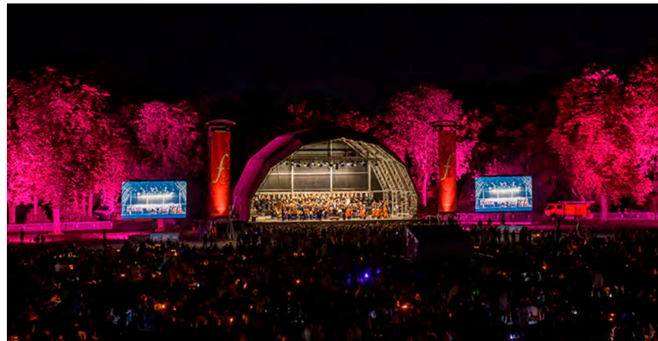
Toujours très attendu, le concert pique-nique se met cette année à l'heure anglaise.

Ce vendredi 5 juillet, à 20 h, le festival de musique invite son public à un concert d'exception, comme à chaque clôture. Cette année, c'est l'ensemble Le Poème Harmonique qui interprètera le Stabat Mater, une œuvre religieuse médiévale que l'on attribue généralement au poète franciscain Jacopone da Todi. À la Renaissance, le rite romain a été mis en musique, et à chaque grande période musicale, un compositeur s'est illustré par sa version, Charpentier à l'âge baroque, Haydn à l'âge classique, et le Poème Harmonique, récemment. Ainsi, c'est une performance magistrale qui attend les Rémois, soulignée par l'atmosphère envoûtante et mystique de la basilique Saint-Remi. Ensuite, à année spéciale (avec les Jeux olympiques !), agenda exception-