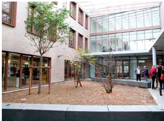
Un protocole d'accord a été trouvé entre l'agglomération et la société Roc Façade.

C'est l'aboutissement d'une longue, très longue, procédure qui se joue pour le campus unique de Châlons. Inauguré chaussée du port à l'automne 2022, ce complexe flamboyant neuf comprenant la réhabilitation des locaux historiques et la construction d'un nouveau bâtiment, représente un investissement d'environ 9 M€. Seul bémol, il a été livré avec des dysfonctionnements donnant lieu à des infiltrations et des fuites d'eau réparties entre différents niveaux : plusieurs bureaux et salles, dont certaines dédiées à l'informatique, l'amphithéâtre, la