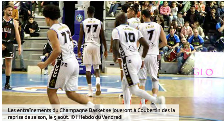
Les entraînements du Champagne Basket se joueront à Coubertin dès la reprise de saison, le 5 août.

En marge de ce remaniement, le Champagne Basket confirme qu'il recentrera ses entraînements quotidiens, pour l'heure organisés principalement