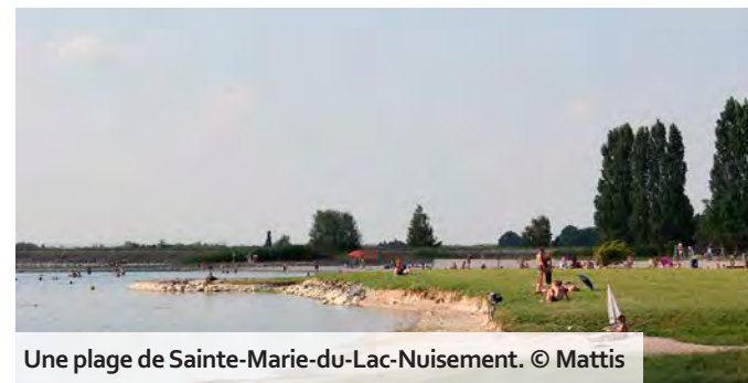
Une plage de Sainte-Marie-du-Lac-Nuisement.

M ême s'il est parfois difficile de s'en rendre compte, l'été est bel et bien là depuis le 21 juin. Comme chaque année à pareille période, l'Agence régionale de santé (ARS) Grand Est a publié le classement de la qualité des eaux de baignade réglementées dans la région, issu des contrôles menés sur les 73 lieux de baignade naturelle surveillés. Il en ressort que 93 % des sites du Grand Est disposent d'une eau de bonne ou d'excellente qualité, au regard des normes européennes. Trois points d'eau de la Marne, à savoir ceux de Giffaumont-Champaubert, Larzicourt et Sainte-Marie-du-Lac-Nuisement, tous rattachés au lac du Der, présentent une « excellente qualité ». La piscine biologique de Connantre, qui ouvrira ce samedi 6 juillet, n'est pas soumise au même classement, mais fait tout de même l'objet de contrôles stricts. Pour évaluer la qualité des eaux, les sites réglementés sont régulièrement surveillés par les exploitants des sites de baignade et les équipes de l'ARS, lesquels diligents également des analyses de contrôle de la qualité de l'eau avant l'ouverture et tout au long de la saison. L'ARS rappelle que la fréquentation des sites non réglementés est formellement déconseillée puisqu'ils peuvent présenter des risques pour la sécurité physique et la santé des baigneurs.