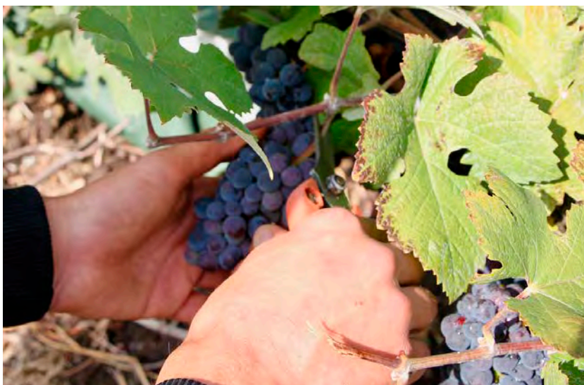
57 victimes, la plupart sans papiers, ont été identifiées.