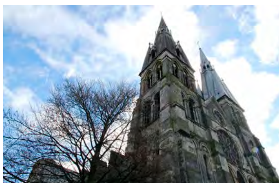
Parmi les insolites : une ascension jusqu'au carillon de Notre-Dame-en-Vaux.

✓ Visites guidées Les Z'Estivales, jusqu'au 31 août, du lundi au samedi à 16 h 30, Châlons Tarif : 7 € (4 € pour les 10-18 ans, gratuit pour les mineurs chaque lundi et vendredi) Réservations : chalons-tourisme.com.