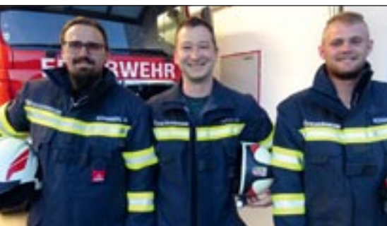
Unsere drei neuen C-Fahrer!

Es war der erste Winter für unser neues Löschfahrzeug. Um sicher unterwegs zu sein, nützten wir die winterlichen Fahrbahnverhältnisse und legten bei einigen Schulungen das Augenmerk auf den richtigen Umgang mit unseren neuen Schneeketten. Alle Teilnehmer waren sehr positiv vom Fahrkomfort überrascht. Im Laufe des Jahres absolvierten wir noch acht weitere Fahrzeugschulungen, bei denen auch unsere B-Fahrer mit dem MTF einbezogen wurden.