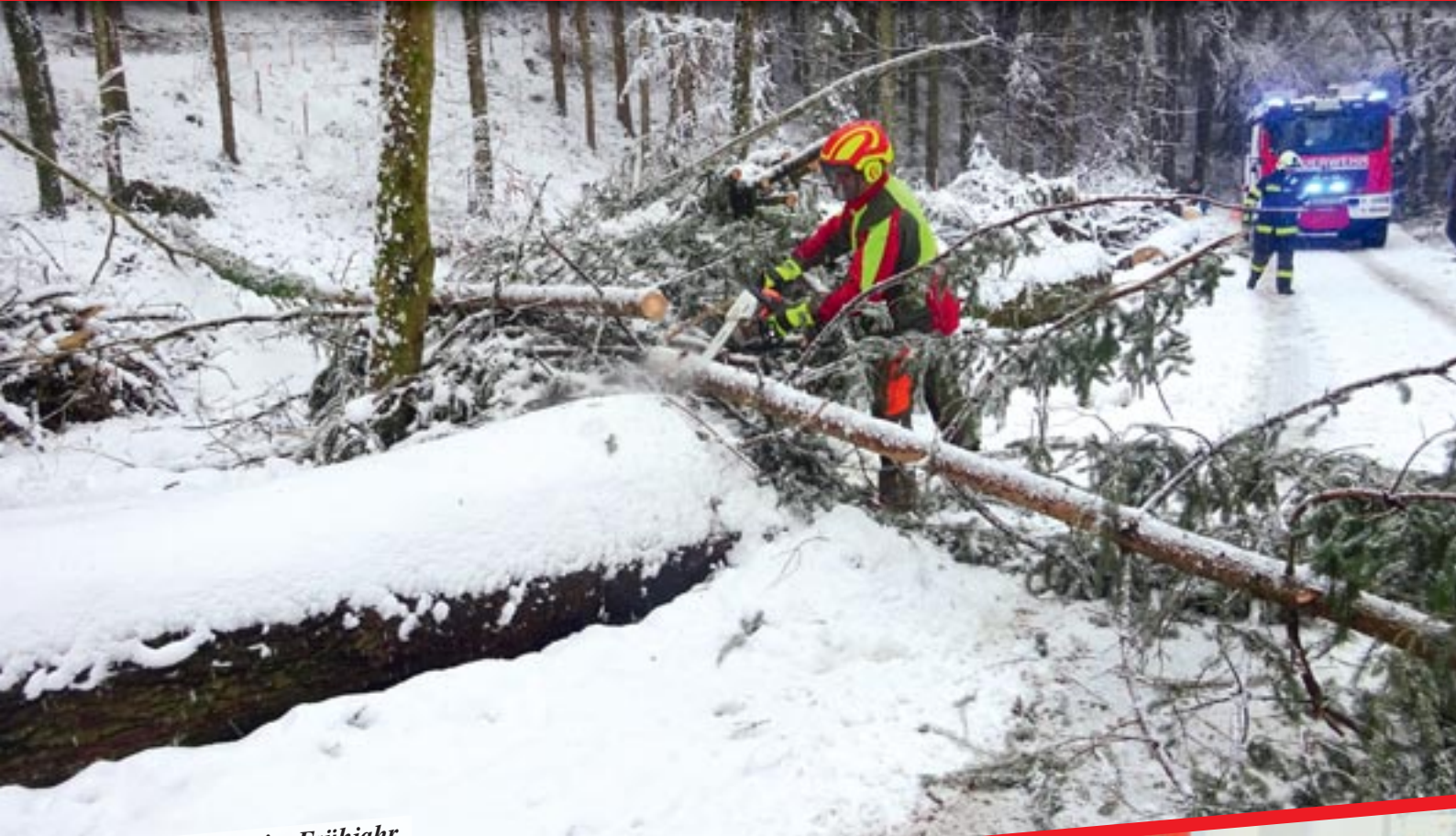
Schneedruck-Einsatz im Frühjahr