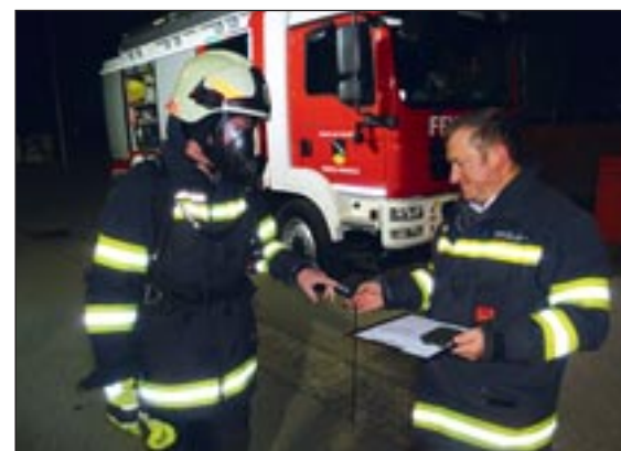
Pulskontrolle beim „Finntest“