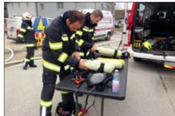
Atemschutzeinsatz in Aisting