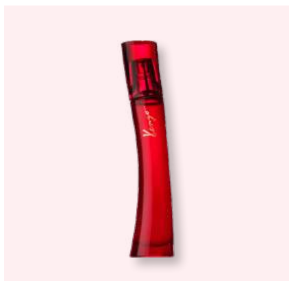
KENZO - Flower by Kenzo Le Rouge. Eau de Parfum

Une fleur rouge vibrante et enveloppante où l'intensité florale se teinte de chaleur pour une signature audacieuse et profondément addictive.