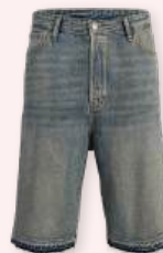
Denim short 49.99 €