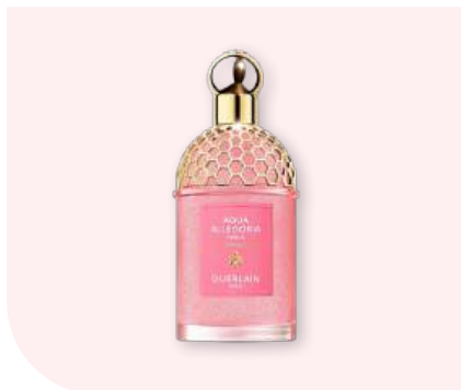
GUERLAIN - Aqua Allegoria Perle Florabloom. Eau de Parfum

Une fleur lumineuse aux accents aquatiques, dont l'éclat se révèle avec délicatesse sur la peau.