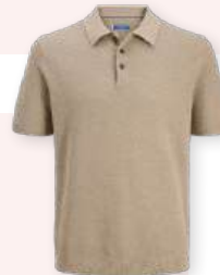
Polo 39.99 €