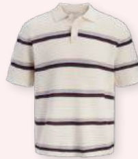
Crochet polo 39.99 €