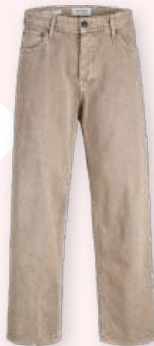
Jeans 39.99 €