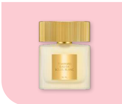
TOM FORD - Eau de Soleil Blanc. Eau de toilette

Une caresse sur la peau où la fraîcheur rencontre la sensualité et habille la peau d'une odeur élégante.