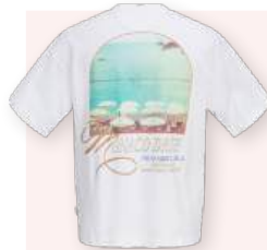
T-shirt 19.99 €