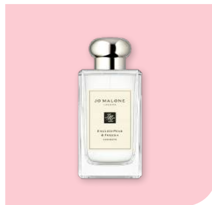
JO MALONE LONDON English Pear & Freesia. Cologne

Une poire juteuse délicatement enveloppée de freesia, pour un sillage frais et naturellement sophistiqué.