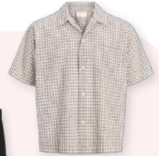
Shirt 39.99 €