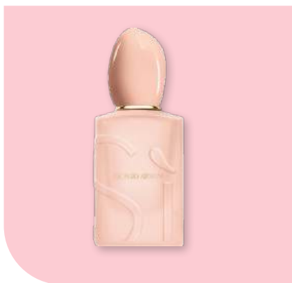
ARMANI - Si Nude Bloom. Eau de Parfum

Un voile floral délicat, pensé comme une seconde peau qui sublime la féminité avec élégance.