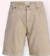
Denim short 34.99 €