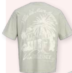
T-shirt 19.99 €