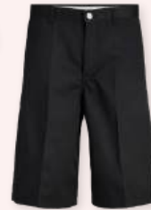
Denim short 34.99 €