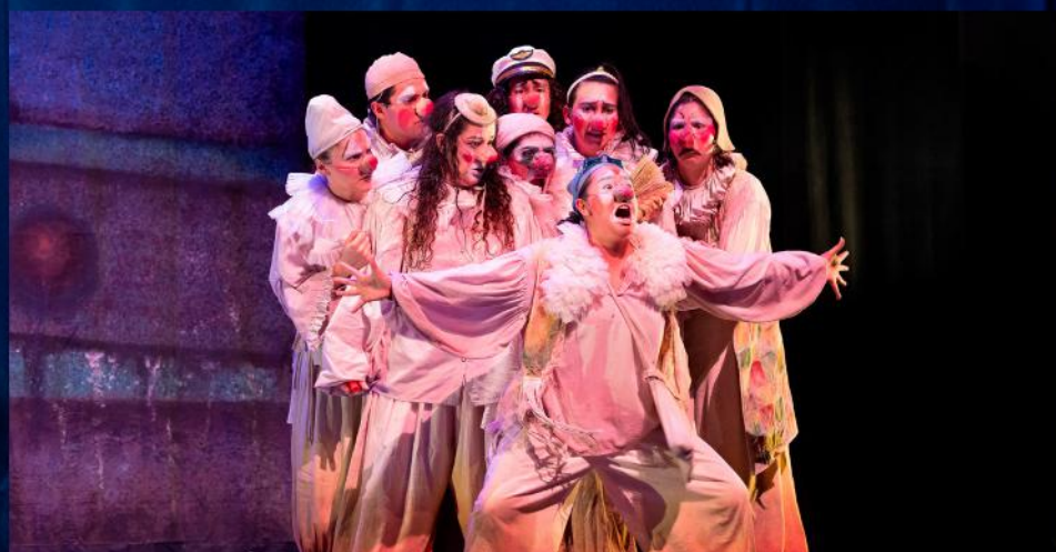
El navío de los ingenuos , de Aziz Gual.