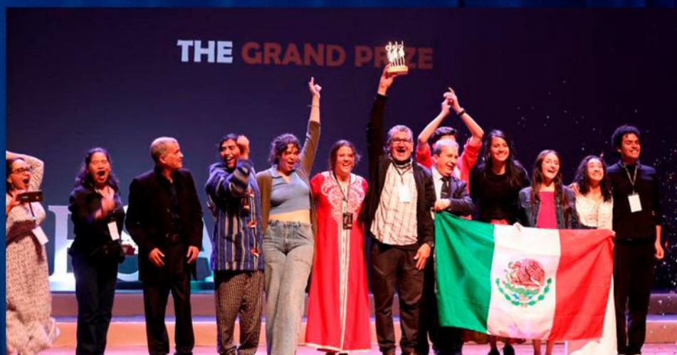
Premio a Mejor Obra y Mejor Escenografía en el 9.º Festival Internacional de Escuelas Superiores de Arte Dramático (FIESAD) en Rabat, Marruecos.

Colectivo emergente formado por egresados del CUT-UNAM. Con la obra El navío de los ingenuos , de Aziz Gual, ganó los premios a Mejor Obra y Mejor Escenografía en el 9.º Festival Internacional de Escuelas Superiores de Arte Dramático (FIESAD) en Rabat, Marruecos, y fue finalista en el 30.º Festival Internacional de Teatro Universitario, donde recibió Mención Honorífica por Ensamble Actoral; también formó parte del 10.º Encuentro Internacional de Clown del Centro Cultural Helénico.