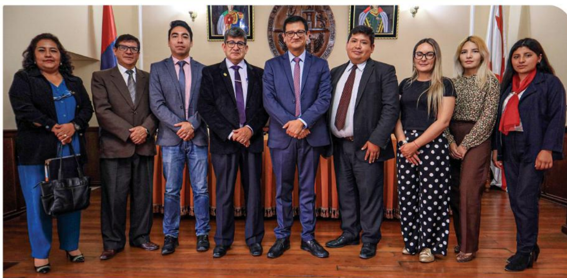
25 de septiembre de 2023, se efectúa la reactivación de la Sociedad Científica de Estudiantes de la Facultad de Contaduría Pública y Ciencias Financieras – SOCECOFICO y se posesiona a su Consejo Directivo.