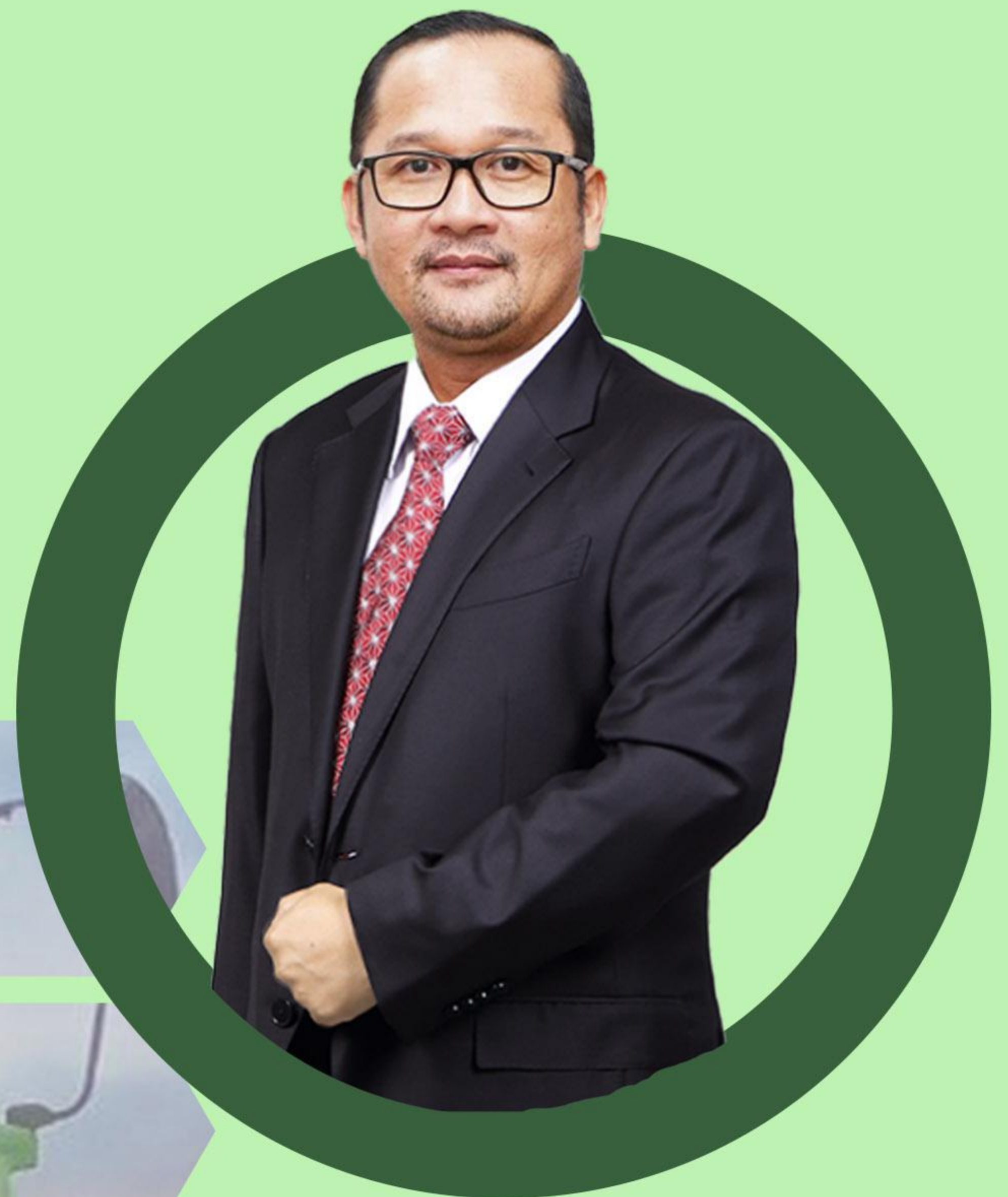
DEDI HARAPAN KOMISARIS UTAMA