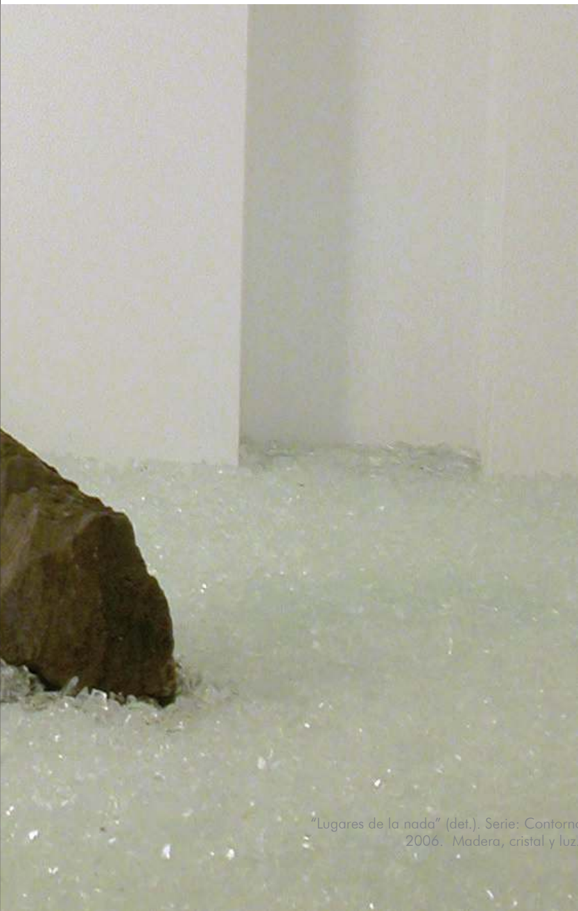
"Lugares de la nada" (det.). Serie: Contornos del silencio. 2006. Madera, cristal y luz. 45 x 80 x 60.