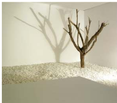
“Espacios contemplados” (det.). Serie: Contornos del silencio. 2005. Madera, marmolina y luz. 80 x 75 x 120.