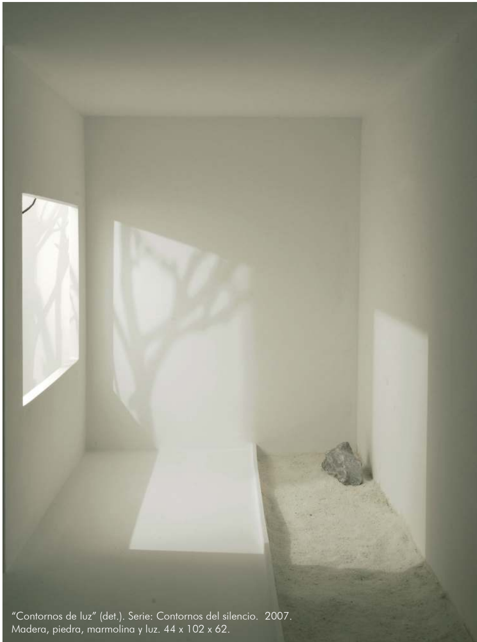
"Contornos de luz" (det.). Serie: Contornos del silencio. 2007. Madera, piedra, marmolina y luz. 44 x 102 x 62.