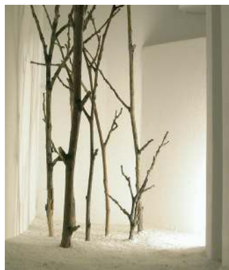
"Cobijos" (det.). Serie: Contornos del silencio. 2006. Madera, polvo de marmol, luz y sonido. 45 x 70 x 40.

caso, se complemente con un sonido de respiración, de un corazón que palpita, que marca el ritmo de la vida humana y se armoniza sutilmente con el sonido vital de quien contempla la obra. En estas obras el artista consigue que lo que muchas veces nos pasa desapercibido por el ruido, que no por el sonido, en el que vivimos, adquiera una magnitud de primer orden. Nos recuerda el valor infinito del silencio, esa pausa a veces inquietante pero sin duda necesaria para que la consciencia nos permita discernir cuales son los sonidos válidos. En la música, en el arte, en la vida, el silencio es como poco tan importante como el sonido. El silencio interior es el que nos hace escuchar más que oír y, aliado con otros sentidos, nos lleva a ver más que a mirar. Y quizá a volver al silencio.