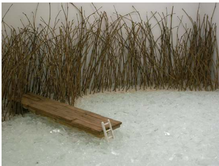
"Entornos del silencio" (det.). Serie: Contornos del silencio. 2005. Madera, cristal, plástico y luz. 40 x 100 x 50.