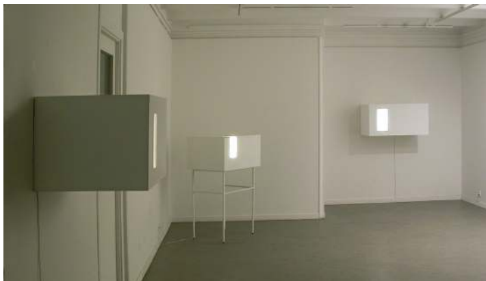
Contornos del silencio, galería Egam. Madrid, 2006.