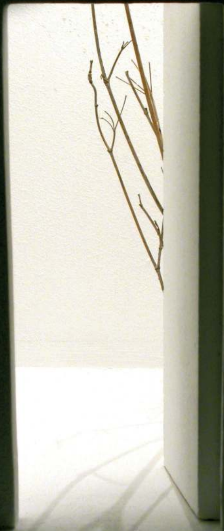
"Espacios habitados I" (det.). Serie: Contornos del silencio. 2006. Madera y luz. 36 x 62 x 51.