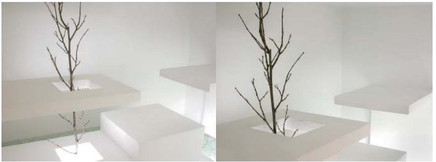
"Espacios de trascendencia" (det.). Serie: Contornos del silencio. 2005. Madera, cristal y luz. 50 x 75 x 60.