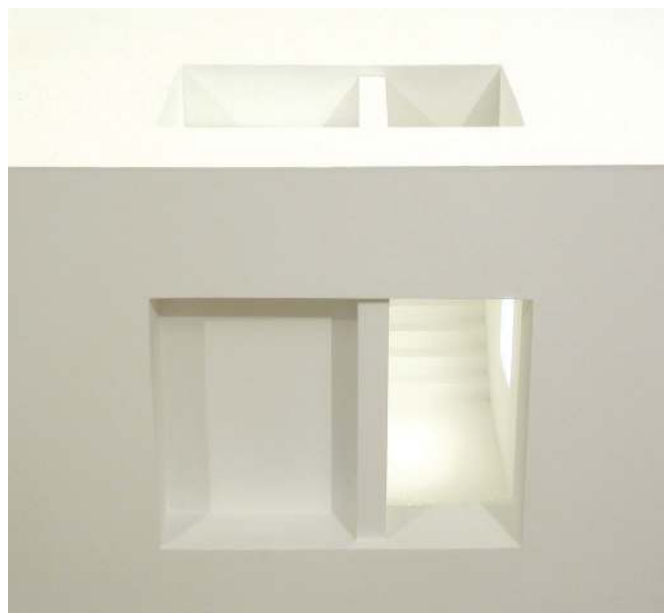
“Espacios (in)mutables” (det.). Serie: Contornos del silencio.2006. Madera, cristal y luz. 51 x 60 x 120.

un lago artificial son objetos que ponen al ser humano en una dimensión muy pequeña, pero también son elementos que indican tránsito, aportan una sugerencia de salida, de camino, de movimiento hacia otro lado.