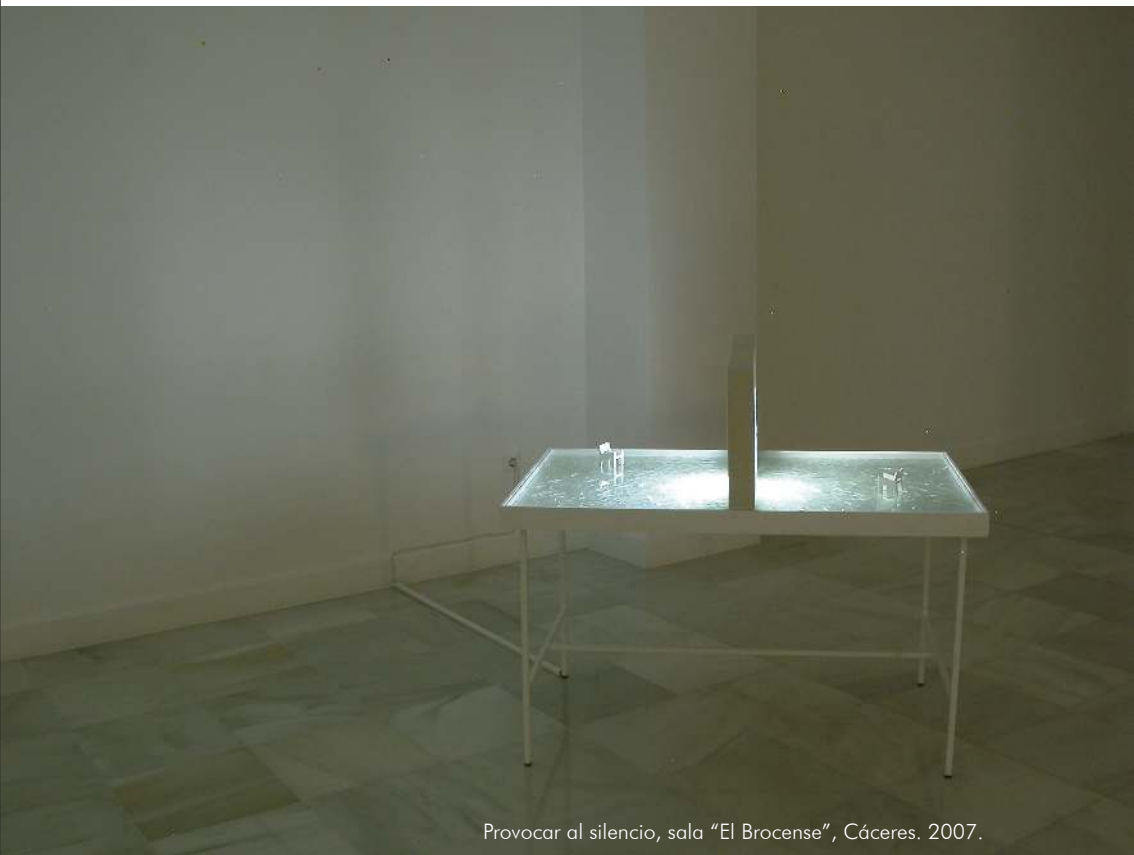
Provocar al silencio, sala "El Brocense", Cáceres. 2007.

espacio nos conducen por un laberinto ordenado en busca de algo que siempre está más allá, que no se ve, pero se intuye.