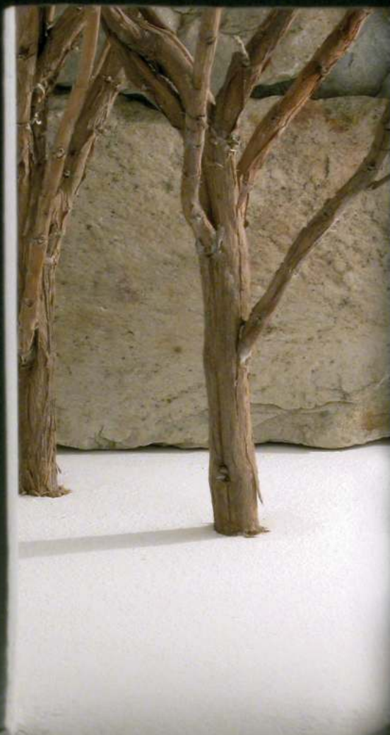
"Espacios habitados II" (det.). Serie: Contornos del silencio. 2006. Madera, piedra y luz. 36 x 62 x 49.