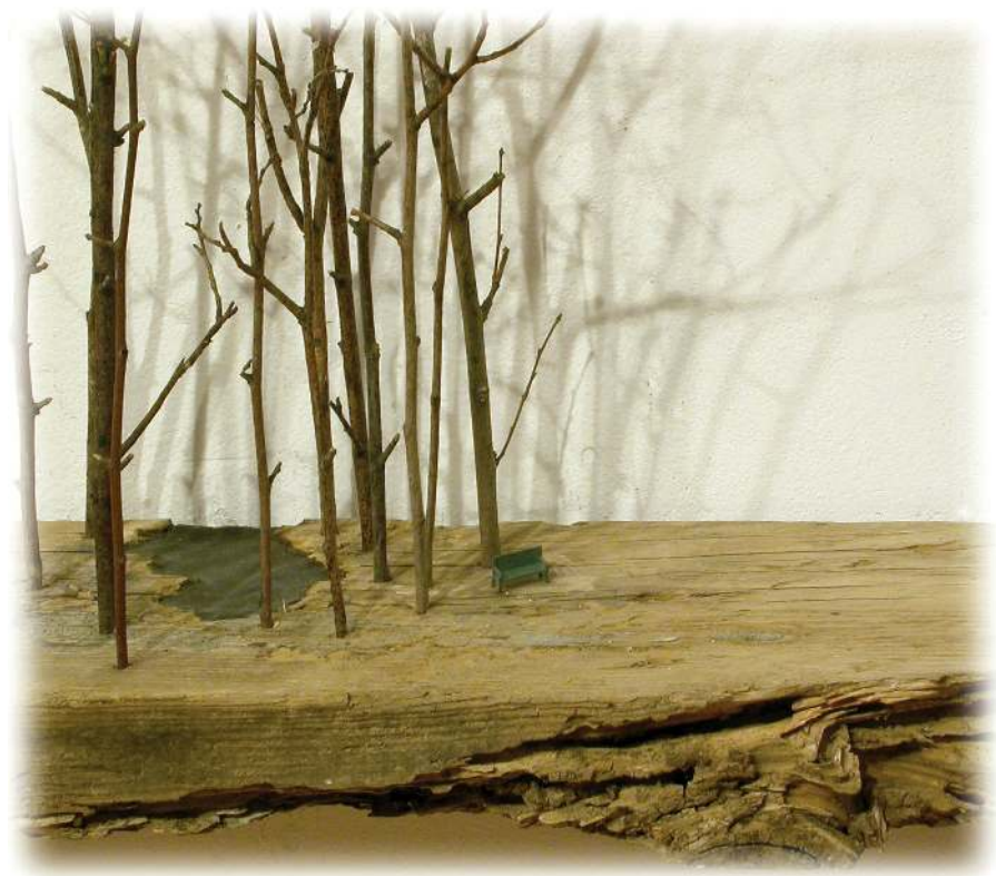
“Residuos” (det.). Serie: Contornos del silencio. 2006. Madera, plástico y cera. 49 x 79 x 15.