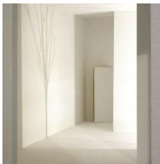
“Desplazar el silencio” (det.).Serie: Contornos del silencio. 2006. Madera y luz. 40 x 120 x 60.